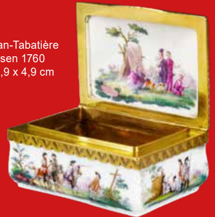
Porzellan-Tabatière Meissen 1760 3,6 x 6,9 x 4,9 cm