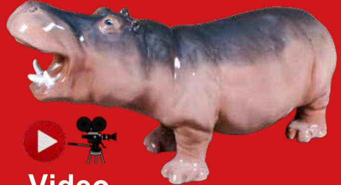
Royal Copenhagen um 1900 Entwurf von Prinzessin Marie von Dänemark H=17,9 cm