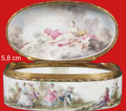
4,3 x 10,4 x 5,8 cm