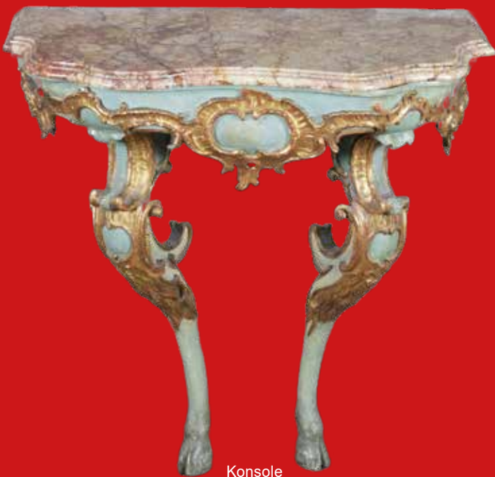
Konsole Franken 1745-50 82 x 80 x 44 cm