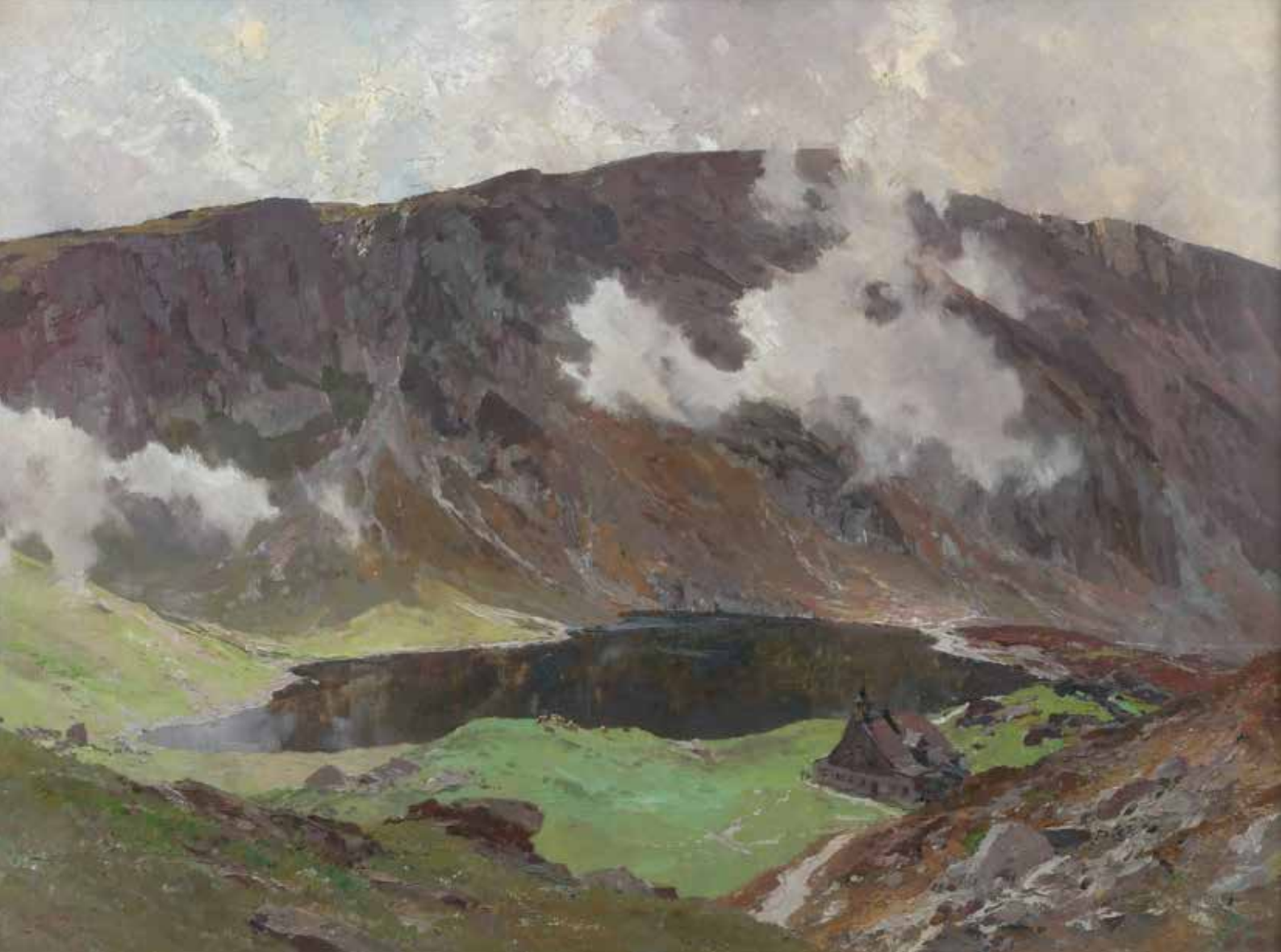
Edward Harrison Compton (1881-1960), Samotnia-Hütte, Öl/Lw., li./u./sign., ger. 70 x 96 cm