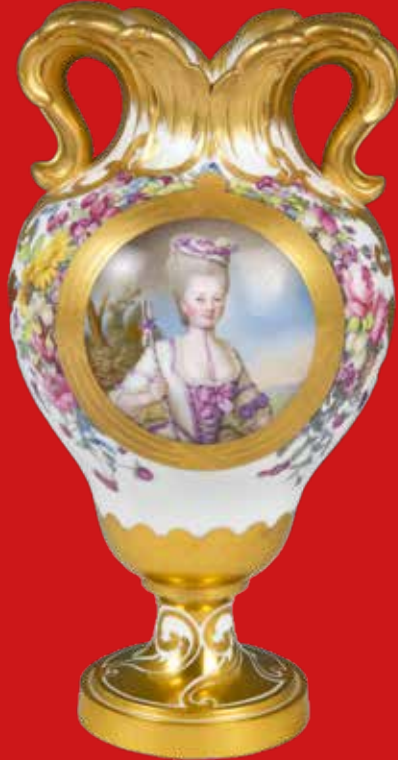
Königliche Vase, Sèvres 1774-75 Portrait Marie Clotilde Prinzessin von Frankreich Malerei von Pierre-Nicolas Pithou H=19,7 cm