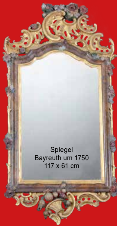
Spiegel Bayreuth um 1750 117 x 61 cm