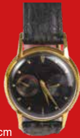
D=3,5 cm LeCoultre Futurematic Schweiz um 1953, vergoldet