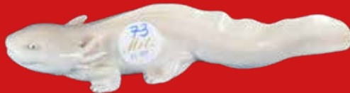
Royal Copenhagen um 1900 Entwurf Carl Liisberg L=24 cm