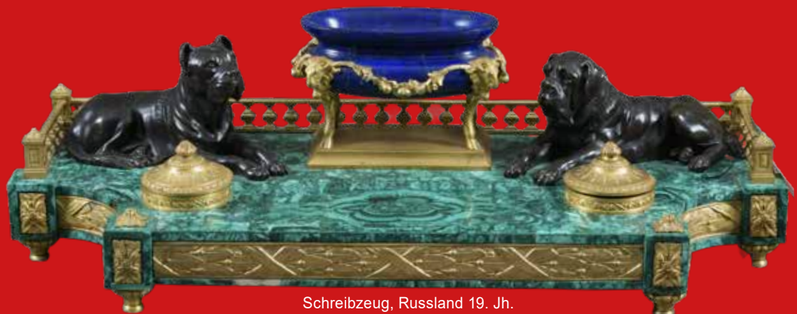
Schreibzeug, Russland 19. Jh. Malachit, Lapislazuli, feuervergoldete u. brünierte Bronze 25 x 73 x 29,5 cm