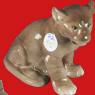
Rosenthal 1929 Entwurf von Willy Zügel H=15 cm