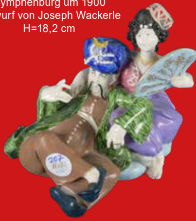
Nymphenburg um 1900 Entwurf von Joseph Wackerle H=18,2 cm