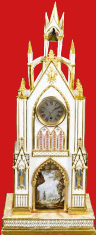
Bedeutende Prunktischuhr Paris, Dagoty et Honoré 1812-1820 H= 66,6 cm