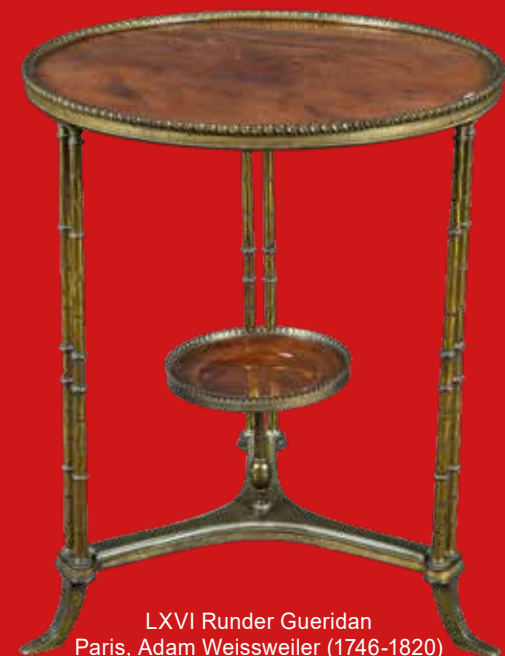
LXVI Runder Gueridan Paris, Adam Weissweiler (1746-1820) 76 x 60 cm