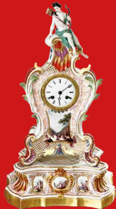
Tischuhr auf Sockel, Meissen 1730-35 Modell von Johann Joachim Kaendler H=50 cm

Katalog abrufbar ab 4. Juli 2026 metz-auktion.de