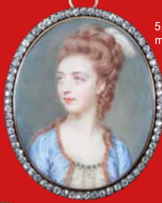
4,7 x 4 / 5,4 x 4,5 cm mit Rahmen