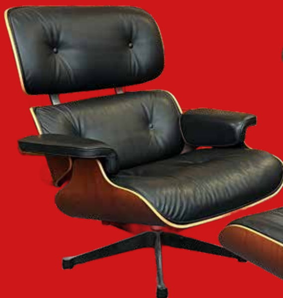
Vitra Lounge-Sessel und Ottoman Entwurf von Charles & Ray Eames Metallgestell, Holz mit Lederbezug