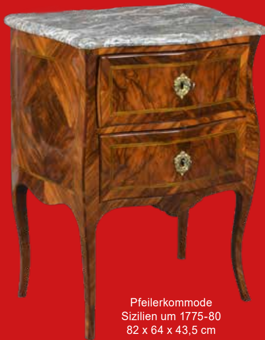
Pfeilerkommode Sizilien um 1775-80 82 x 64 x 43,5 cm