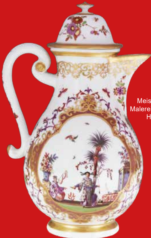
Kanne Meissen 1723-24 Malerei J. G. Hoeroldt H=20,5 cm