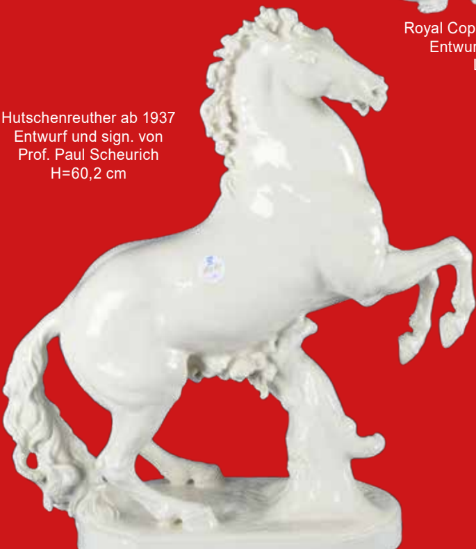
Hutschenreuther ab 1937 Entwurf und sign. von Prof. Paul Scheurich H=60,2 cm