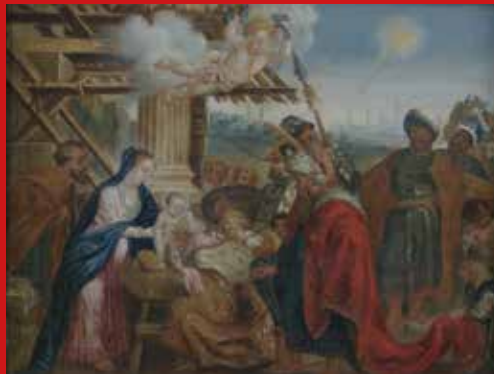
Flämischer Meister des 17. Jhs, Öl/Holz, ger., 20 x 25,5 cm