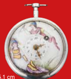
D=5,1 cm Spindeluhr Girardier L'ainé Genf um 1800, Silber