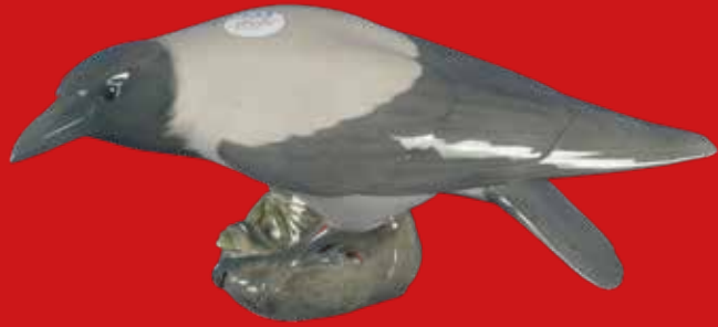
Royal Copenhagen um 1900 Entwurf von Christian Thomsen H=15,3 cm