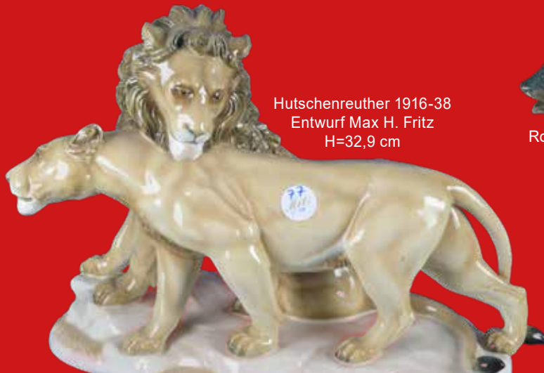
Hutschenreuther 1916-38 Entwurf Max H. Fritz H=32,9 cm

Eine leidenschaftliche, museale Porzellansammlung des 20. Jhs.