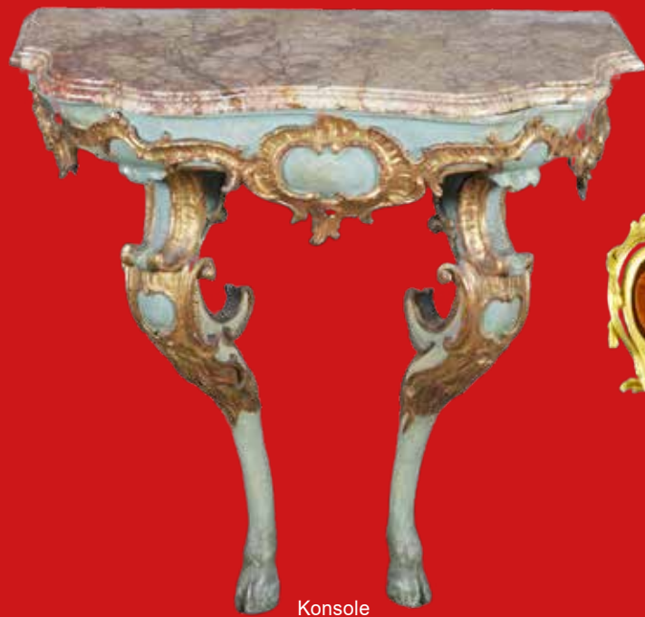
Konsole Bamberg 1745-50 82 x 80 x 44 cm