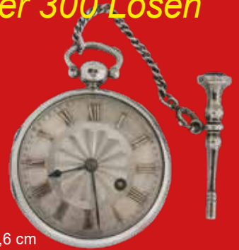
D=4,6 cm Spindeluhr London 1831, Silber