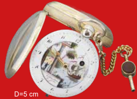
D=5 cm Spindeluhr, Colladon & Fils Genf um 1800 vergoldet