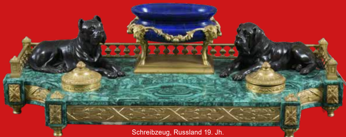
Schreibzeug, Russland 19. Jh. Malachit, Lapislazuli, feuervergoldete u. brünierte Bronze 25 x 73 x 29,5 cm