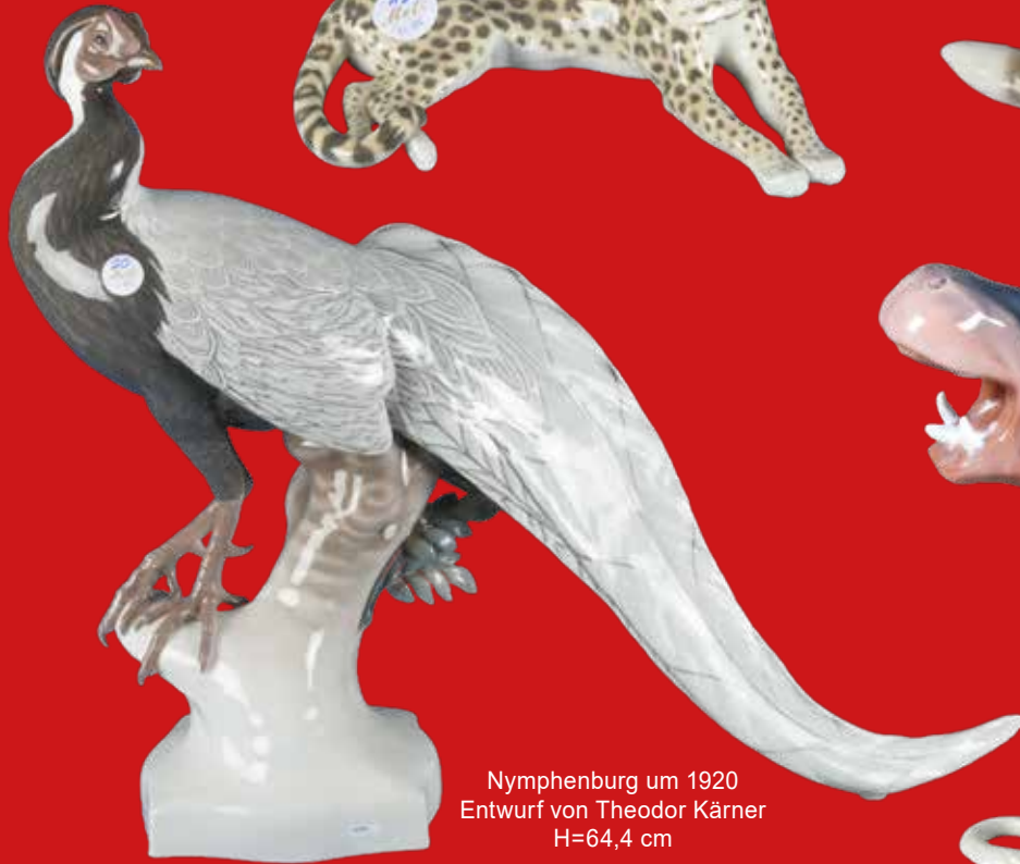
Nymphenburg um 1920 Entwurf von Theodor Kärner H=64,4 cm