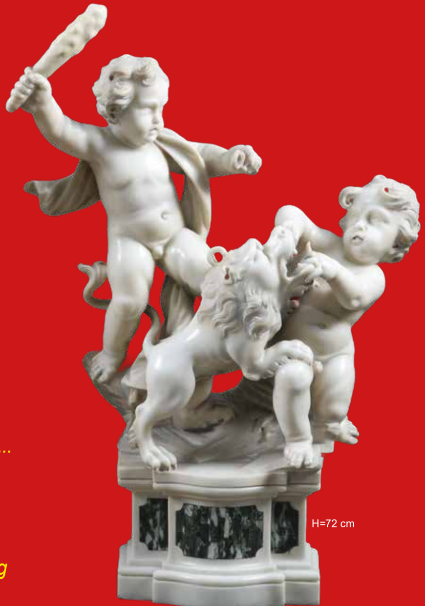
Paar Rokoko Puttengruppen Neapel, Meister Giuseppe Sanmartino (1720-1793) Marmor, poliert