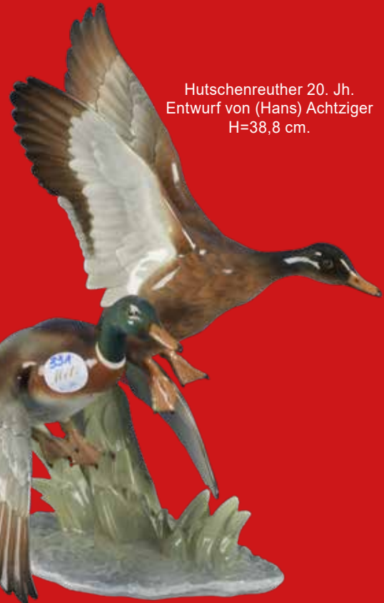
Hutschenreuther 20. Jh. Entwurf von (Hans) Achtziger H=38,8 cm.