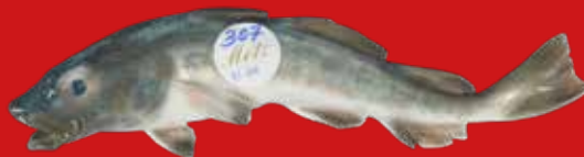
Royal Copenhagen um 1900, Entwurf Carl Liisberg L=25 cm