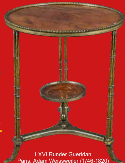
LXVI Runder Gueridan Paris, Adam Weissweiler (1746-1820) 76 x 60 cm