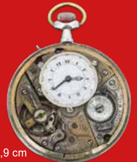
D=4,9 cm Taschenuhr für den türkischen Markt Schweiz um 1900 Silber