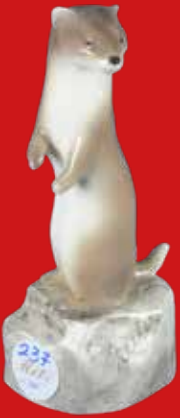
Goldscheider Wien Entwurf von Paul Zeiler H=16,9 cm