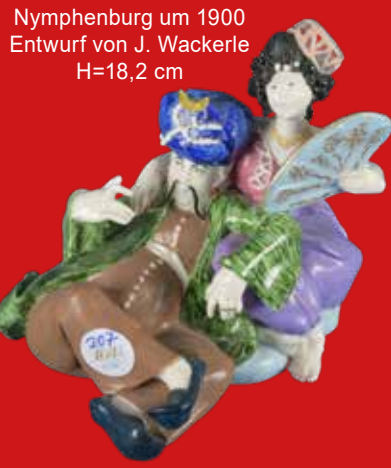
Nymphenburg um 1900 Entwurf von J. Wackerle H=18,2 cm