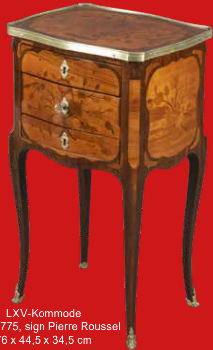
LXV-Kommode Paris 1775, sign Pierre Roussel 76 x 44,5 x 34,5 cm