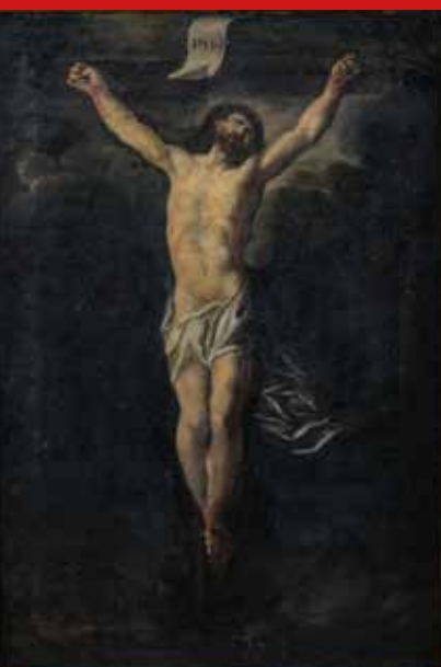
Italienischer Meister des 18. Jhs. Kreuzigung Jesu. Öl/Lw., gerahmt 66 x 46 cm

Katalog abrufbar ab 4. Juli 2026 metz-auktion.de