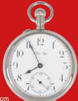
D=4,8 cm Taschenuhr, Pavel Bure Schweiz/Russland um 1930 Metall