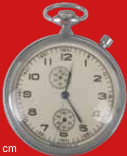
D=5,0 cm Dienstuhr für russische Offiziere UdSSR 1955 Moskauer Uhrenfabrik Metall