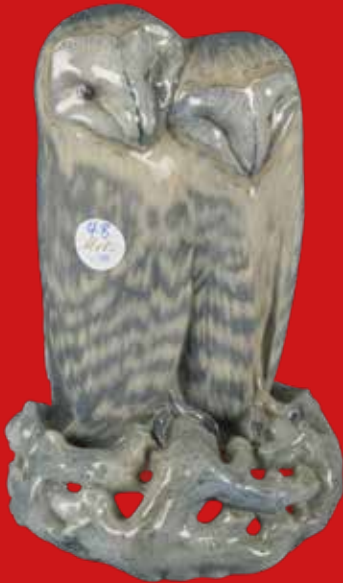
Royal Copenhagen um 1900 Entwurf von Arnold Krog H=32,3 cm