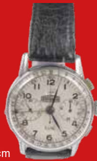
D=3,7 cm Angelus Triple Date Chronodato Schweiz um 1945 versilbert