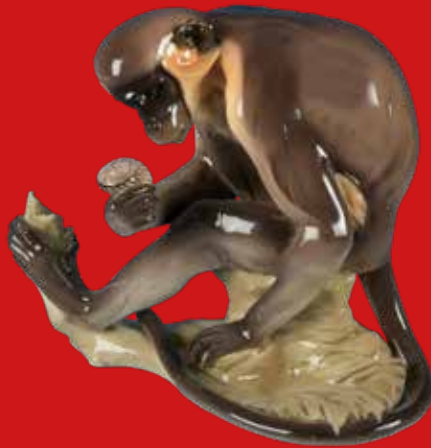
Nymphenburg 1913 Entwurf von Theodor Kärner H=23,8 cm