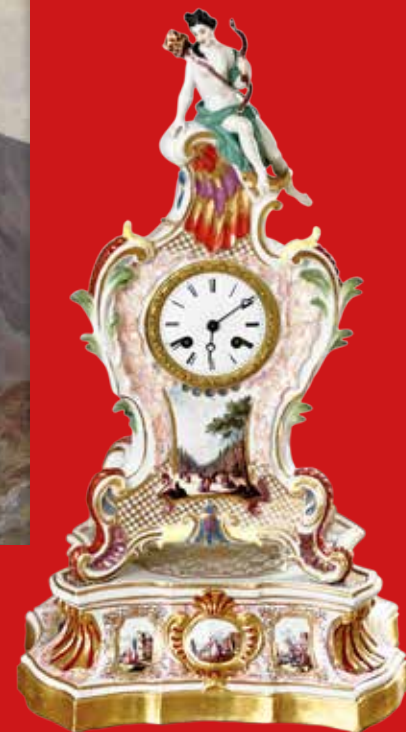
Tischuhr auf Sockel, Meissen 1730-35 Modell von Johann Joachim Kaendler H=50 cm

Katalog abrufbar ab 4. Juli 2026 metz-auktion.de