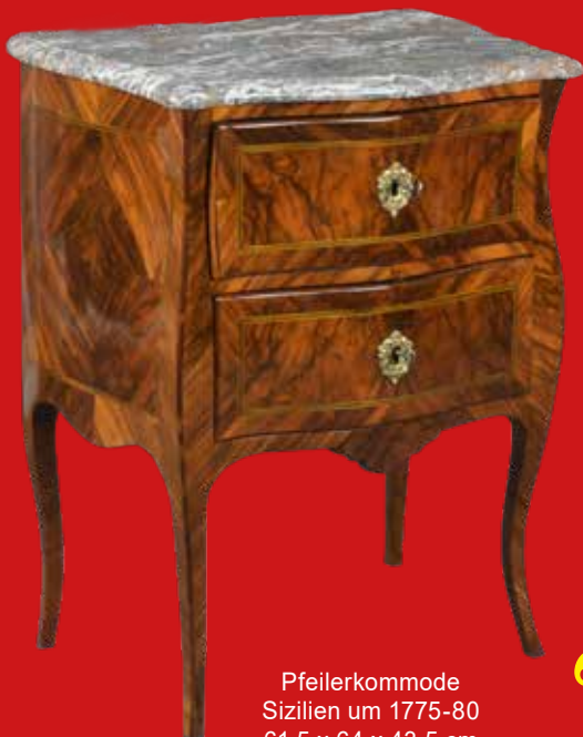
Pfeilerkommode Sizilien um 1775-80 61,5 x 64 x 43,5 cm