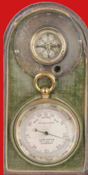
Kompass und Taschenbarometer England um 1920, Messing 12,3 x 6,5 x 3,2 cm