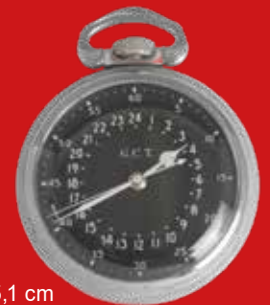
D=5,1 cm Navigationsuhr der U.S.-Airforce, Hamilton Watch Co. USA um 1942, vernickelt