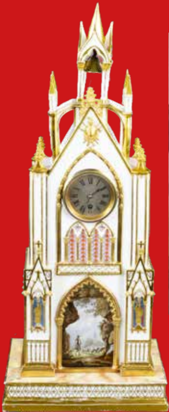
Bedeutende Prunktischuhr Paris, Dagoty et Honoré 1812-1820 H= 66,6 cm