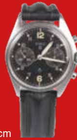
D=3,9 cm CWC, britische Militäruhr Schweiz um 1955, vernickelt