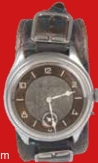
D=4,6 cm Longines Schweiz um 1903 Messing