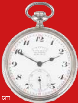
D=5,0 cm Eisenbahner-Taschenuhr Gostrest Totschmech Sowjetunion um 1930, Metall