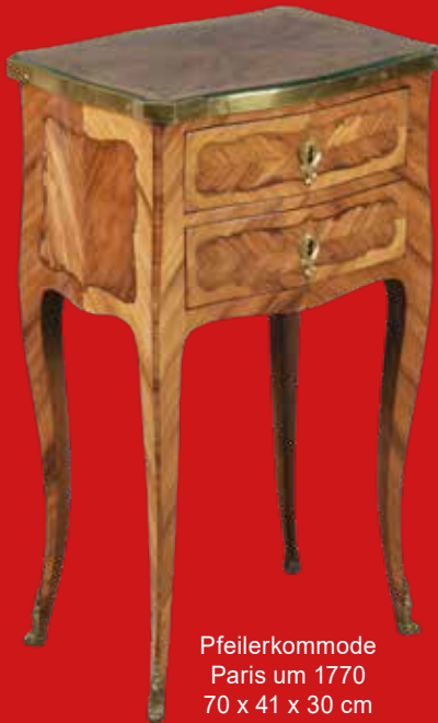
Pfeilerkommode Paris um 1770 70 x 41 x 30 cm