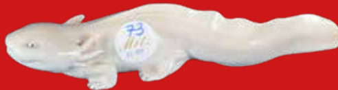
Royal Copenhagen um 1900 Entwurf Carl Liisberg L=24 cm