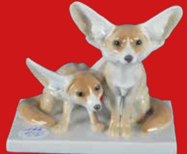
Meissen 1924-34 Entwurf von Otto Pilz H=14,9 cm