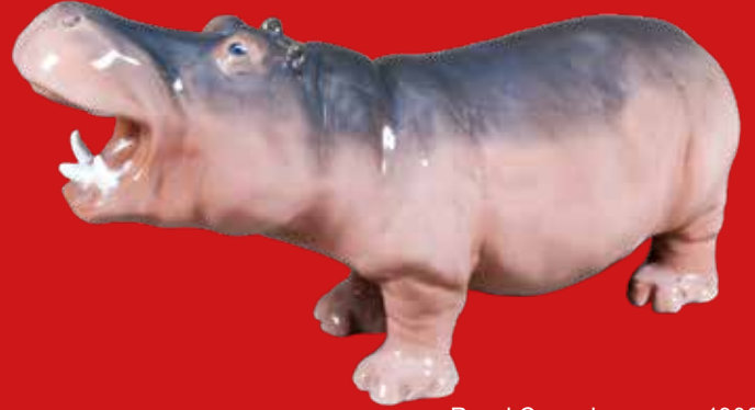
Royal Copenhagen um 1900 Entwurf von Prinzessin Marie von Dänemark H=17,9 cm