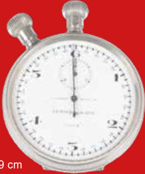
D=5,9 cm Militär-Stoppuhr F. L. Löbner, Berlin Schweiz um 1914, vernickelt