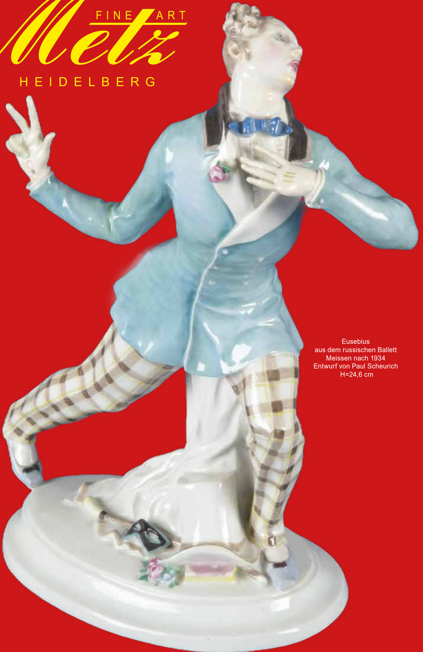
Eusebius aus dem russischen Ballett Meissen nach 1934 Entwurf von Paul Scheurich H=24,6 cm