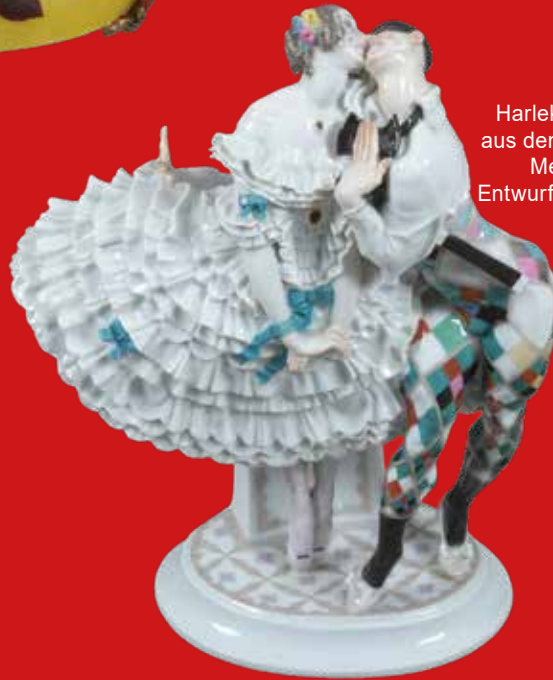
Harlekin und Columbine aus dem russischen Ballett Meissen 1914-23 Entwurf von Paul Scheurich H=30 cm