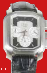
D=3,8 cm „Senator Karrée“ Glashütte 1999 Edelstahl