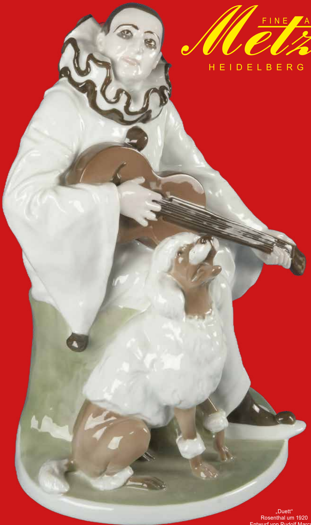
„Duett“ Rosenthal um 1920 Entwurf von Rudolf Marcuse H=34,9 cm