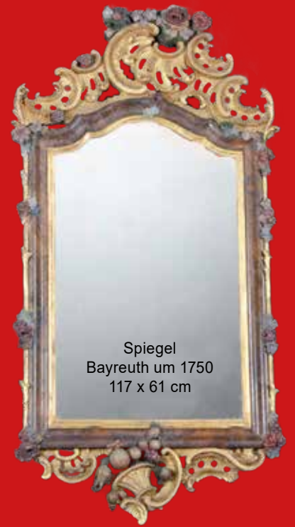
Spiegel Bayreuth um 1750 117 x 61 cm