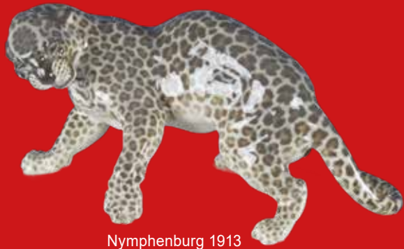
Nymphenburg 1913 Entwurf von Hans Behrens H=21,4 cm