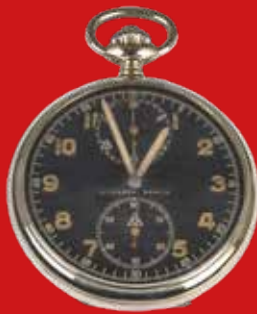
D=5,0 cm Dienstuhr fürs Reichsheer Deutschland/Schweiz um 1925 Stahl