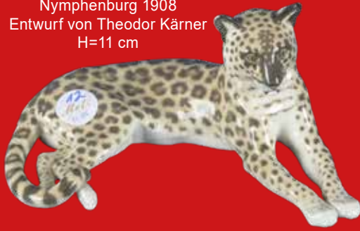
Nymphenburg 1908 Entwurf von Theodor Kärner H=11 cm