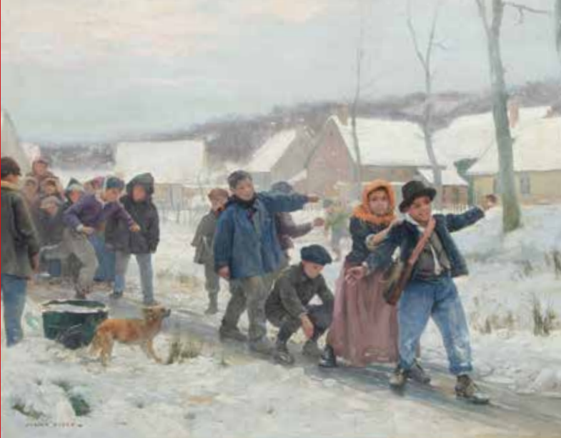
Julien Dupré (1851-1910), Öl/Lw., li./u./sign., gerahmt, 65 x 81 cm