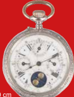
D=5,0 cm Taschenuhr mit Vollkalendarium und Mondphase Schweiz um 1900, Silber