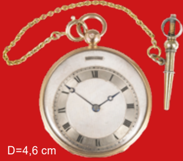
D=4,6 cm Taschenuhr, Charles Oudin Paris um 1810, Gold