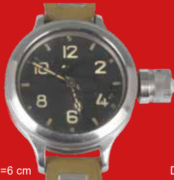
D=6 cm Zlatoust 191-ChS sowjetische Kampfschwimmeruhr UdSSR um 1970, Edelstahl