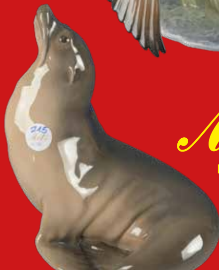
Royal Copenhagen um 1900 Entwurf von Theodor Madsen H=27,7 cm