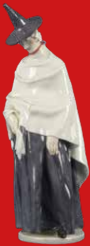
Nymphenburg Entw. R. Schröder-Lechner H=21 cm