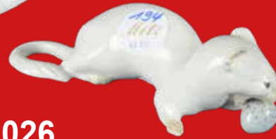
Royal Copenhagen um 1900 Entwurf von Prinzessin Marie von Dänemark H=17,9 cm