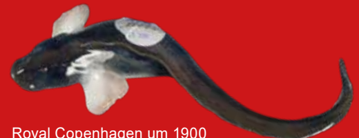
Royal Copenhagen um 1900 Entwurf Carl Liisberg L=20 cm