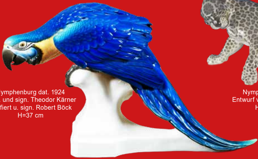
Nymphenburg dat. 1924 Entw. und sign. Theodor Kärner staffiert u. sign. Robert Böck H=37 cm