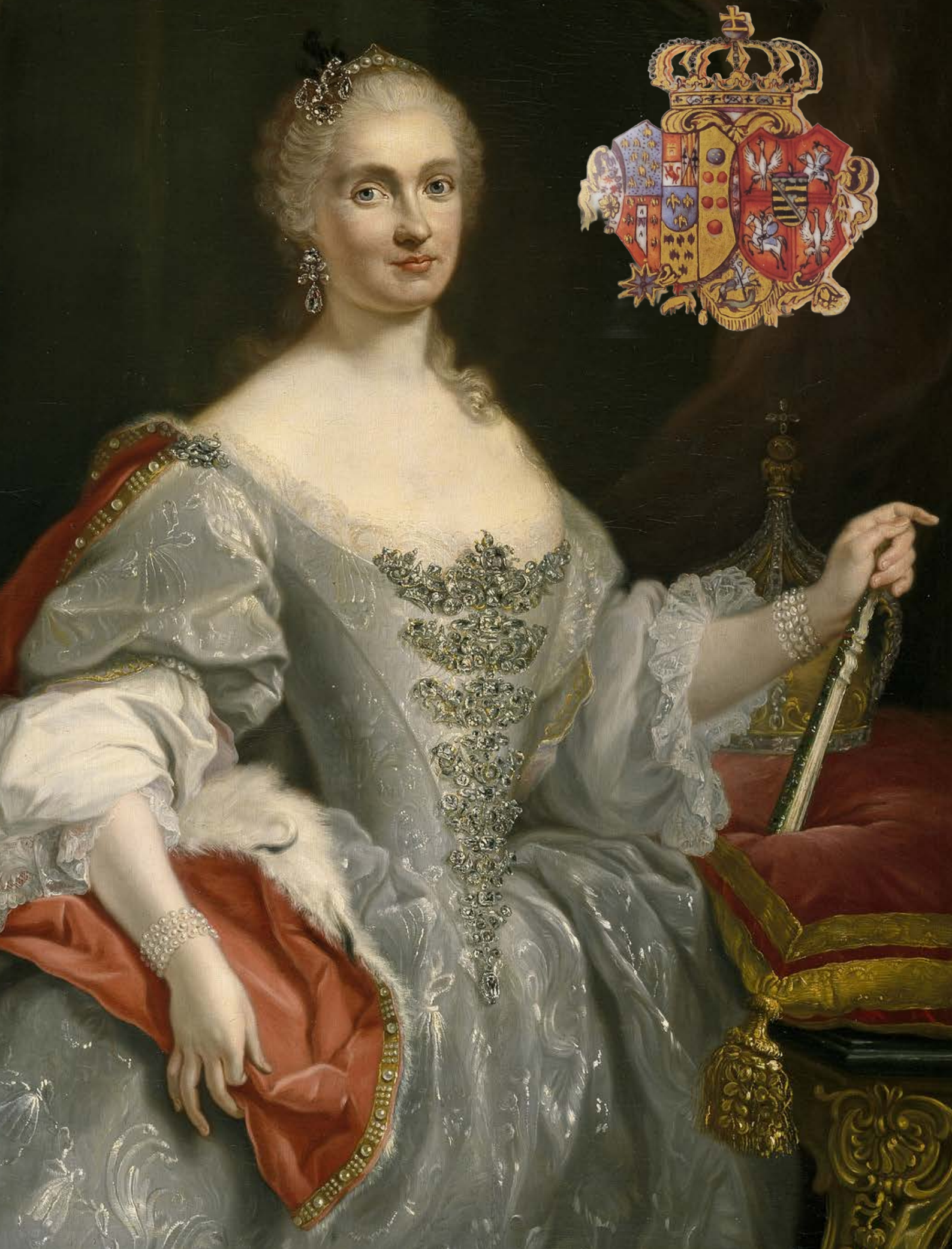
Königin Maria Amalia von Neapel-Sizilien und Spanien (1724-1760)