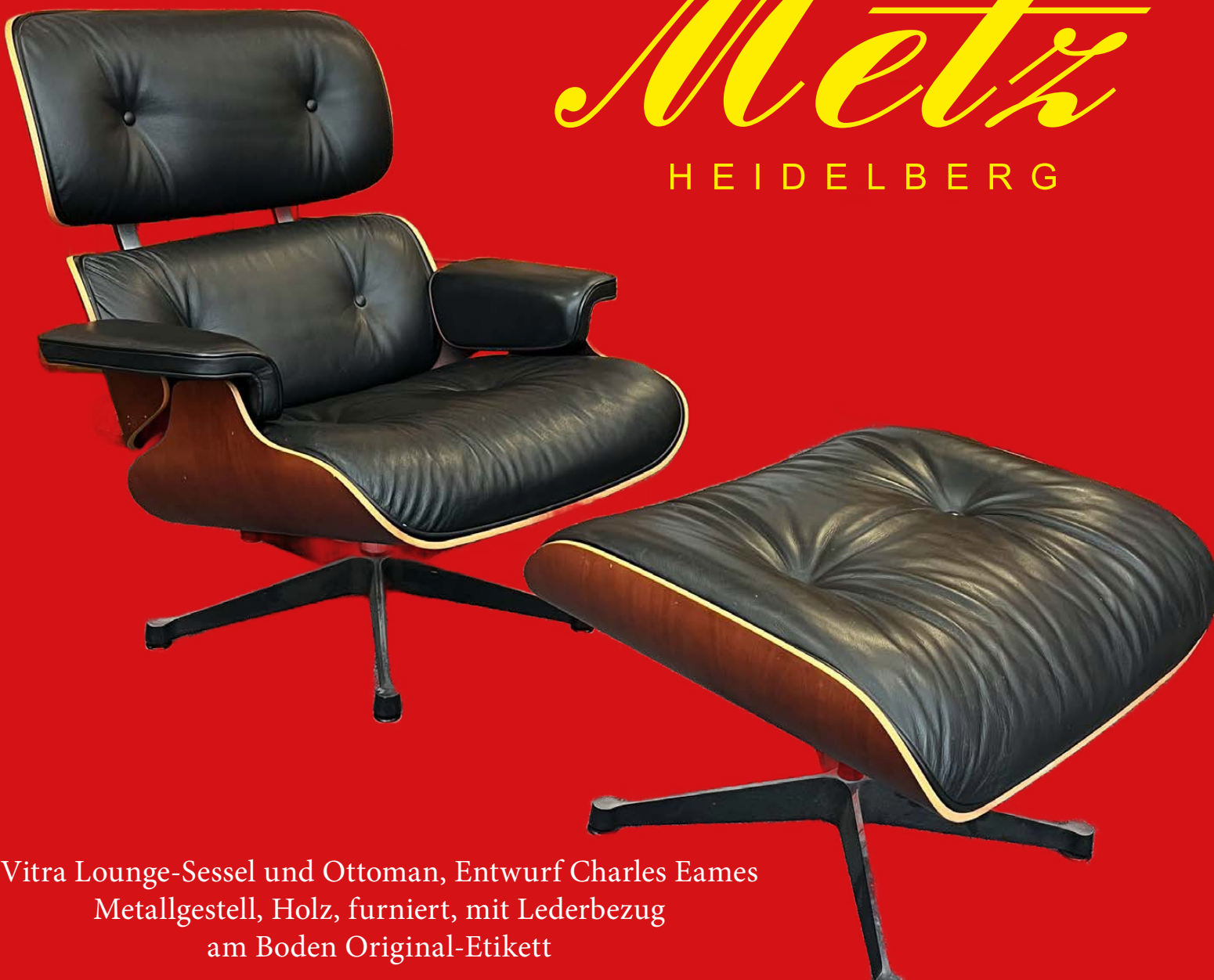
Vitra Lounge-Sessel und Ottoman, Entwurf Charles Eames Metallgestell, Holz, furniert, mit Lederbezug am Boden Original-Etikett