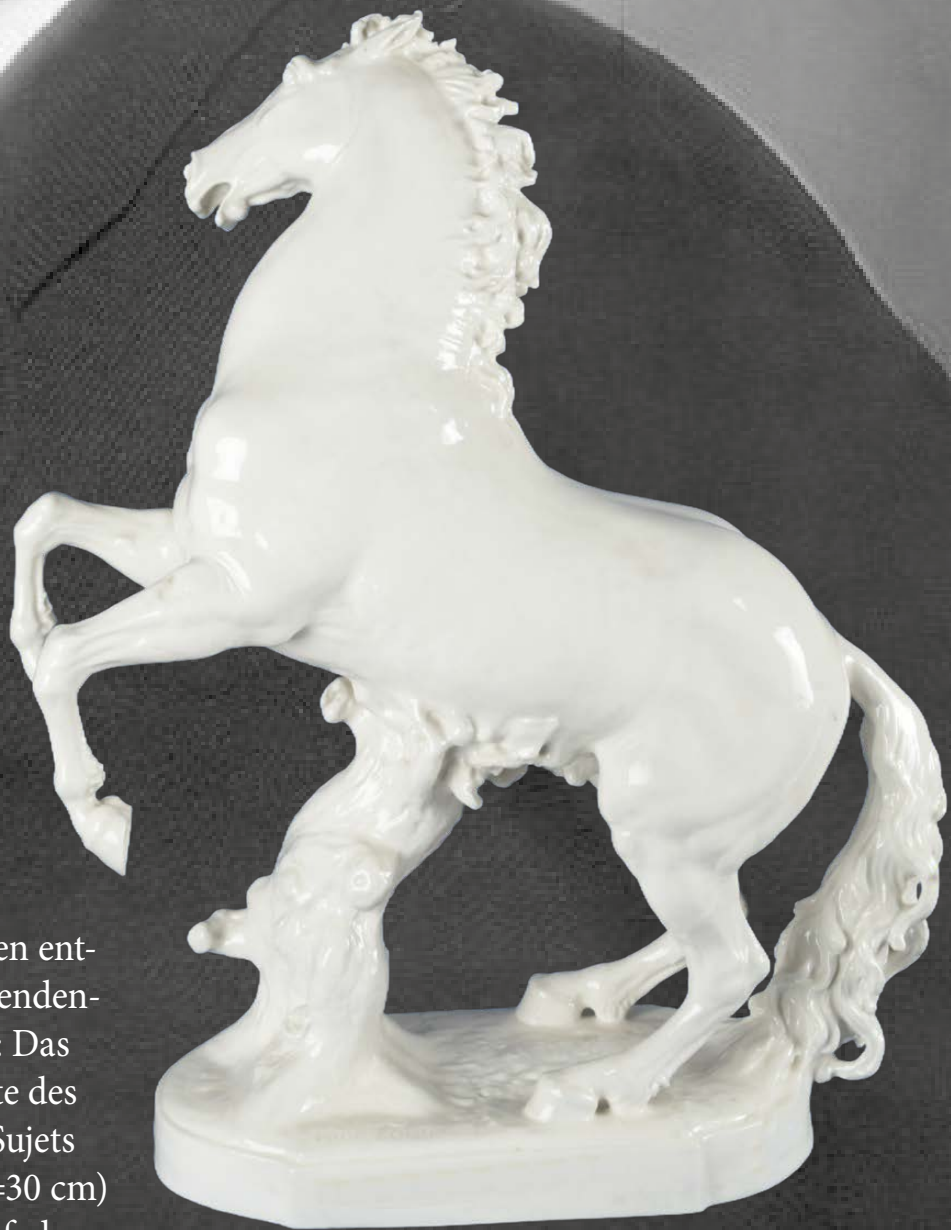
Sich aufbäumendes Pferd Hutschenreuther ab 1937 H=60,2 cm

Auch in der Manufaktur Meissen entstehen im frühen 20. Jh. neue Tendenzen in der Porzellanproduktion: Das Modell für die moderne Variante des traditionsreichen und schönen Sujets „Harlekin und Columbine“ (H=30 cm) aus dem russischen Ballett schuf der Meister Professor Paul Scheurich.