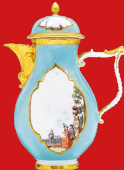
Meissen 1730-35 H=22,8 cm