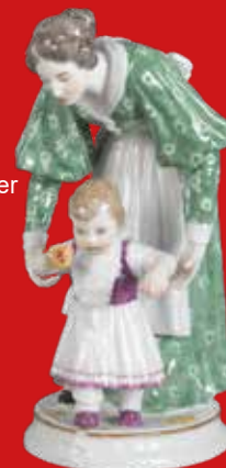
Meissen 1898 Modell von A. Schreitmüller H=17,2 cm