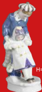
Meissen 1905 Modell von Alfred König H=14,8 cm