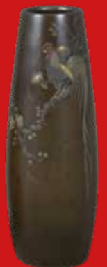
Paar Vasen, Japan, Meiji-Epoche 19. Jh. H=15,4 cm