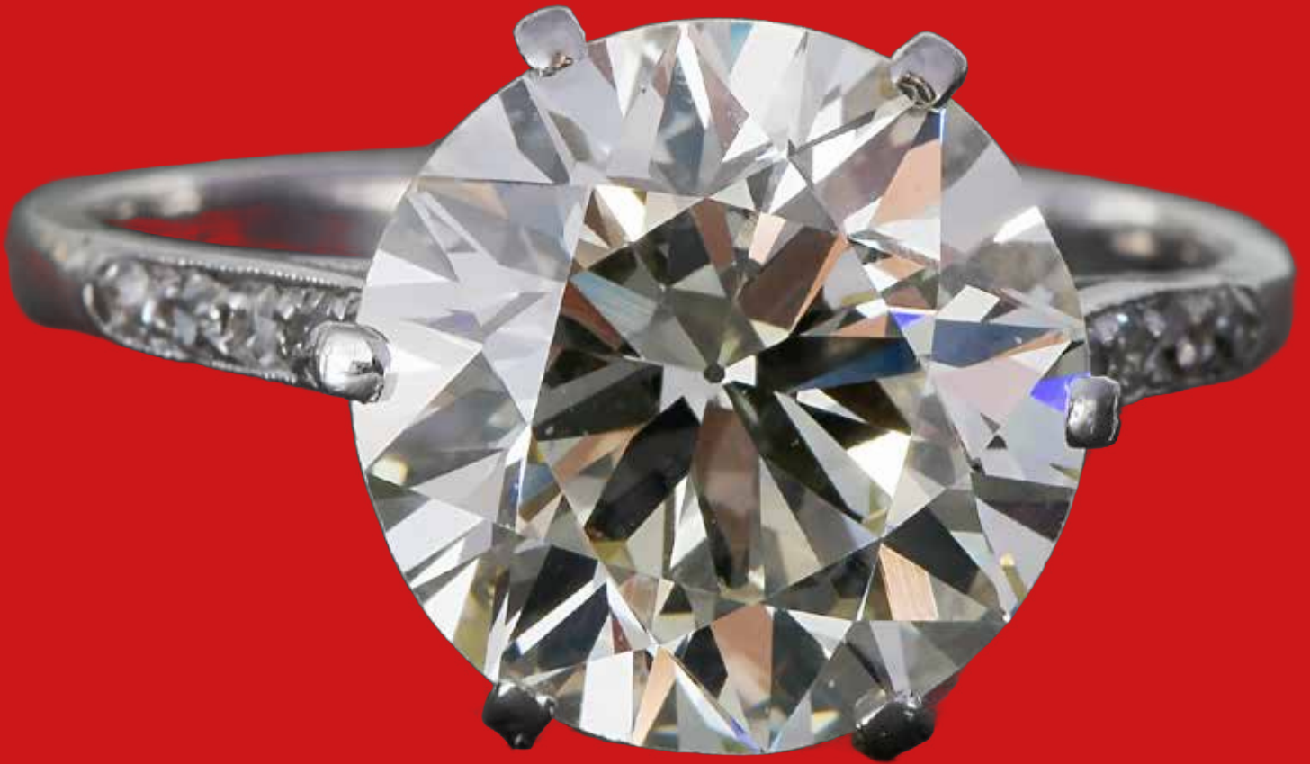
Solitärring 18kt Weißgold, besetzt mit Brillant, ca. 5,0 ct. Gesamtgewicht 3,85 g

Vorbesichtigung: Montag, 16., - Donnerstag, 19. März, 10:00-18:30 Uhr