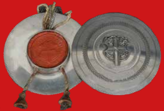
Siegelkapsel, Freiburg im Breisgau Meister Bernhard Reich (Meister seit 1830) 13-lötiges Silber H=1,8 cm, D=10,5 cm