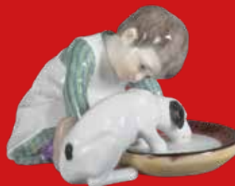
Meissen 1905 Modell von Konrad Hentschel H=8,6 cm