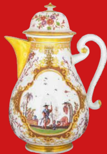
Meissen 1723-24 H=19,2 cm