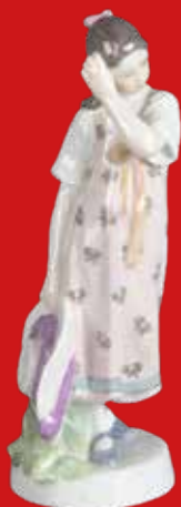
Meissen 1905-10 Modell von Alfred König H=20,1 cm