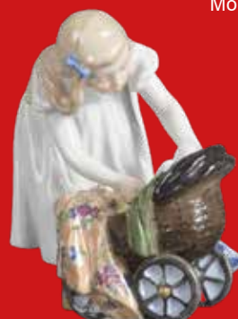
Meissen 1905 Modell von K. Hentschel H=12,8 cm