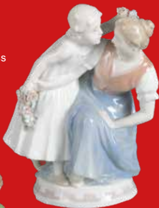
Meissen 1905 Modell von Theodor Eichler H=21 cm