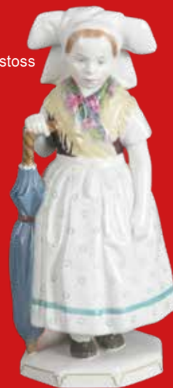
Berlin dat. 1908 Modell von Karl Himmelstoss H=26,6 cm