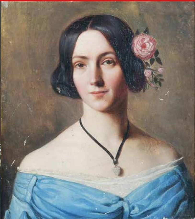
Herzogin Mathilde von Württemberg (1818-1891)

Theodor Ferdinand Hildebrandt (1804-1874)