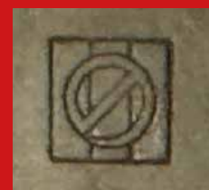
Bronze, sign. Nogawa, Kyoto