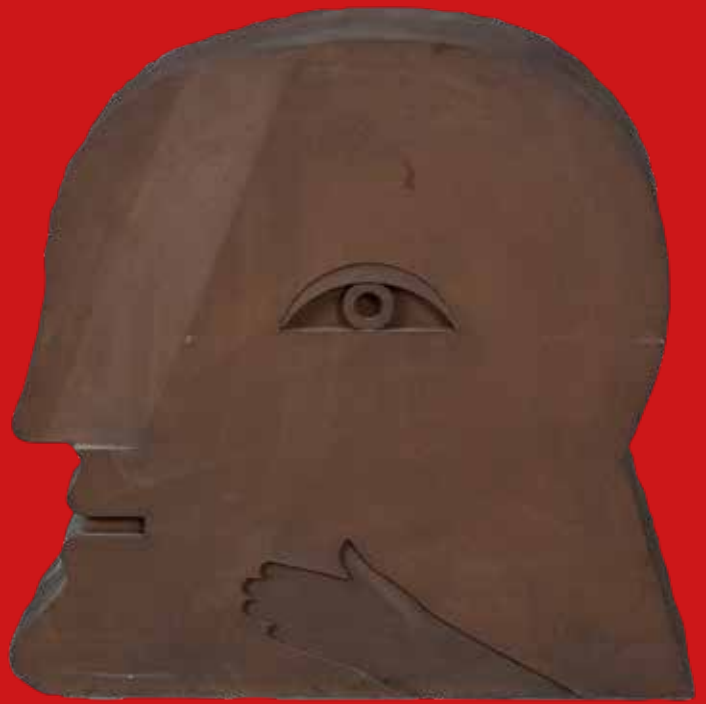
Horst Antes (1936), „Der Kopf“(1977), Stahl, graviert, mit „rust patina“ Edition Volker Huber, Offenbach, Ed. 665/1000 H=45 cm