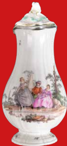
Meissen 1750 H=23,6 cm