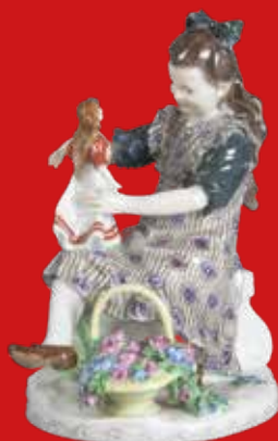
Meissen 1911-12 Modell von Alfred König H=15 cm