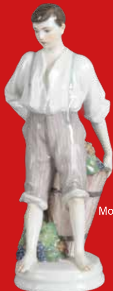
Meissen 1905-10 Modell von Theodor Eichler H=27,6 cm