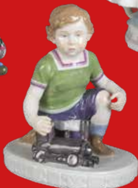
Meissen 1909 Modell von Emmerich Oehler H=15,3 cm