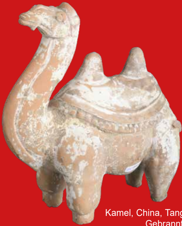
Kamel, China, Tang-Epoche 10. Jh. Gebrannter Ton H=27,5 cm