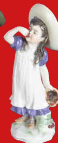
Meissen 1910 Modell von Paul Helmig H=17,4 cm