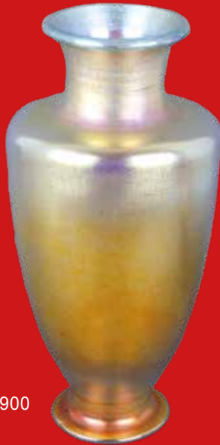
Jugendstil-Glasvase L. C. Tiffany, New York um 1900 H=43 cm