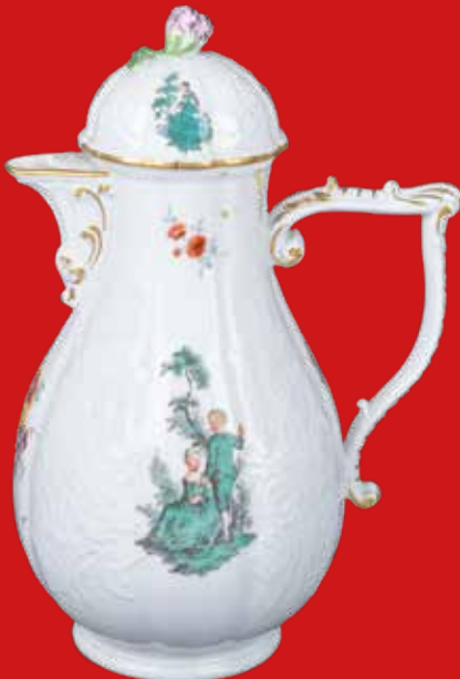
Meissen 1763-73 H=25,7 cm