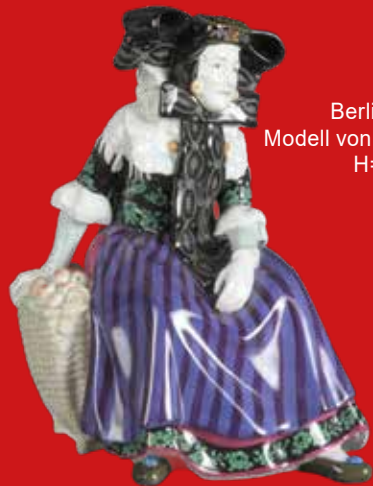
Berlin dat. 1914 Modell von Karl Himmelstoss H=25,2 cm