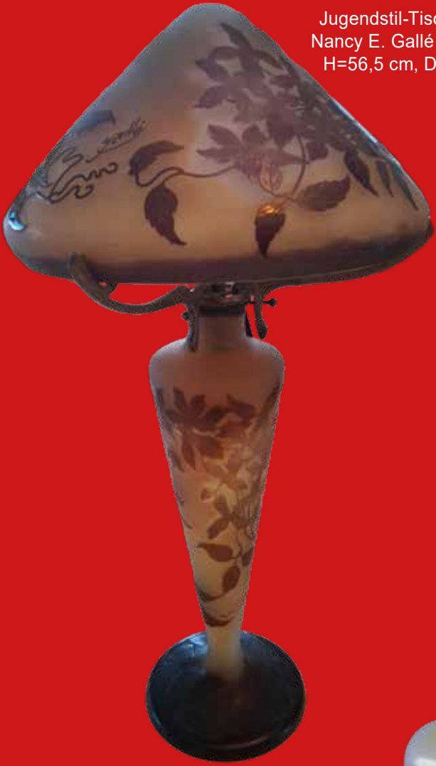
Jugendstil-Tischlampe Nancy E. Gallé um 1900 H=56,5 cm, D=29 cm