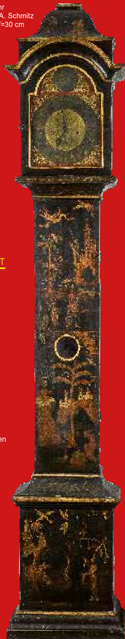
Höfische Standuhr Mannheim 1730-40, sign. A. Schmitz H=265 cm, B=50 cm, T=30 cm