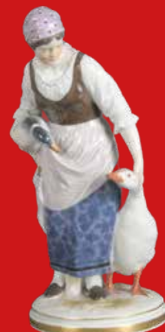
Meissen 1902 Modell von Jakob Ungerer H=23,6 cm