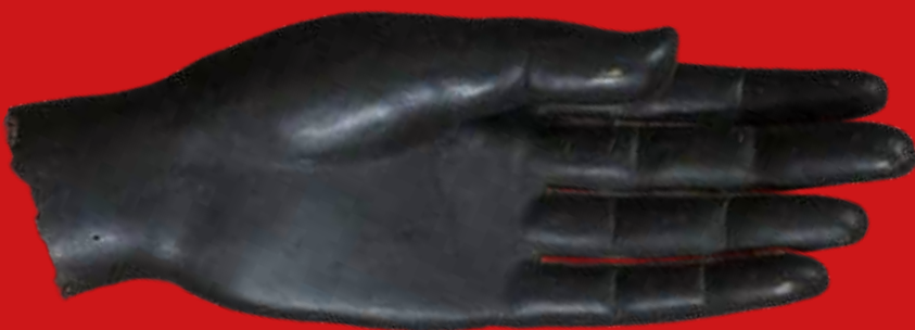
Linke Hand einer monumentalen Buddha-Statue Bronze, Thailand 17. Jh., L=41 cm, B=14 cm