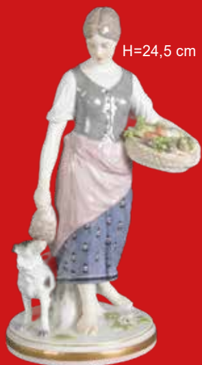
Meissen 1901-04 Modell von Jakob Ungerer