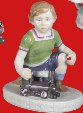
Meissen 1909 Modell von Emmerich Oehler H=15,3 cm