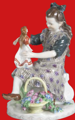
Meissen 1911-12 Modell von Alfred König H=15 cm