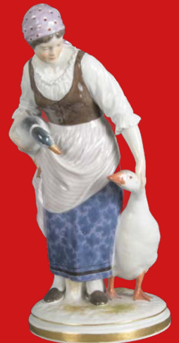
Meissen 1902 Modell von Jakob Ungerer H=23,6 cm