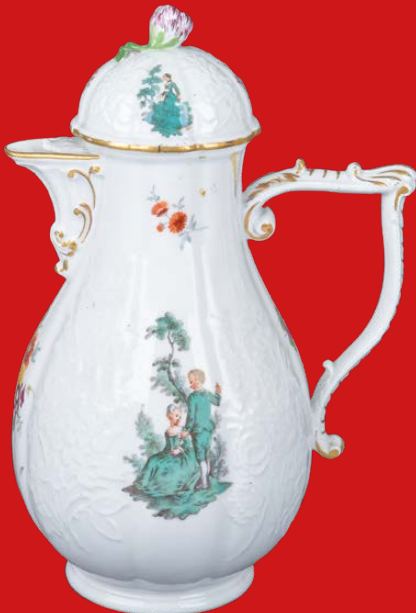
Meissen 1763-73 H=25,7 cm