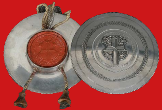
Siegelkapsel, Freiburg im Breisgau Meister Bernhard Reich (Meister seit 1830) 13-lötiges Silber H=1,8 cm, D=10,5 cm