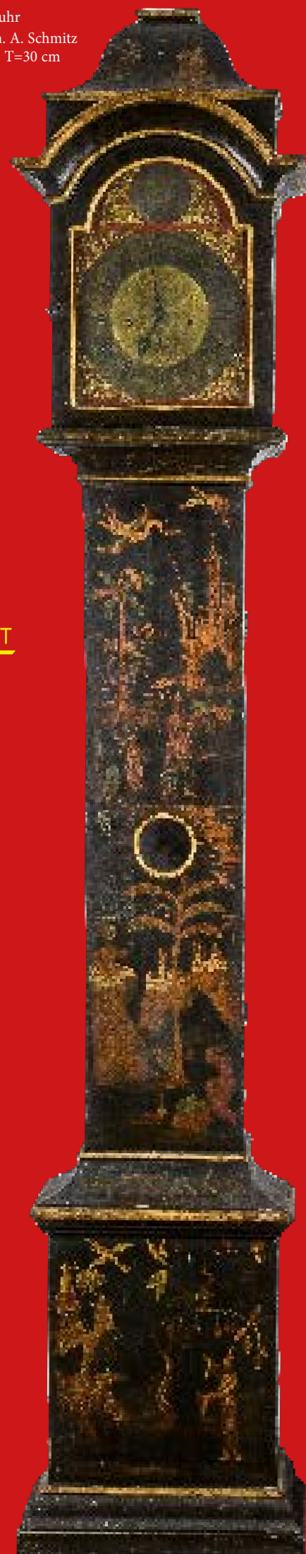
Höfische Standuhr Mannheim 1730-40, sign. A. Schmitz H=265 cm, B=50 cm, T=30 cm