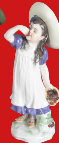
Meissen 1910 Modell von Paul Helmig H=17,4 cm