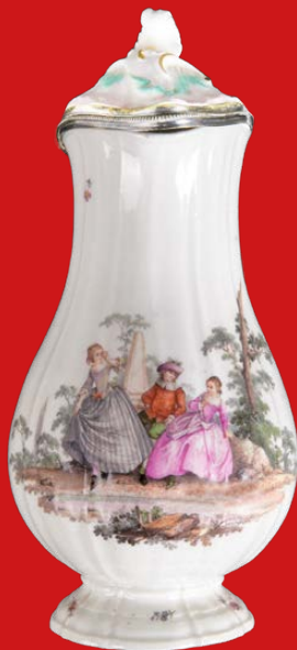
Meissen 1750 H=23,6 cm