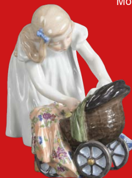
Meissen 1905 Modell von K. Hentschel H=12,8 cm