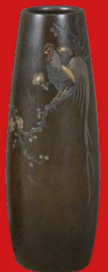
Paar Vasen, Japan, Meiji-Epoche 19. Jh. H=15,4 cm