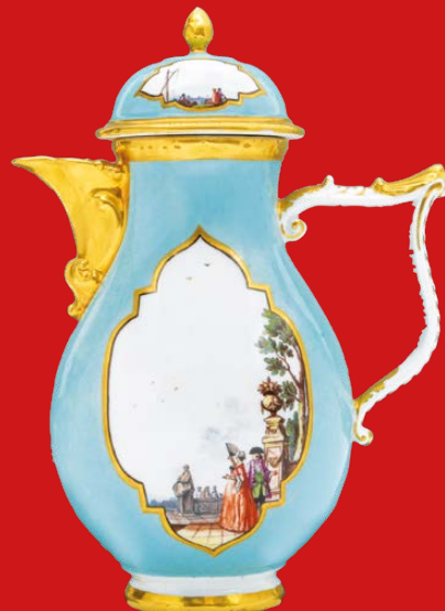
Meissen 1730-35 H=22,8 cm