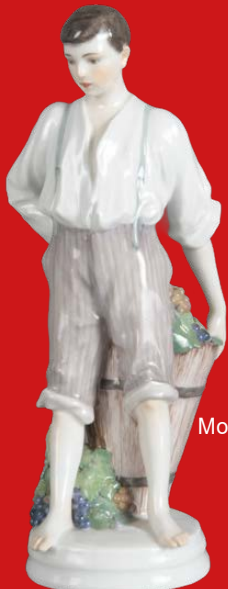
Meissen 1905-10 Modell von Theodor Eichler H=27,6 cm