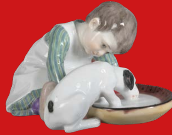
Meissen 1905 Modell von Konrad Hentschel H=8,6 cm