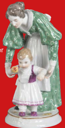
Meissen 1898 Modell von A. Schreitmüller H=17,2 cm