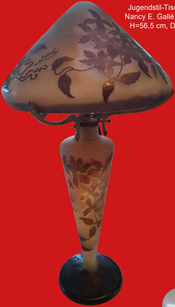
Jugendstil-Tischlampe Nancy E. Gallé um 1900 H=56,5 cm, D=29 cm