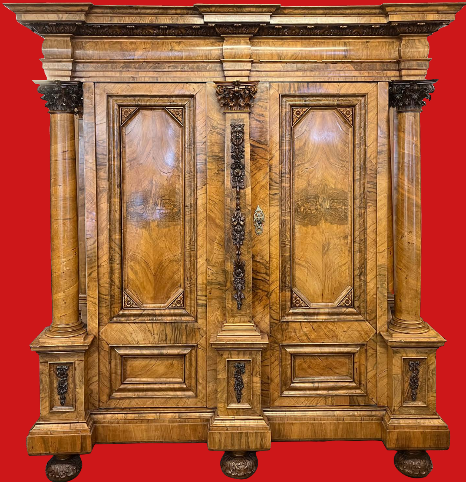
Bedeutender Prunkschrank, Mainz 1712, Meister Johann Matthias Staudinger Nussbaumwurzel querfurniert, teilweise massiv Nussbaum geschnitzt H=238,5 cm, B=228 cm, T=78,5 cm