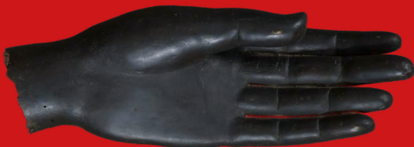
Linke Hand einer monumentalen Buddha-Statue Bronze, Thailand 17. Jh., L=41 cm, B=14 cm