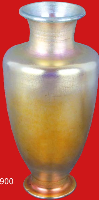
Jugendstil-Glasvase L. C. Tiffany, New York um 1900 H=43 cm