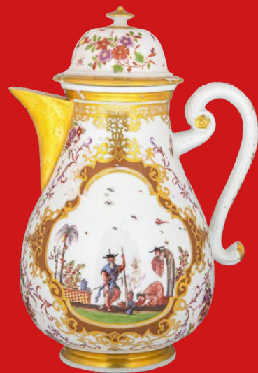
Meissen 1723-24 H=19,2 cm