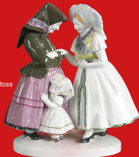
Berlin dat. 1914 Modell von Karl Himmelstoss H=23,4 cm