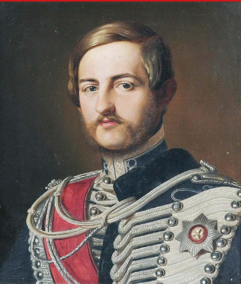
Herzog Eugen von Württemberg (1820-1875)

DEUTSCHES KREBSFORSCHUNGSZENTRUM IN DER HELMHOLTZ-GEMEINSCHAFT