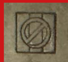
Bronze, sign. Nogawa, Kyoto