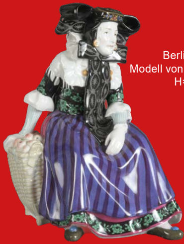
Berlin dat. 1914 Modell von Karl Himmelstoss H=25,2 cm