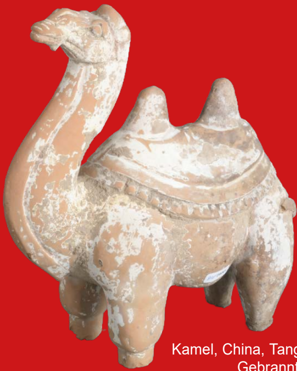
Kamel, China, Tang-Epoche 10. Jh. Gebrannter Ton H=27,5 cm