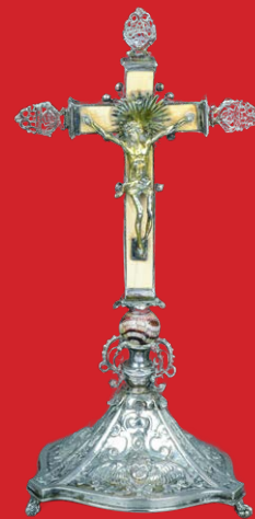
Kruzifix Nürnberg, Meister Paulus Bair 1613 H=27,5 cm