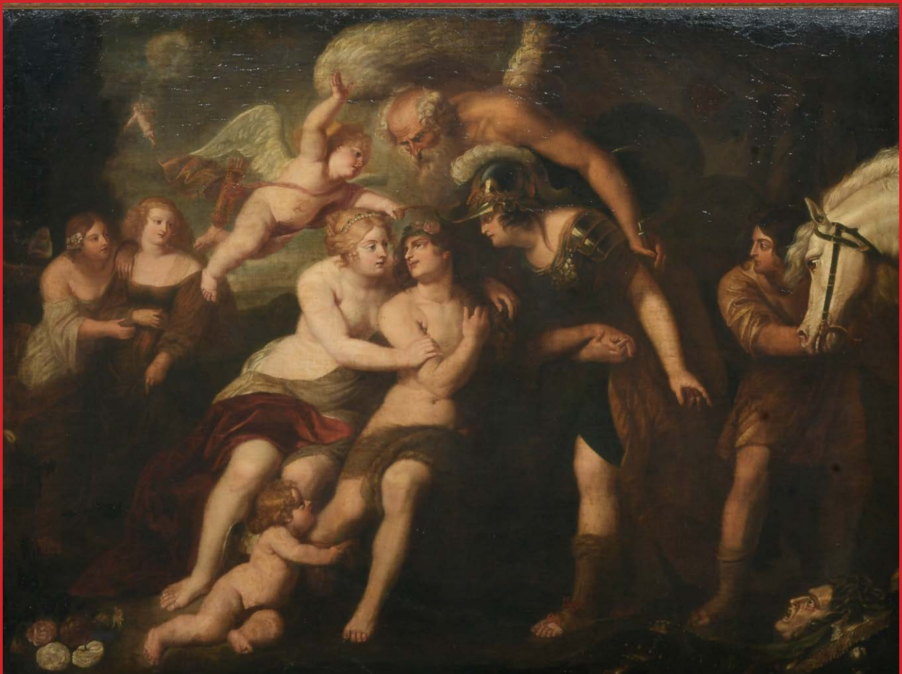
Maler des 17./18. Jhs., Herakles am Scheideweg, Öl/Lw., gerahmt, 138 x 179 cm