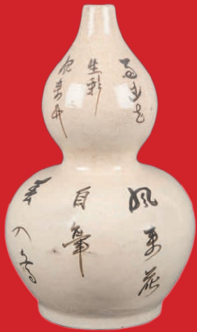
Doppelkürbisvase im Cizhou-Stil Japan, Edo-Periode (1603-1868) H=32,5 cm