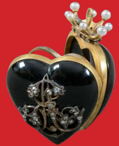
Herzanhänger, deutsch 19. Jh. Gelbgoldrahmen mit blauem Email H=4,6 cm, B=3,2 cm, T=2 cm