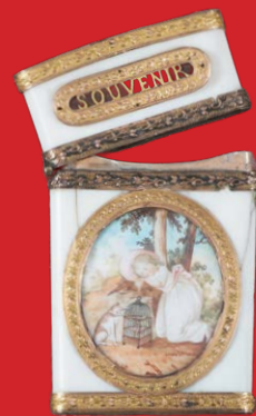
Carnet-de-Bal Paris 1780 8,3 x 5,2 cm