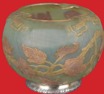
Jugendstil-Vase Nancy, Daum Frères um 1900 H=16 cm