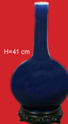
Feine Flaschenvase China, Kangxi frühes 18. Jh. H=41 cm