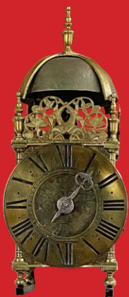
Laternenuhr T. Wheeler, London 17. Jh. 38,5 x 14 x 14,5 cm