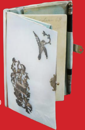
Damengeldbörse Frankreich um 1900 Poliertes Perlmutter 10,5 x 7 cm