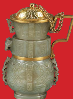
Jadegefäß, China, Ming-Dynastie (1368-1644) H=15,5 cm.