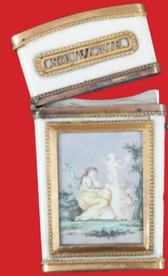
Carnet-de-Bal Paris 19. Jh. 9 x 5,1 cm