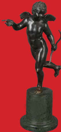
Amor Italien 17./18. Jh. Bronze, H=40 cm