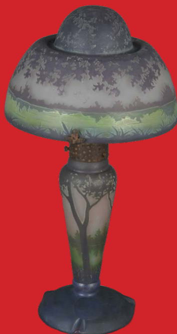
Jugendstil-Tischlampe Nancy, Daum Frères um 1900 H=38 cm, D=19 cm