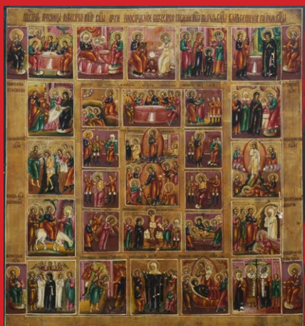
Mehrfelderikone, Russland 19. Jh., Öl/Holz 53 x 45 cm