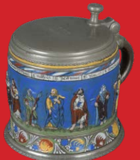
Apostelkrug Creussen um 1700 H=15 cm