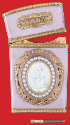
Carnet-de-Bal Paris 1780 8,4 x 4,9 cm