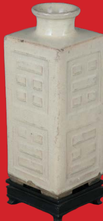
Laternen-Vase Späte Ming/Tsin Epoche H=23,7 cm