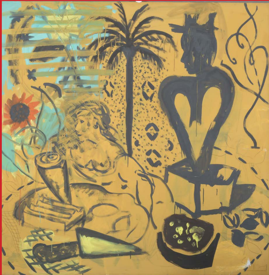
Stefan Szczesny (geb. 1951), Acryl/Lw., verso signiert und datiert 1985 152 x 152 cm

Katalog abrufbar ab 24. Nov. 2025 metz-auktion.de