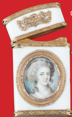
Carnet-de-Bal Paris 1780 8,8 x 5 cm