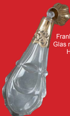
Flakon Frankreich 19. Jh. Glas mit Goldmontur H=11,9 cm