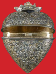
Herzdosenanhänger, Augsburg 17. Jh. Silber, reich ziseliert und vergoldet H=5,1 cm, B=4 cm, T=2 cm