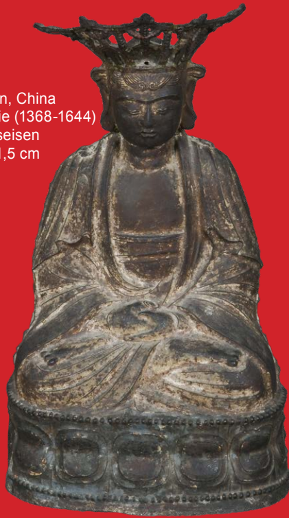
Guanyin, China Ming-Dynastie (1368-1644) Gusseisen H=51,5 cm