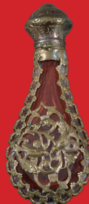
Flakon, deutsch 18. Jh. Rubinglas, Silber, vergoldet H=9 cm