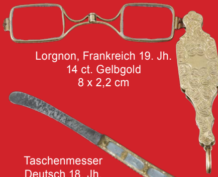
Lorgnon, Frankreich 19. Jh. 14 ct. Gelbgold 8 x 2,2 cm