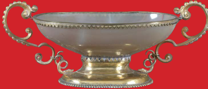
Ovale Schale, deutsch 17. Jh. Achat, poliert, Kupfermontur H=8,5 cm, B=20,7 cm, T=9,6 cm