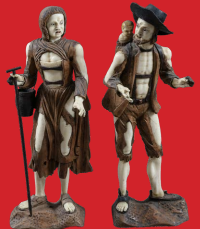
Simon Troger (1693-1768) Holz/Elfenbein, je H=28,5 cm