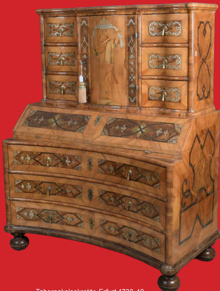
Tabernakelsekretär, Erfurt 1730-40 Nussbaum furniert, mit Bandelwerk und Zinneinlagen H=155 cm, B=121 cm, T=62 cm