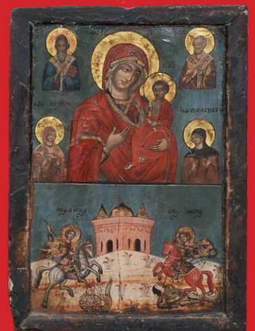
Ikone, Russland 19. Jh., Öl/Holz 52 x 37,5 cm