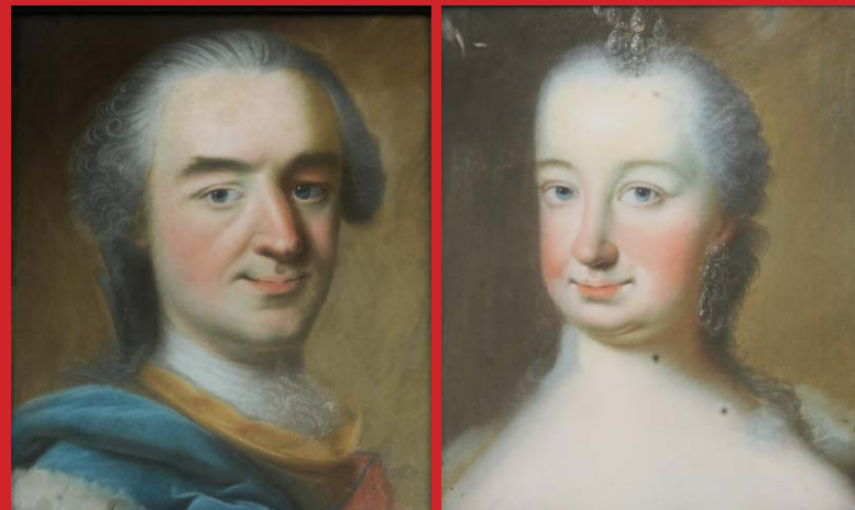
Kurpfälzer Maler des 18. Jhs., Kurfürstin Elisabeth Auguste und Kurfürst Carl Theodor von der Pfalz, Pastelle je 38 x 32 cm

Katalog abrufbar ab 24. Nov. metz-auktion.de