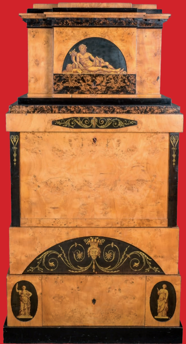
Biedermeier-Sekretär, Weimar 1815 Vogelaugenahorn furniert, teilw. ebonisiert H=188 cm, B=94 cm, T=49,5 cm