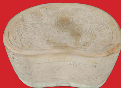
Nacktenstütze, China Jin-Dynastie 12./13. Jh. Cizhou-Keramik H=9,5 cm, B=21,5 cm, T=15 cm