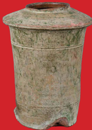
Urnengefäß, China Han-Zeit 1. Jh. n. Chr. Ton, mit Silikatglasur H=24,5 cm