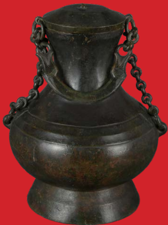
Deckelgefäß, Asien, Bronze H=30,5 cm