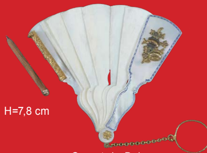
Carnet-de-Bal Frankreich 19. Jh. Schildpatt