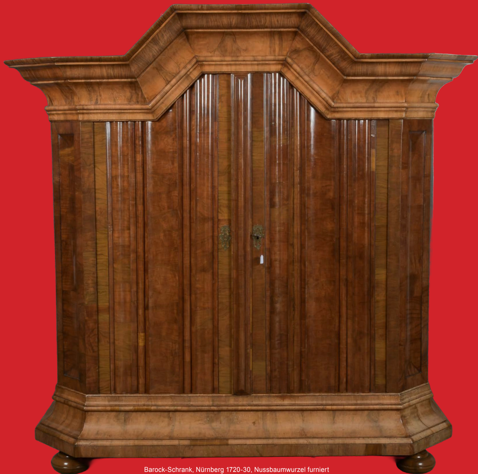
Barock-Schrank, Nürnberg 1720-30, Nussbaumwurzeln furniert H=210 cm, B=220 cm, T=83 cm