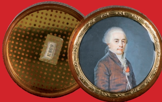
Runde Deckeldose, Paris um 1765 Schildpatt/Elfenbein D=5,7 cm / H=2,2 cm, D=6,7 cm