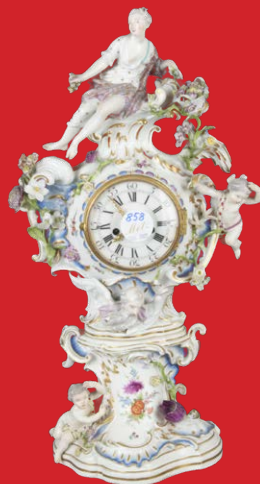
Tischuhr, Meissen 1763-73 Modell von Johann Joachim Kaendler H=44 cm