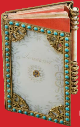
Taschenkalender Paris um 1900 Poliertes Perlmutter 8,3 x 5,7 cm