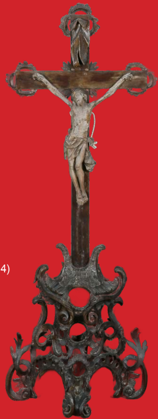
Kruzifix, Franken 1750 Lindenholz, geschnitzt H=117 cm, B=42 cm, T=21 cm