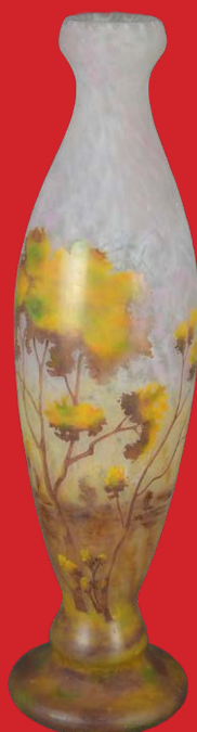
Jugendstil-Vase Nancy, Daum Frères um 1900 H=54 cm