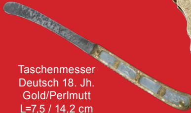
Taschenmesser Deutsch 18. Jh. Gold/Perlmutter L=7,5 / 14,2 cm