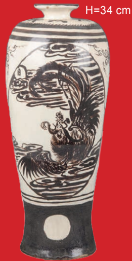
Cizhou-Vase China, Ming-Dynastie (1368-1644) H=34 cm