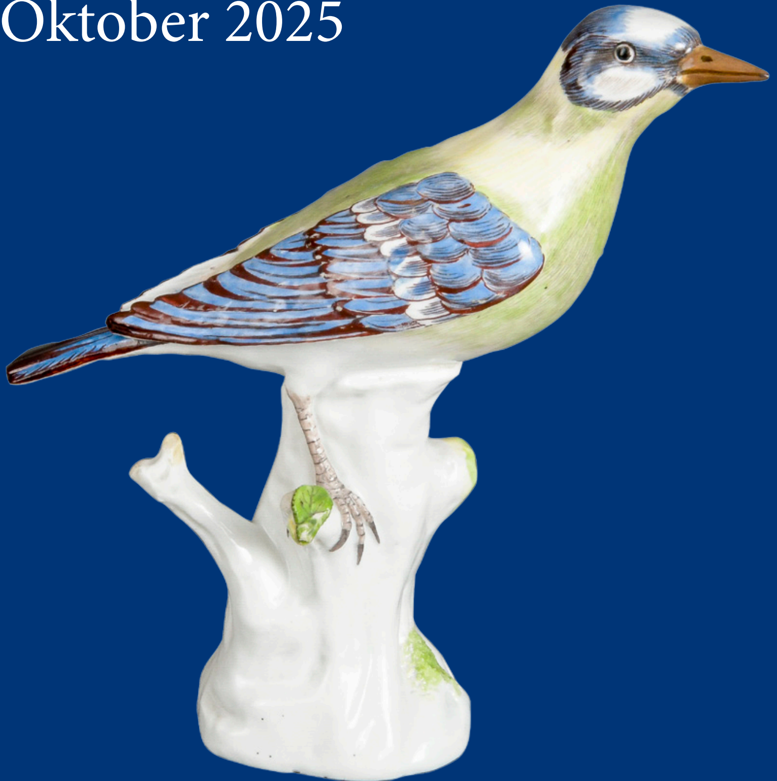
Grünspecht Meissen 1734 Modell von J.J. Kaendler H=20,8 cm