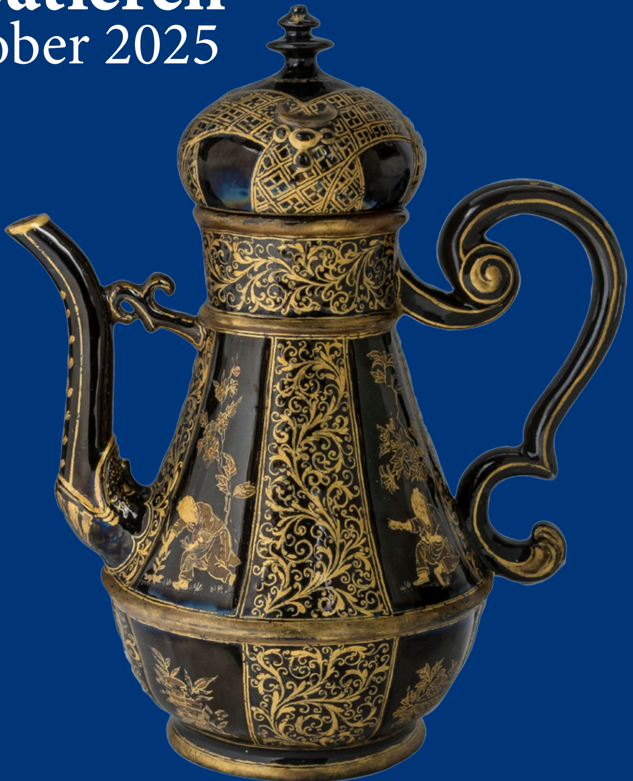
Böttgersteinzeug-Kanne „Türkische Form“ Meissen 1710, Schwarz glasiert, mit Goldmalerei von Martin Schnell H=20,1 cm