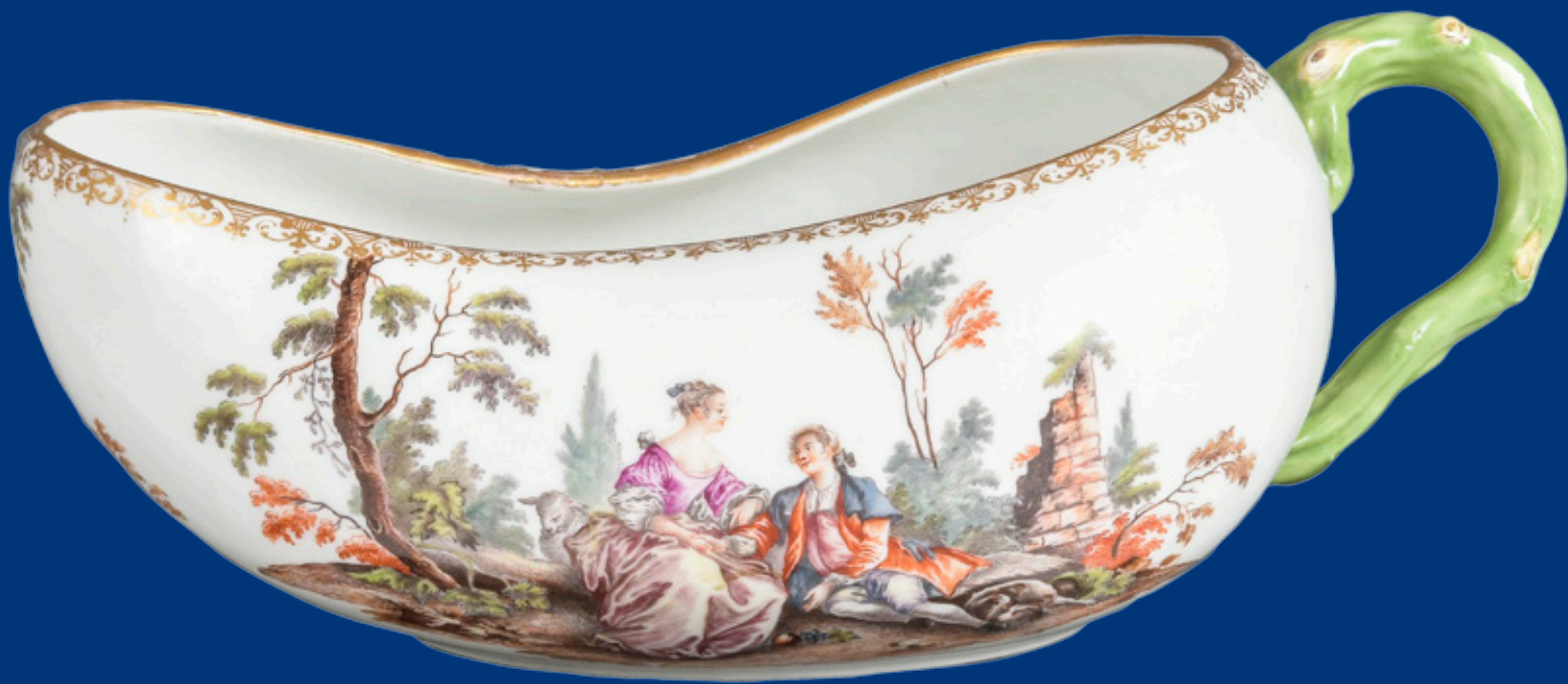
Bordalou Meissen 1760 9,5 x 24 x 11,8 cm