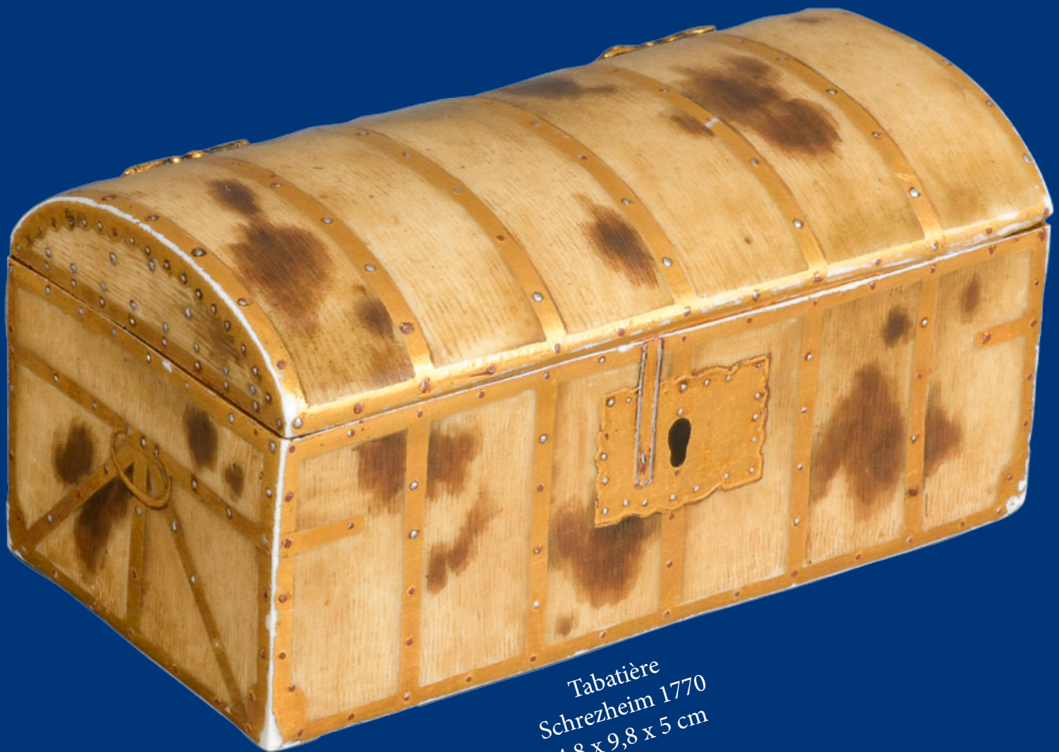
Tabatière Schrezheim 1770 4,8 x 9,8 x 5 cm