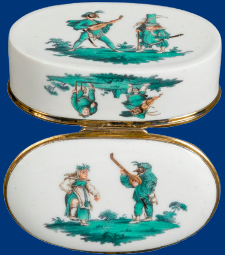
Tabatière Meissen 1750 3,7 x 9,8 x 6,2 cm