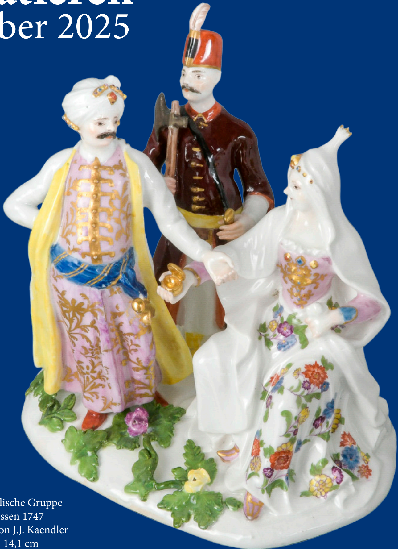
Orientalische Gruppe Meissen 1747 Modell von J.J. Kaendler H=14,1 cm