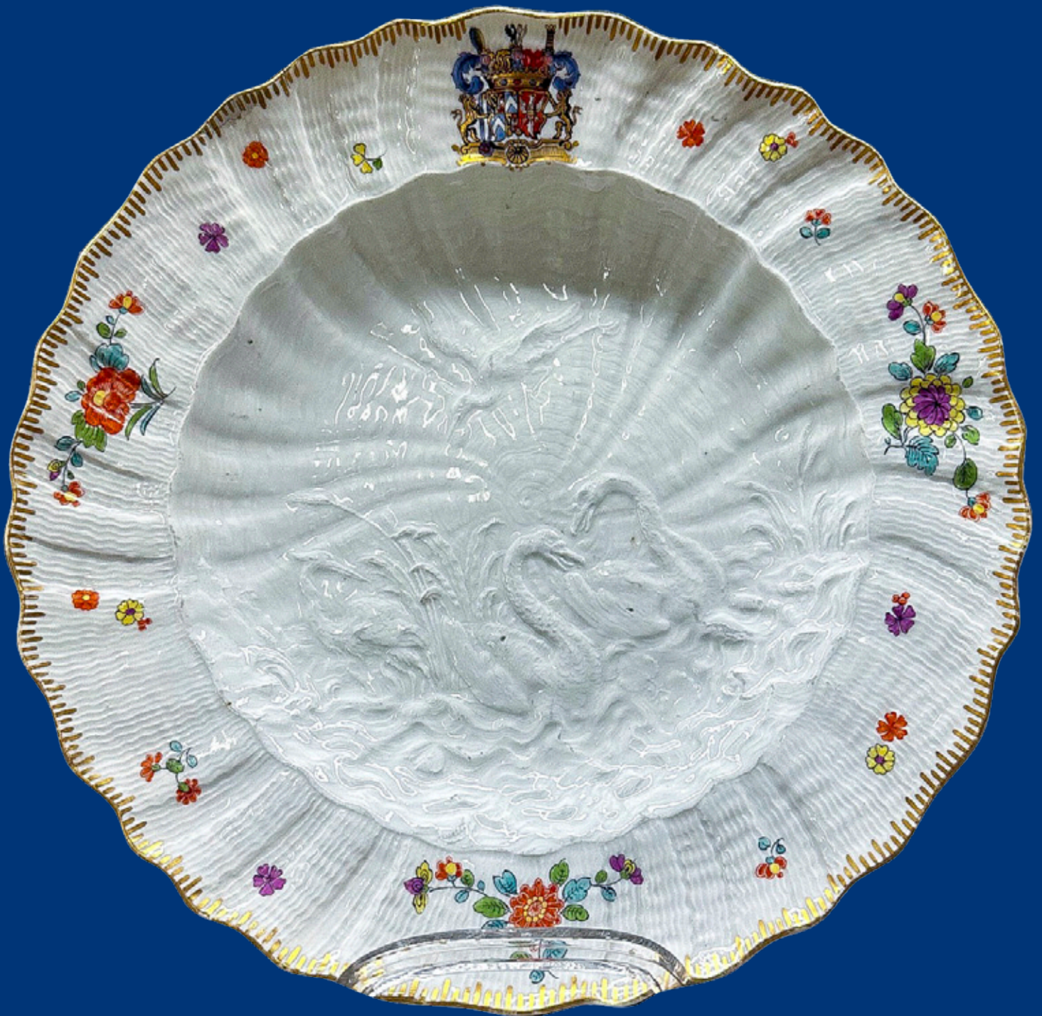
Teller aus dem Schwanenservice Meissen 1738 D=24 cm