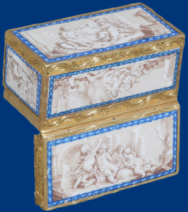
Goldtabatière mit Emaillie, Berlin 1763-73 Malerei von Christian Loehnig H=4,1 cm, B=7,7 cm, T=3,9 cm