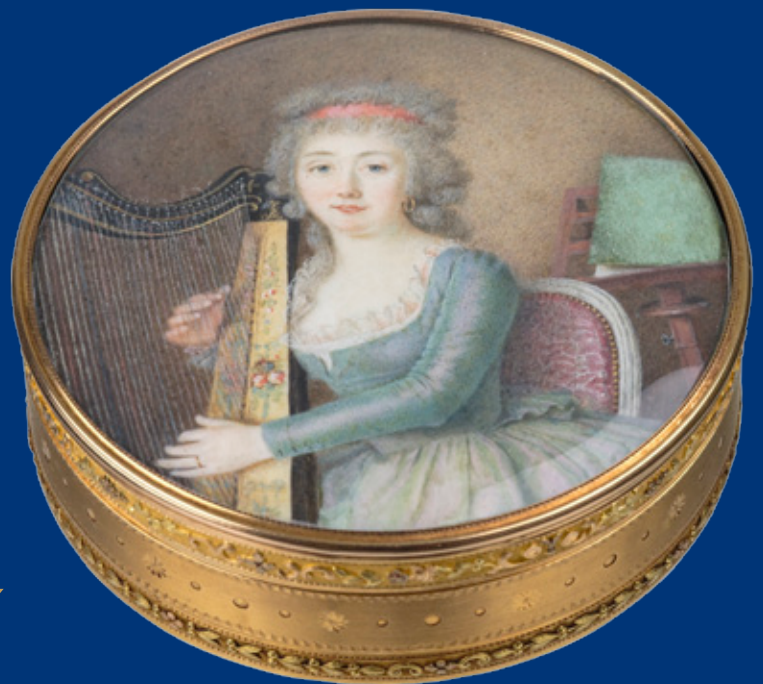
Tabatière Gelbgold (137 g) Frankreich um 1790 2,5 x 8 cm