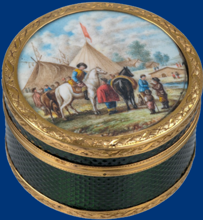
Tabatière mit Landschaftsminiatur Paris um 1770 3,5 x 6 cm