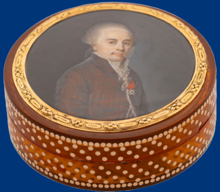
Tabatière Horn mit Goldpiqué Frankreich um 1765 2,2 x 5.2 cm