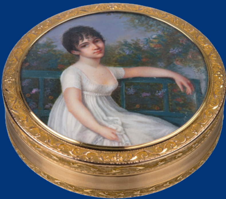
Tabatière Gelbgold (183 g) Frankreich um 1800 2,3 x 8,5 cm