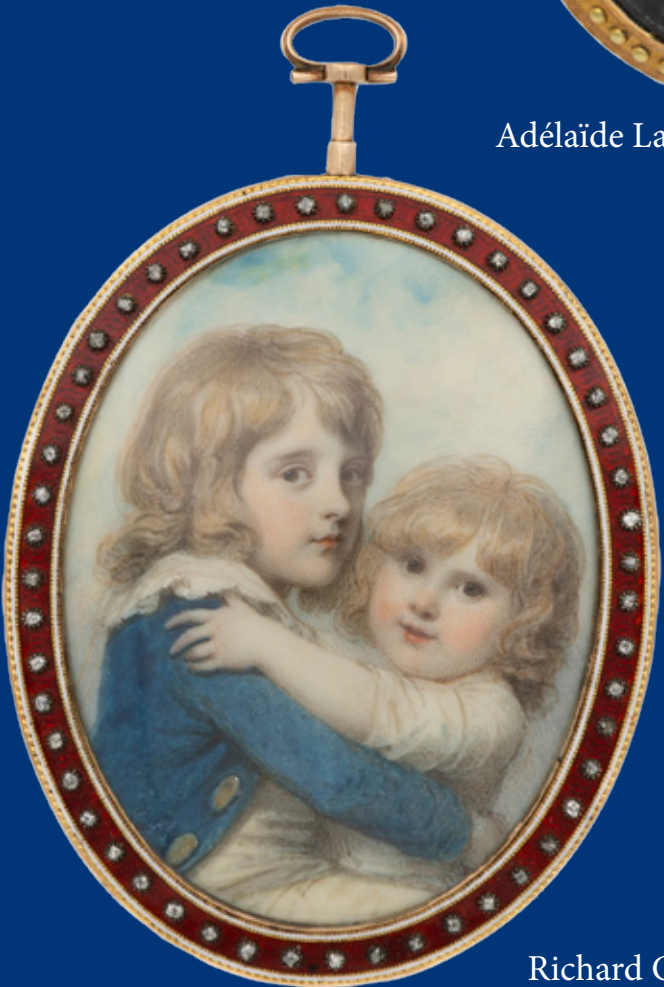
7,8 x 6,5 cm