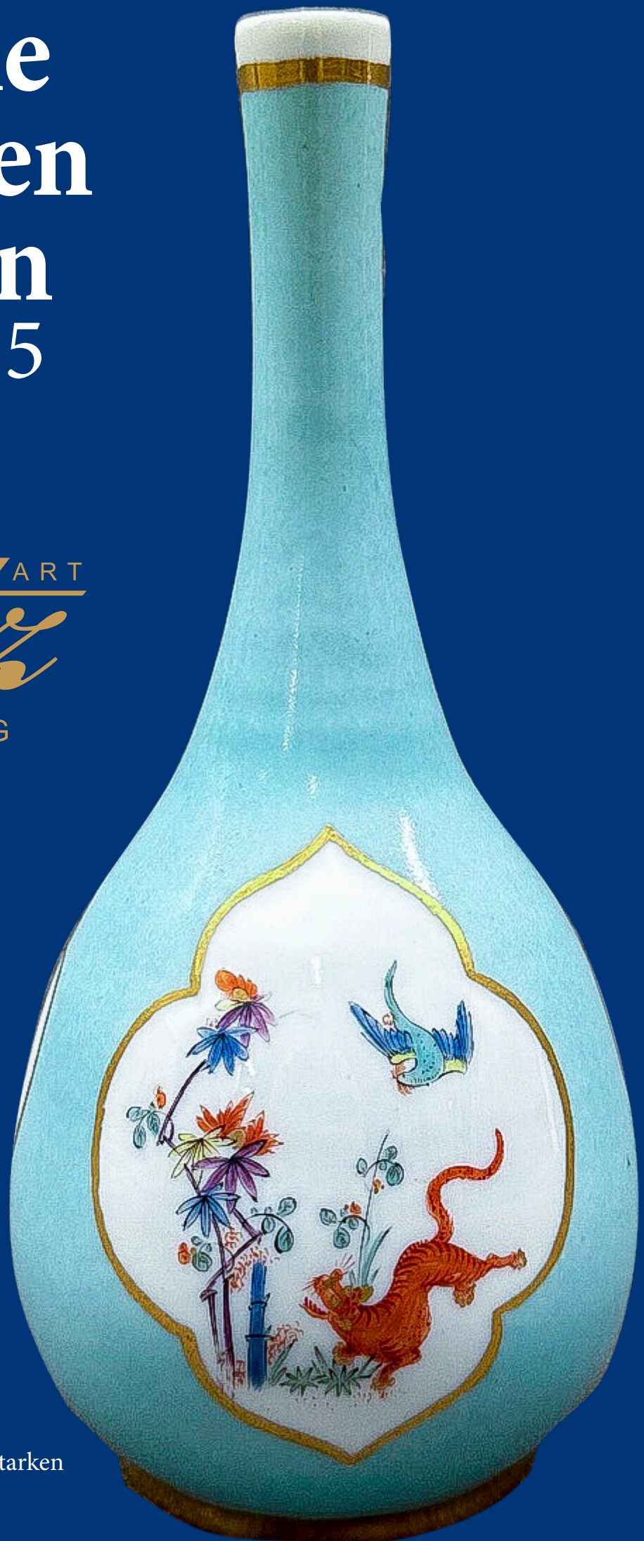
Sakeflasche aus dem Besitz August des Starken Meissen 1730 H=20,3 cm