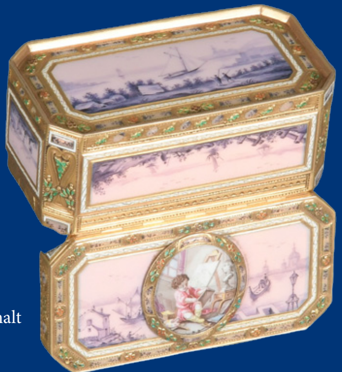
Goldtabatière mit Emaillefarben bemalt Paris 1775 H=3,1 cm, B=6,8 cm, T=3,5 cm