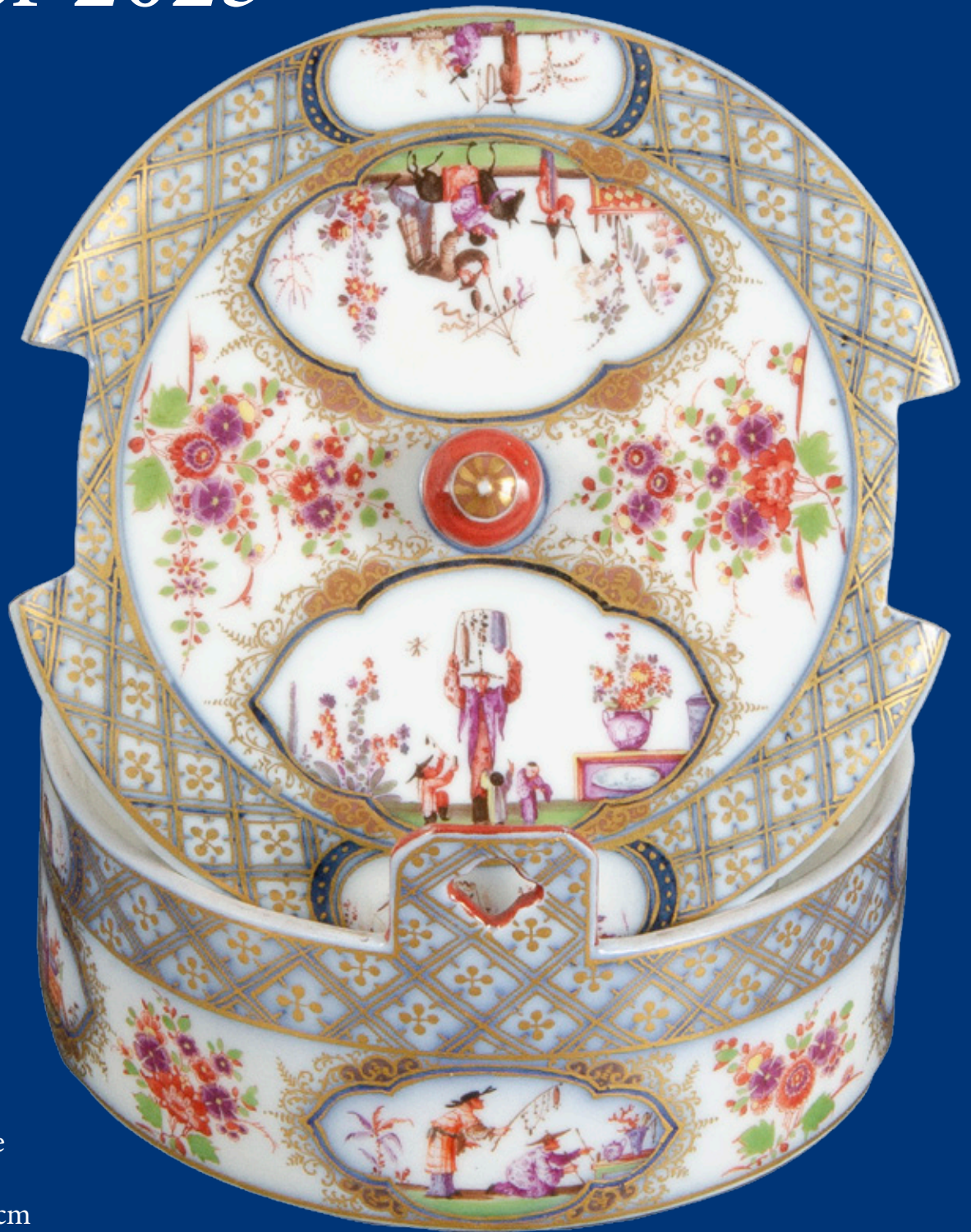
Runde Butterdose Meissen 1725 H=6,2 cm, D=11,5 cm