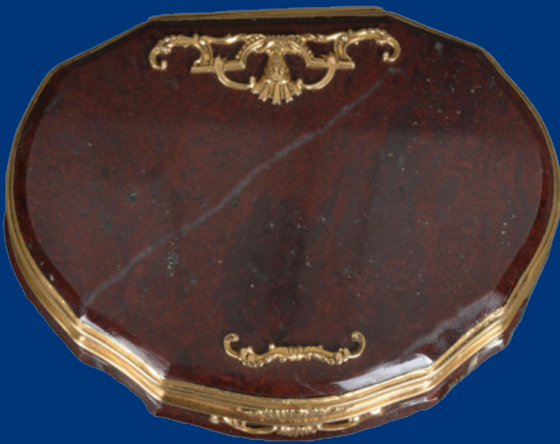
Tabatière, Dresden 1720/25 Jaspis mit Goldmontur H=1,7 cm, B=9,2 cm, T=7,3 cm