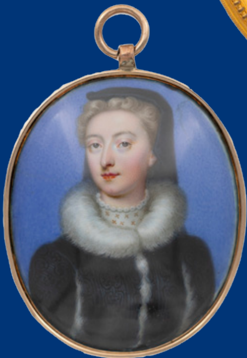
Christian Friedrich Zincke (1685 - 1767) 4.8 x 3.9cm