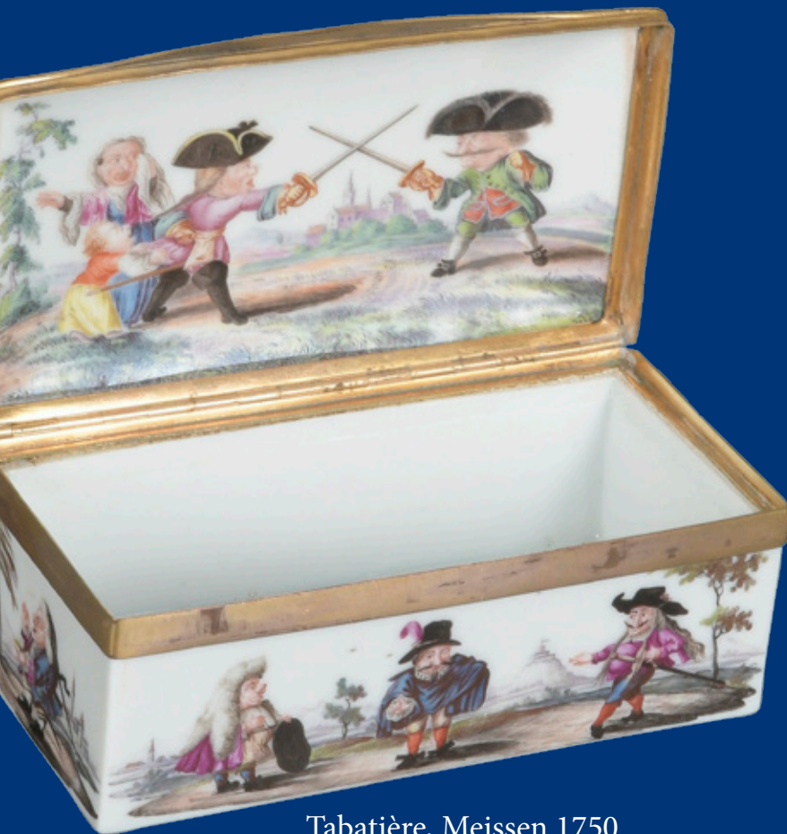
Tabatière, Meissen 1750 H=4,2 cm, B=10,7 cm, T=5,7 cm