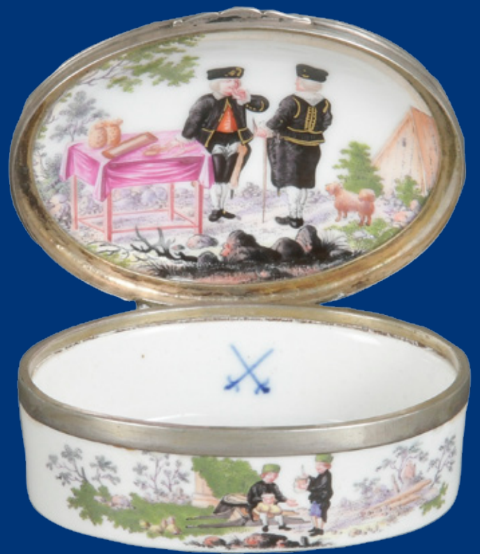
Tabatière, Meissen 1740/45 H=3,8 cm, B=8 cm, T=6,5 cm