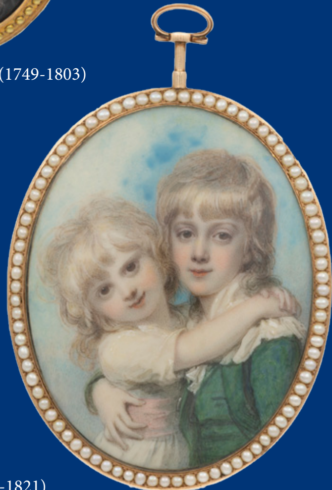
8,2 x 6,5 cm