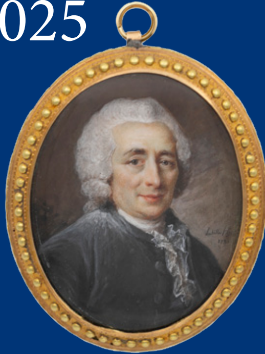
Adélaïde Labille-Guiard (1749-1803) 4 x 3 cm