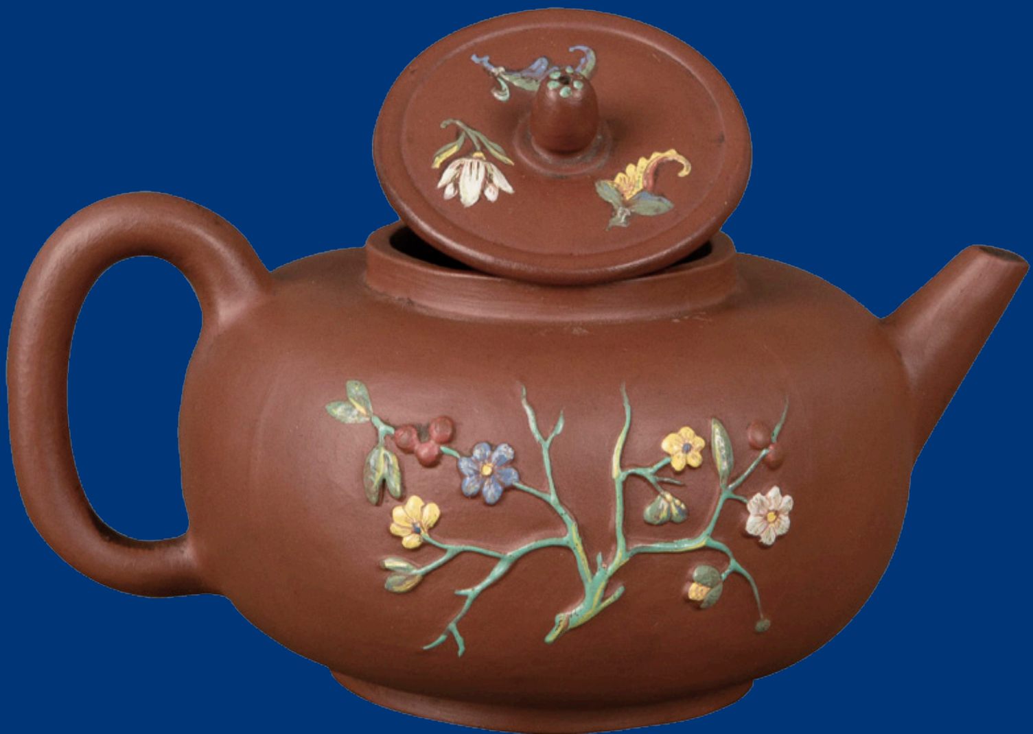
Böttgersteinzeug-Teekanne Meissen 1710-13 Modell von Johann Jacob Irminger Malerei von Johann Martin Meyer H=7,9 cm

Wir freuen uns auf Ihre Einlieferungen metz-auktion.de