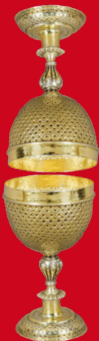
wohl Augsburg ca. 1595 wohl Meister Georg Ch. I. Erhard H=13,5 bzw. 13,8 cm