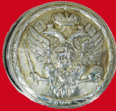
St. Petersburg 1786 Meister Clas J. Elers D=14,2 cm