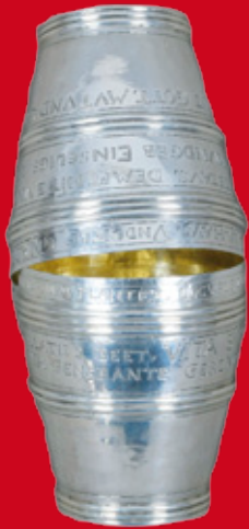
Augsburg ca. 1690 H=14 cm