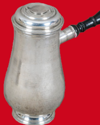
Straßburg 1760 Meister Johann J. Kirstein H=19 cm