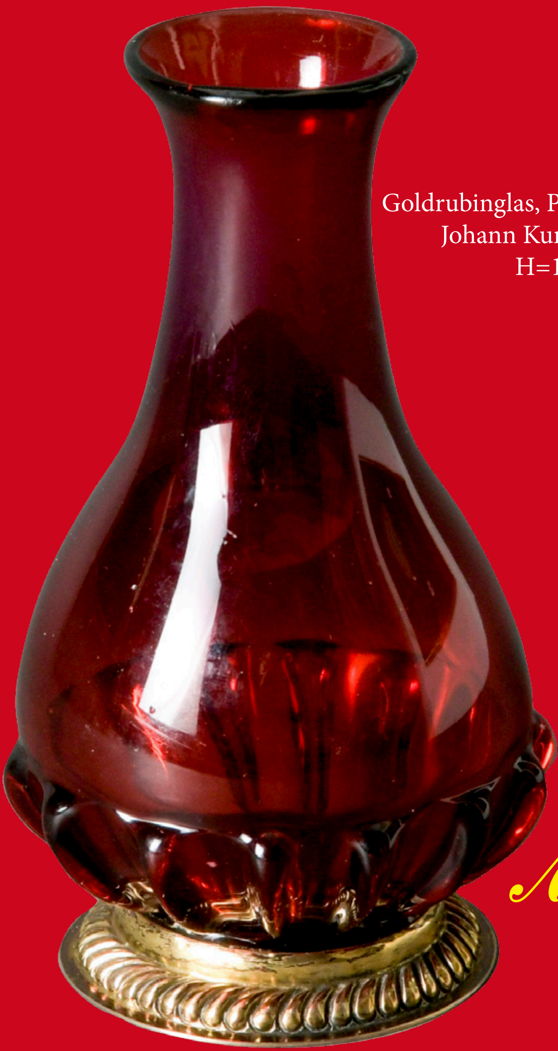
Goldrubinglas, Potsdamer Glashütte Johann Kunckel um 1700 H=12,7 cm