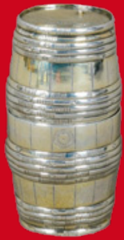
Nürnberg ca. 1590 Meister Nicolaus I. Emmerling H=12,5 cm