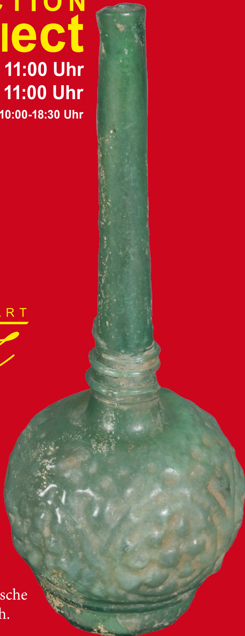
Rosenwasserflasche Persien 10. Jh. H=21,5 cm.