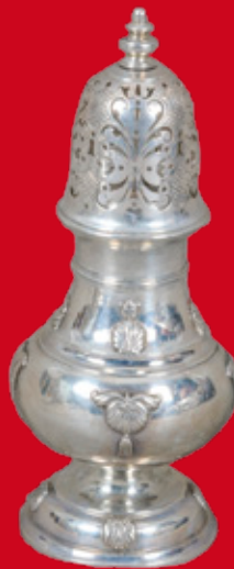
Emden 1746 Meister B. Hayens H=17,5 cm