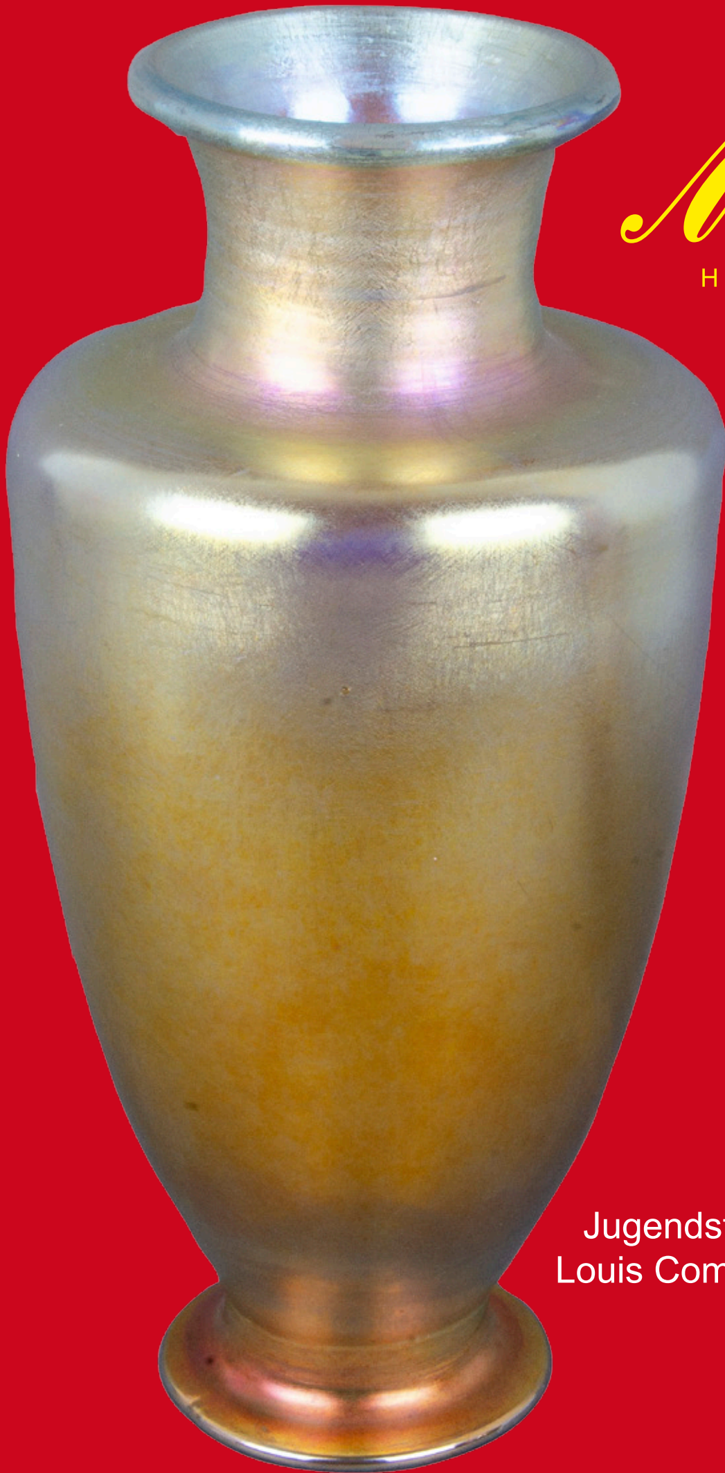
Jugendstil-Vase, New York Louis Comfort Tiffany um 1900 H=43 cm