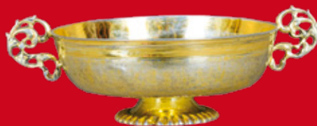
Straßburg ca. 1690 Meister Michael Widder D=17,3, H=6,4 cm