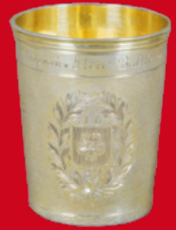
Straßburg 1689 Meister Philip Jacob Brandt H=10 cm