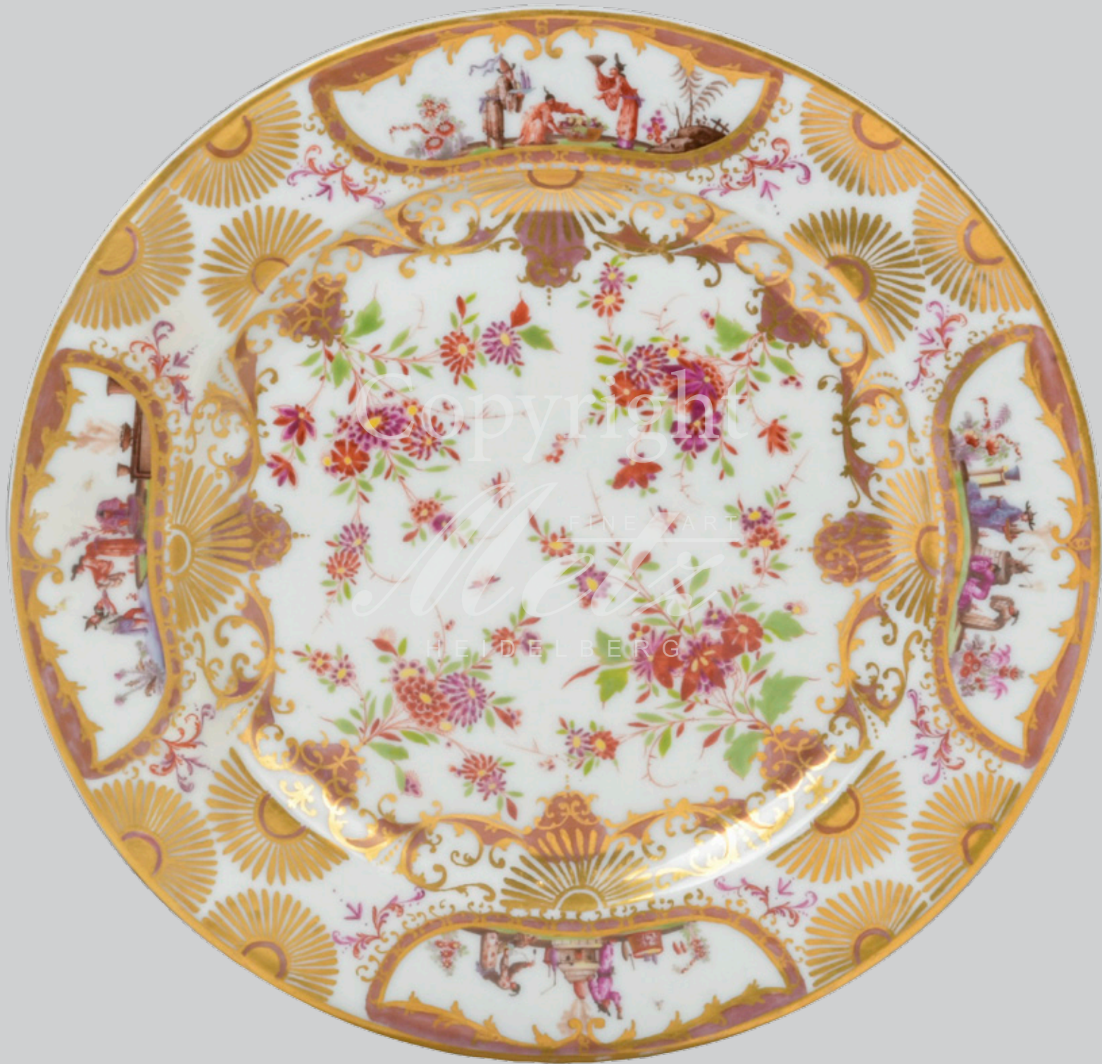
Prunkteller, Meissen 1723-25 D=22 cm