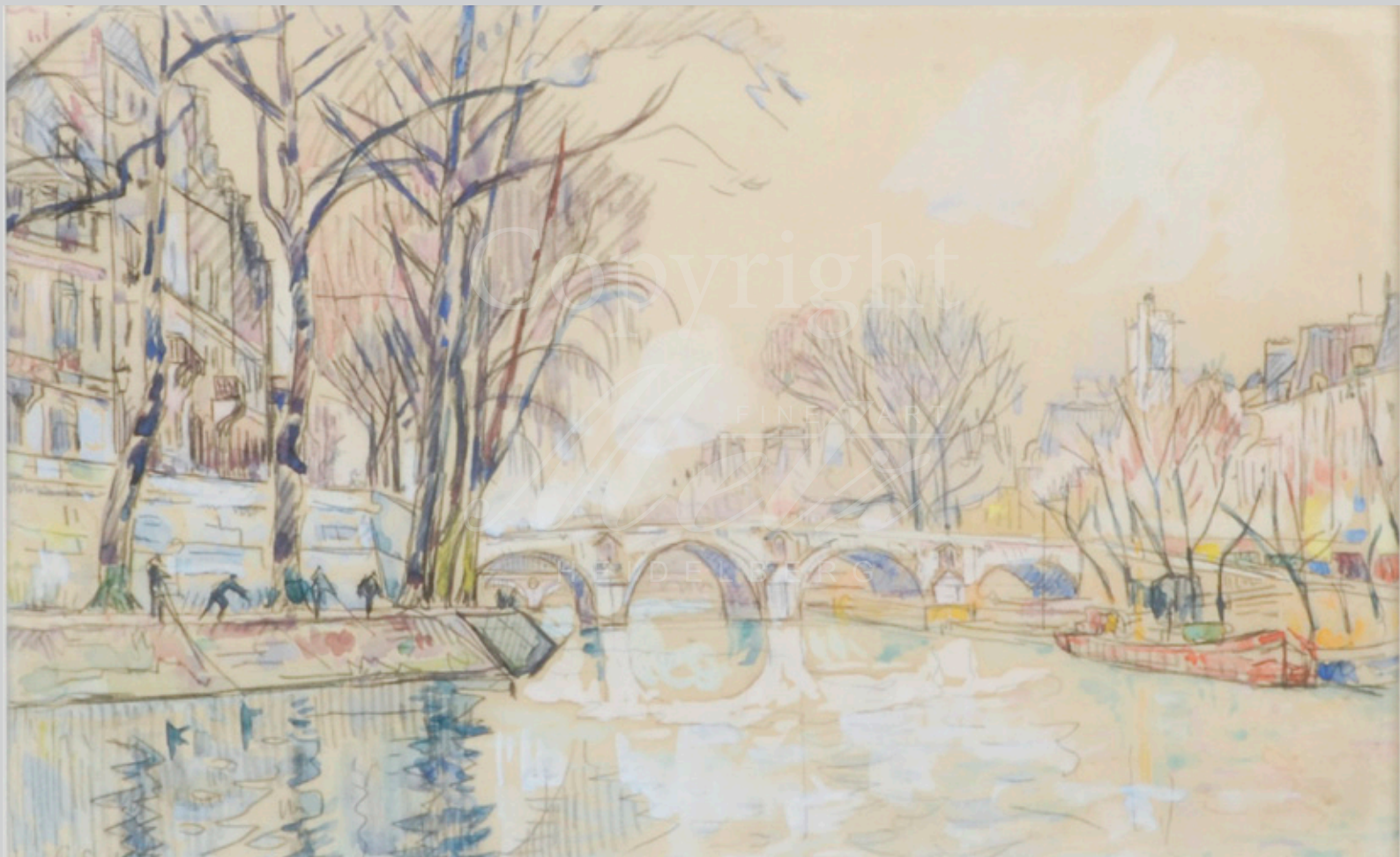
Paul Signac (1863-1935), Aquarell, monogr. 27 x 43 cm