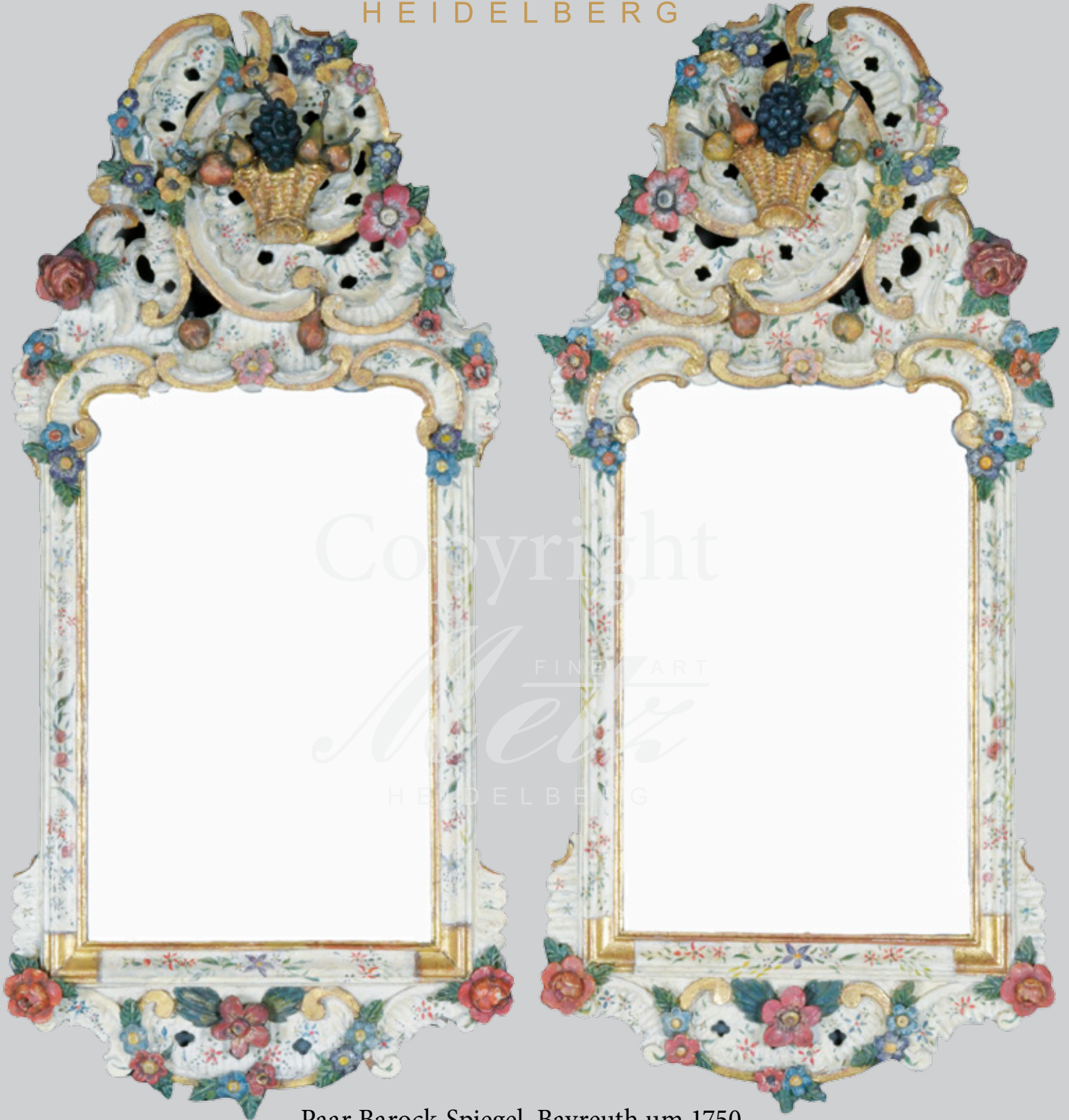
Paar Barock-Spiegel, Bayreuth um 1750 Holz, durchbrochen geschnitzt und farbig gefasst 91 x 42 cm bzw. 92 x 43 cm