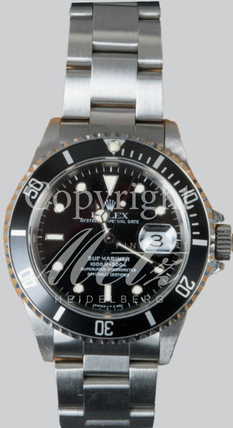
Rolex-Herrenarmbanduhr „Submariner Date“, 40 mm, in Box