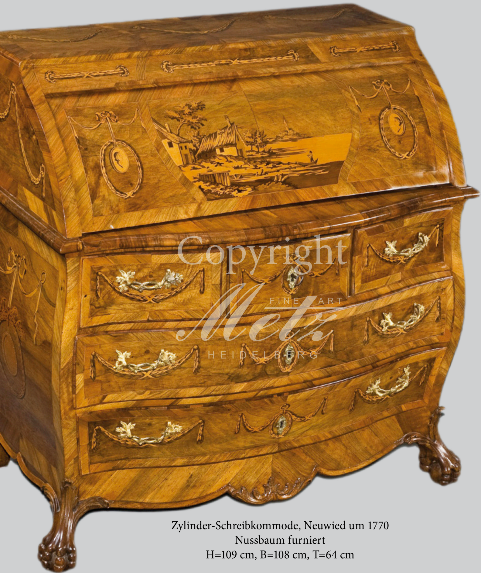
Zylinder-Schreibkommode, Neuwied um 1770 Nussbaum furniert H=109 cm, B=108 cm, T=64 cm