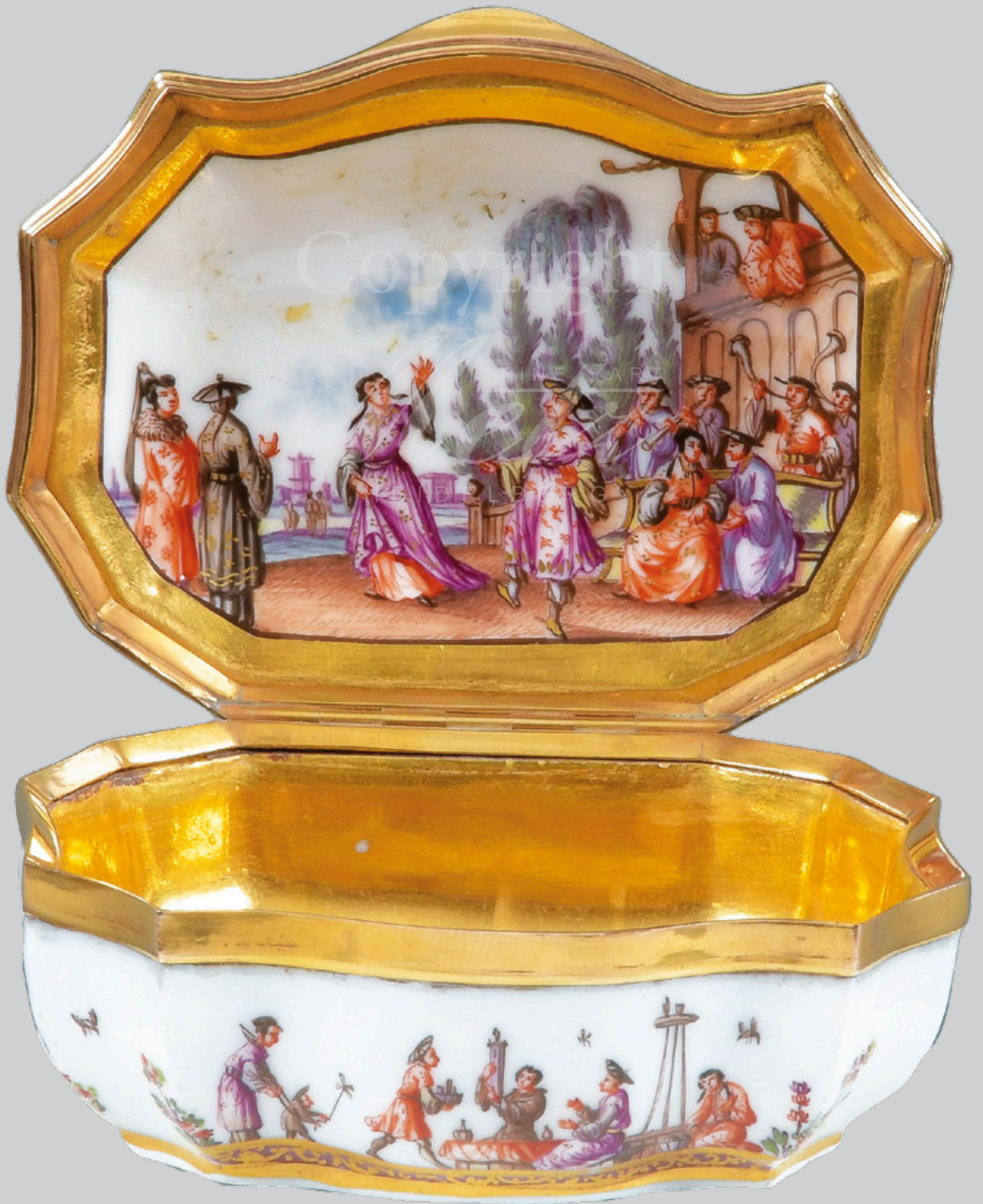
Tabatière, Meissen 1730-35 Malerei von J. G. Hoeroldt H=3,3 cm, B=7 cm, T=5,4 cm