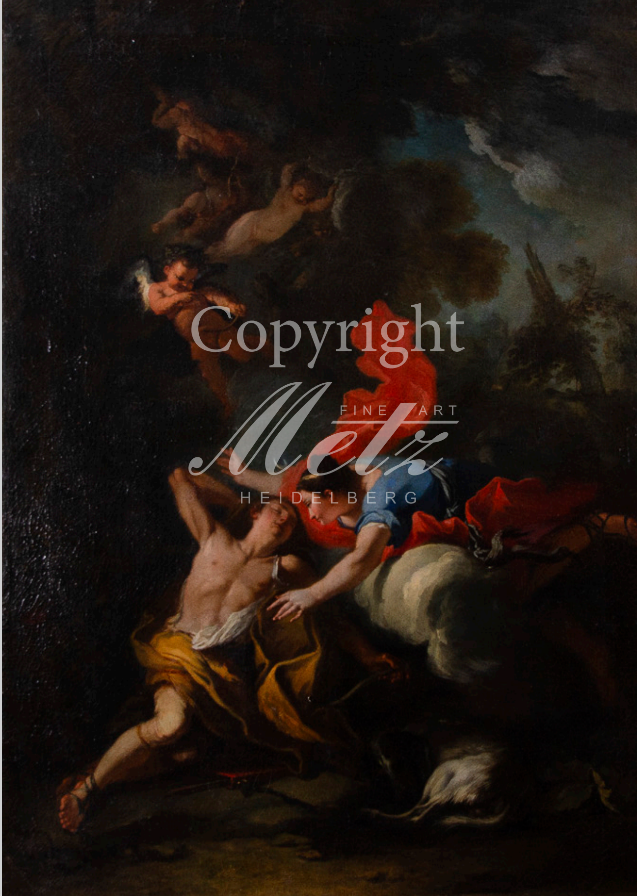
Italienischer Meister des 17. Jhs. Selene und Edymion. Öl/Lw. 148 x 104 cm