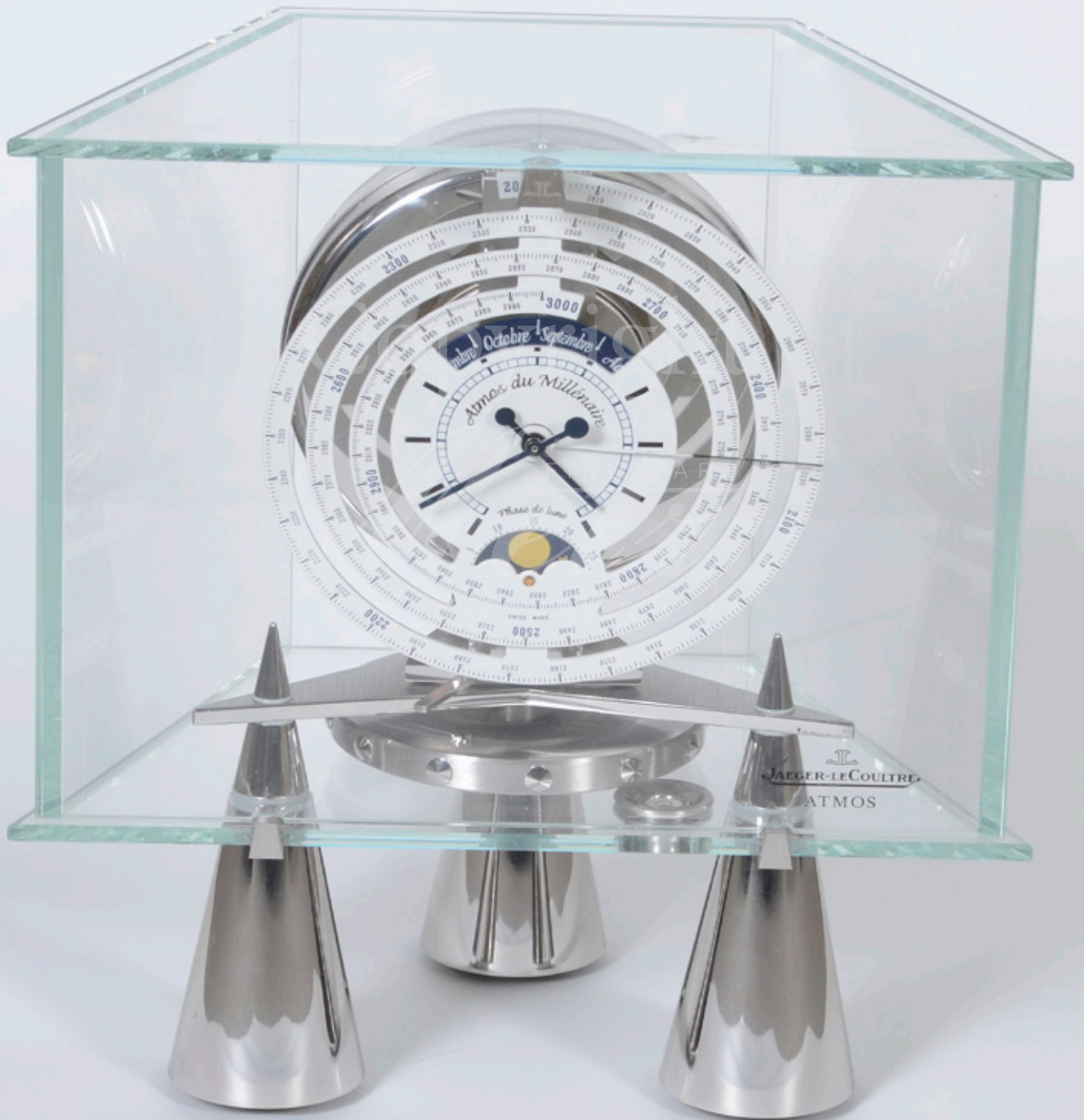
Jaeger LeCoultre, Atmos du Millénaire Atlantis 28 x 25 x 15 cm