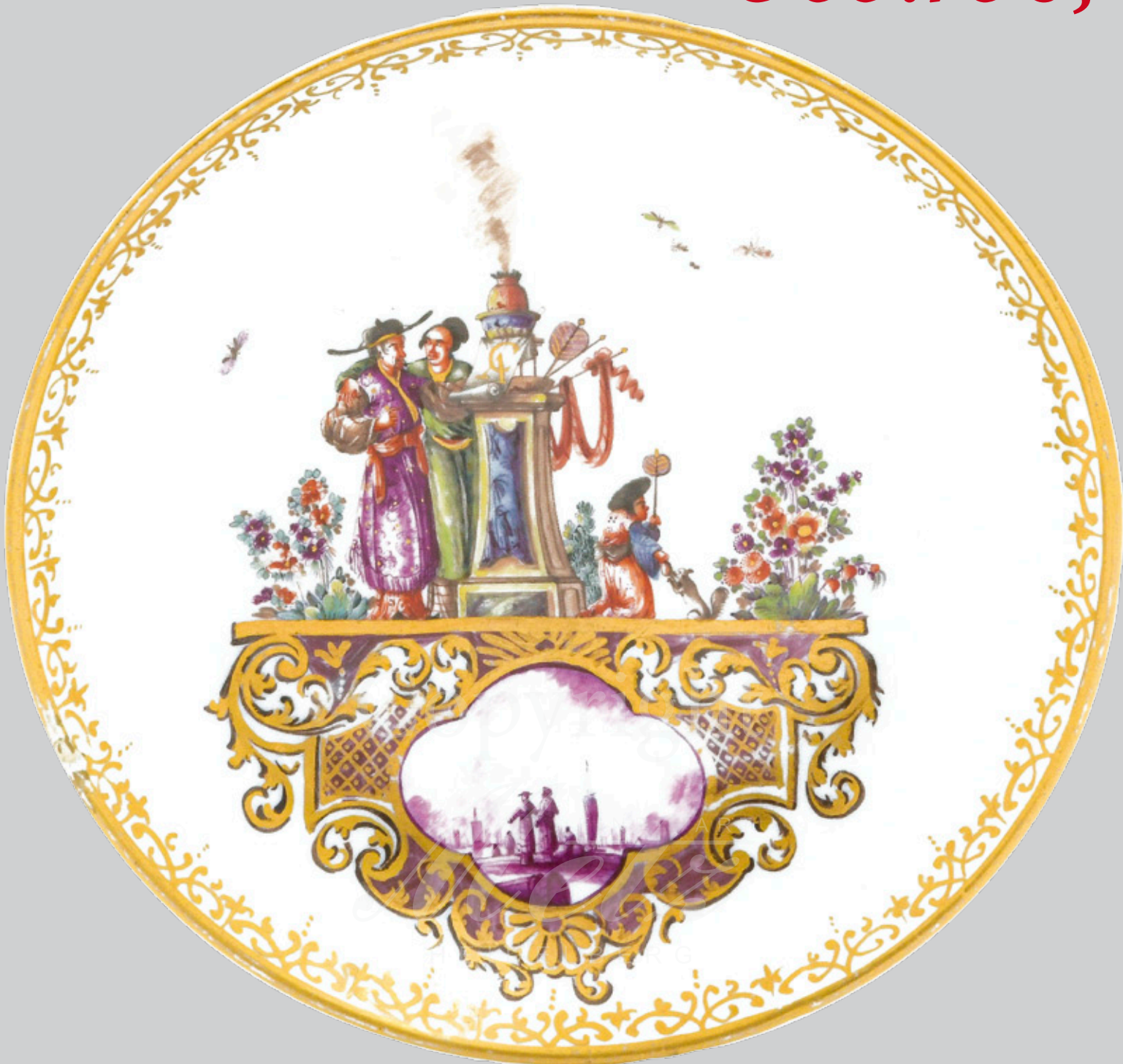
Koppchen mit Unterschale aus dem Wappenservice Clemens August Meissen 1735