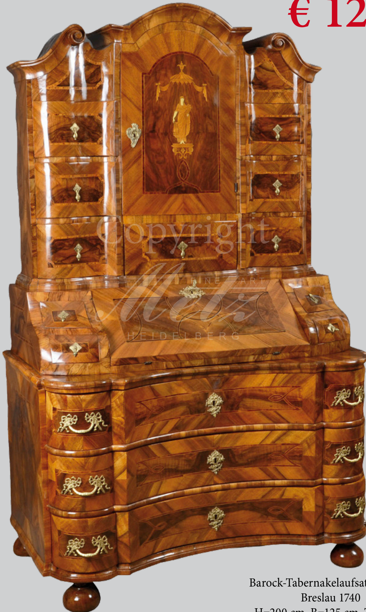
Barock-Tabernakelaufsatzsekretär Breslau 1740 H=200 cm, B=125 cm, T=66 cm