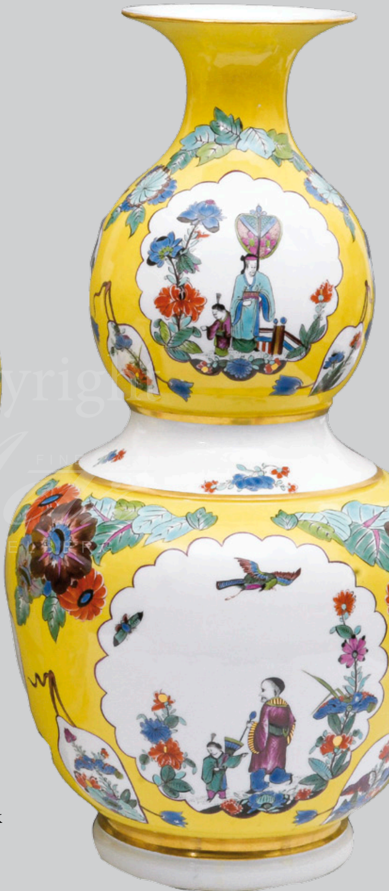
Paar Doppelkürbisvasen Meissen 1734

Malerei von Adam Friedrich von Löwenfinck H=43,6 bzw. 44 cm