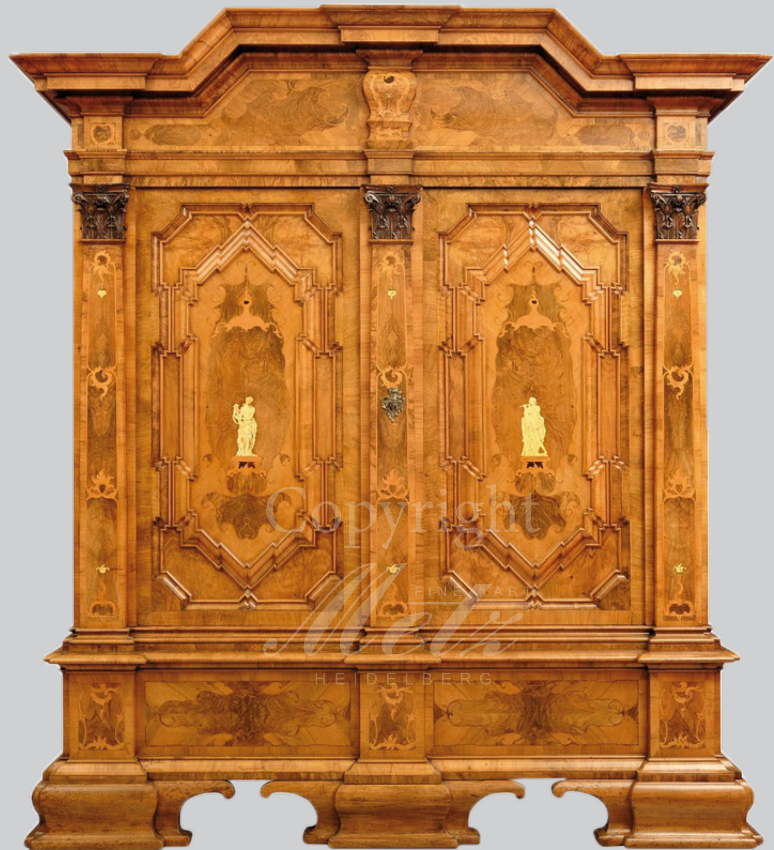
Barockschränk, Braunschweig 1740 H=232 cm, B=210 cm, T=80 cm