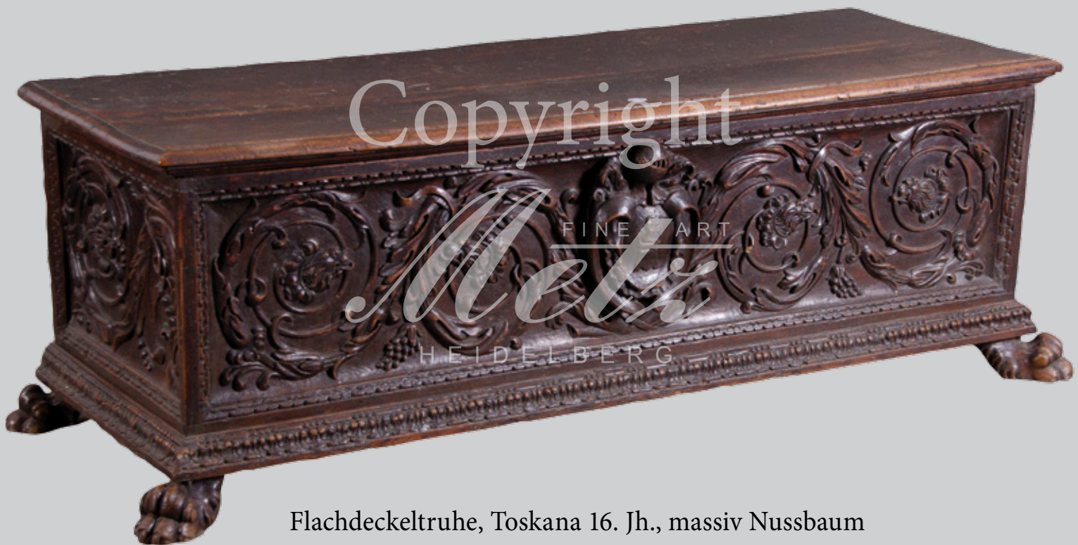
Flachdeckeltruhe, Toskana 16. Jh., massiv Nussbaum H=57 cm, B=159 cm, T=62 cm