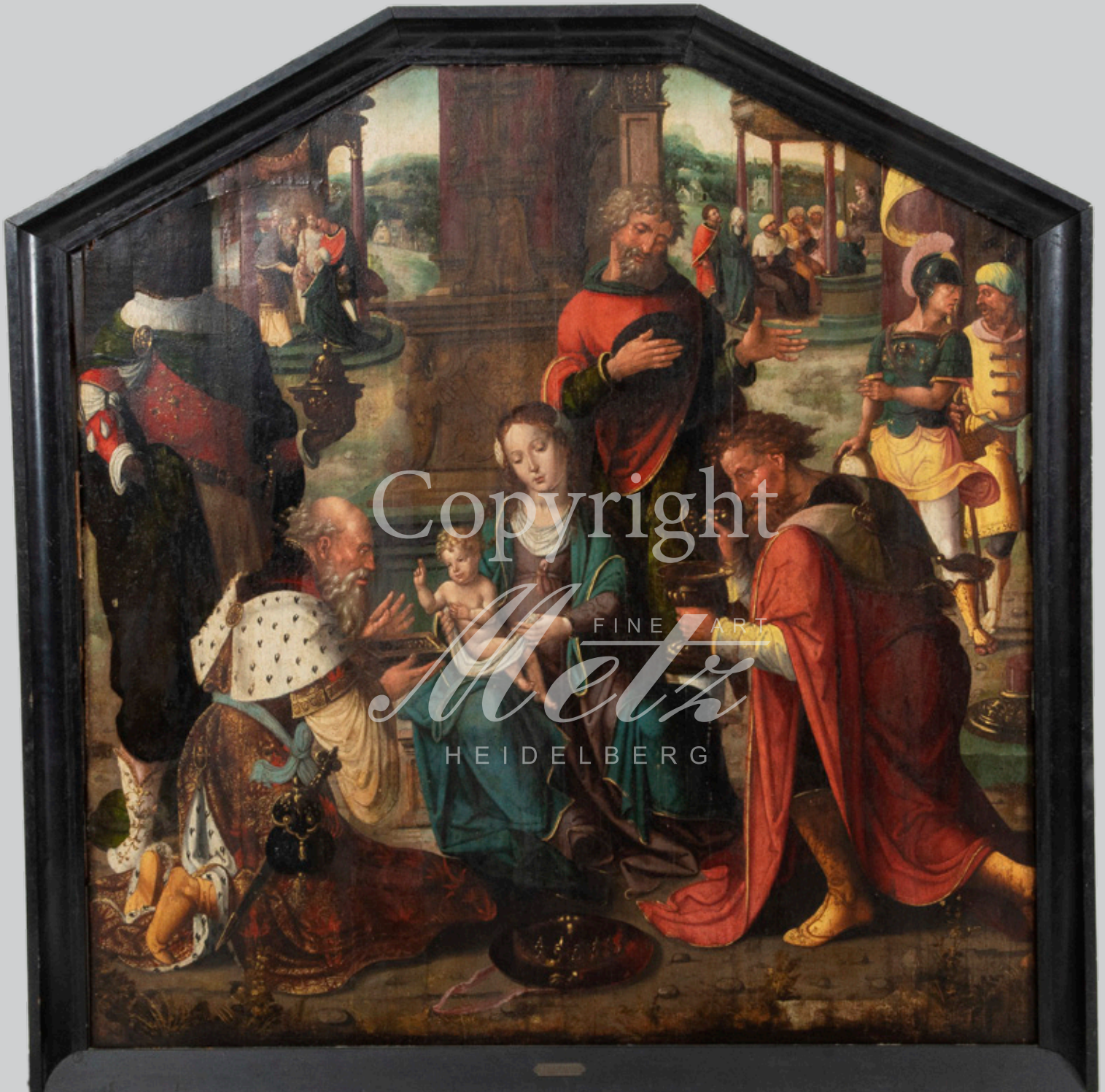
Pieter Coecke van Aelst (1502-1550) attrib. Anbetung der Hl. Drei Könige. Öl/Holz, gerahmt 150 x 148 cm