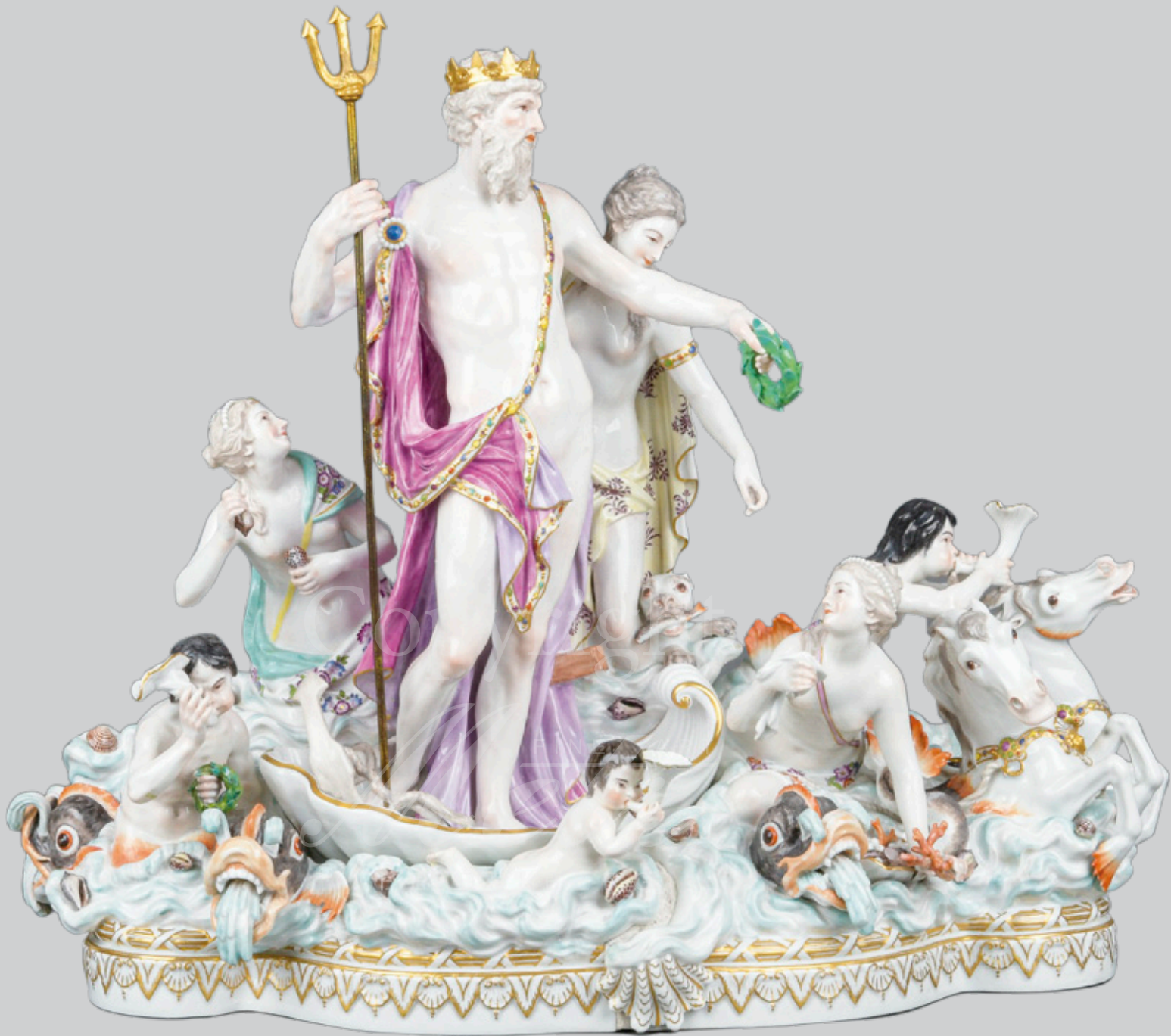
Neptun u. Thetis für die Zarin Katharina die Große, Meissen 1763-73 Modell von J. J. Kaendler H=48,3 cm