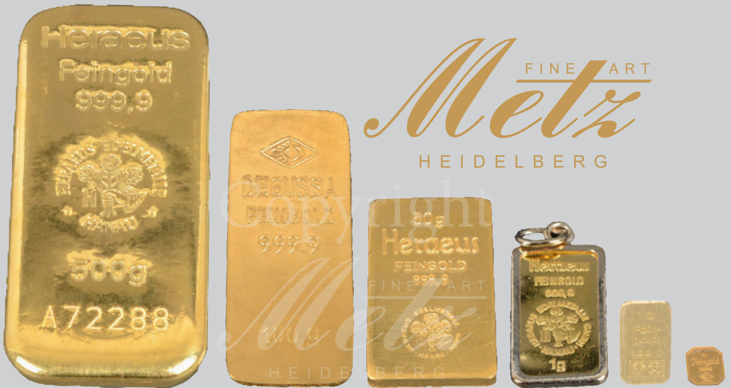
Sammlung 5 Goldbarren