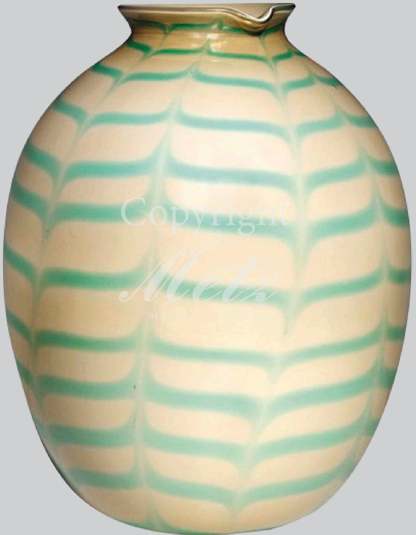
„Fenicio“-Glasvase, Murano, Carlo Scarpa (1906-1978) gefertigt u. sign. von M.V.M. Cappellin & Co. 1928-31 H=38 cm