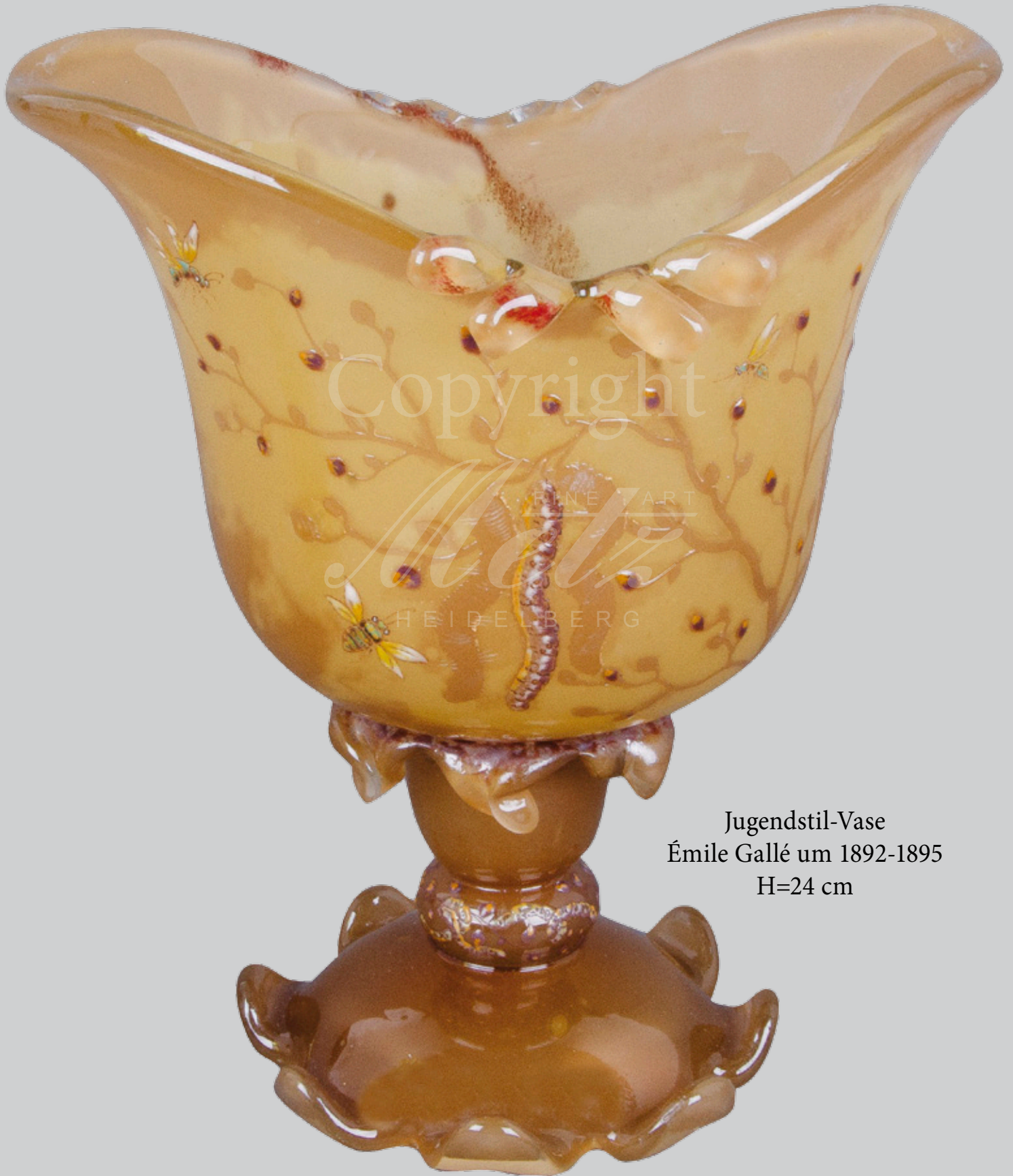
Jugendstil-Vase Émile Gallé um 1892-1895 H=24 cm