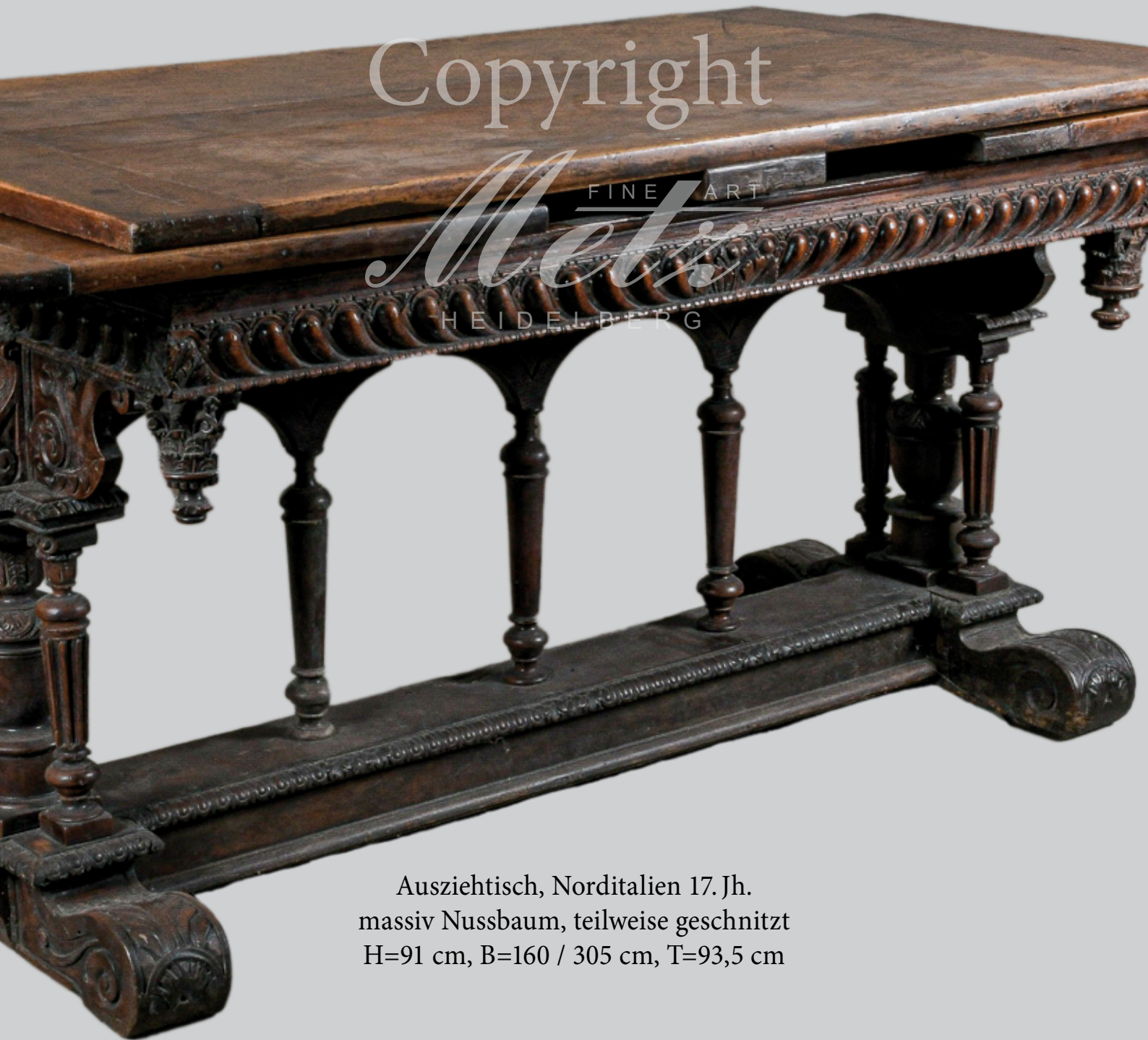
Ausziehtisch, Norditalien 17. Jh. massiv Nussbaum, teilweise geschnitzt H=91 cm, B=160 / 305 cm, T=93,5 cm