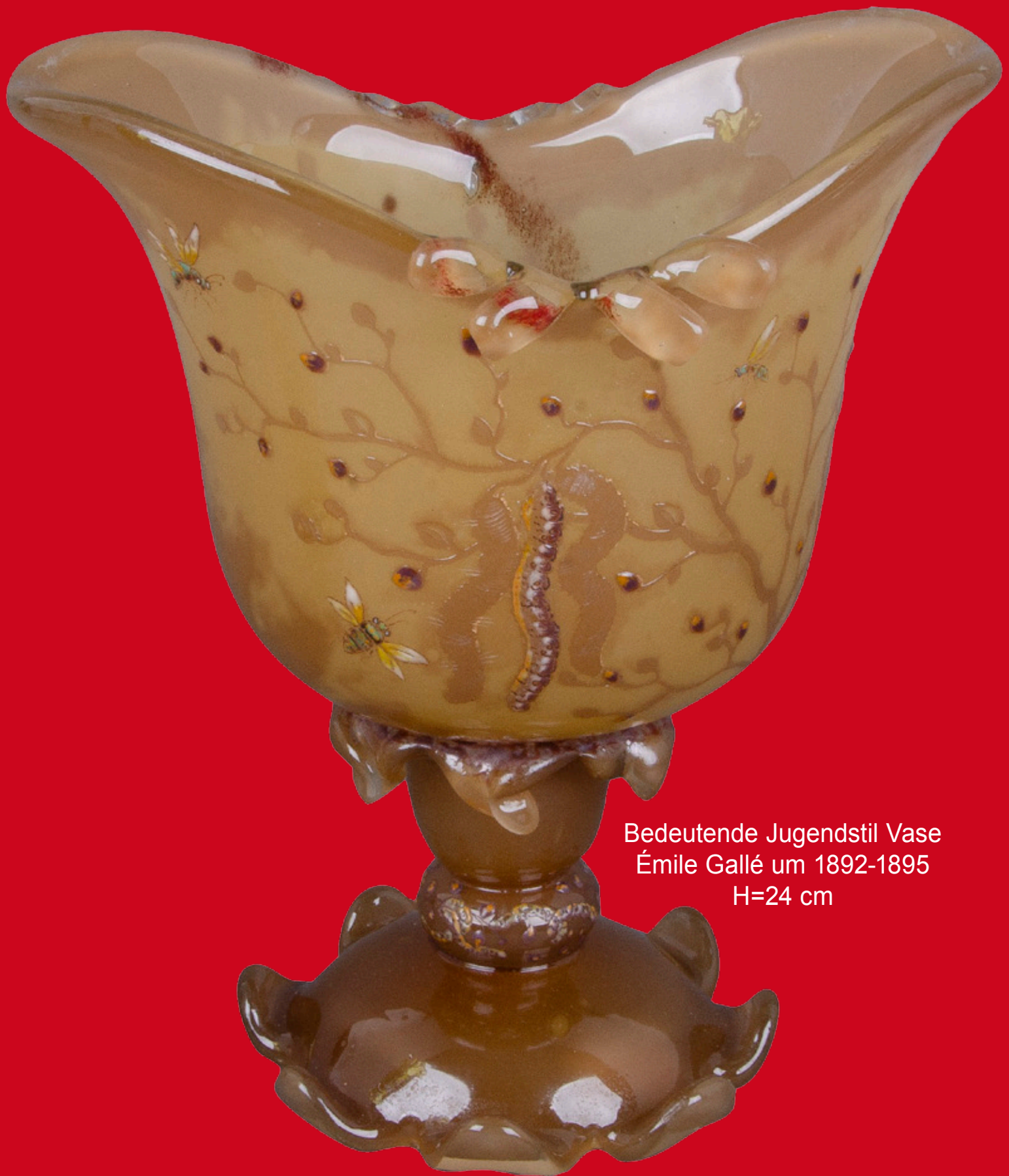
Bedeutende Jugendstil Vase Émile Gallé um 1892-1895 H=24 cm

Art & Collect AUCTION Freitag, 19. Juli 2024 Samstag, 20. Juli 2024