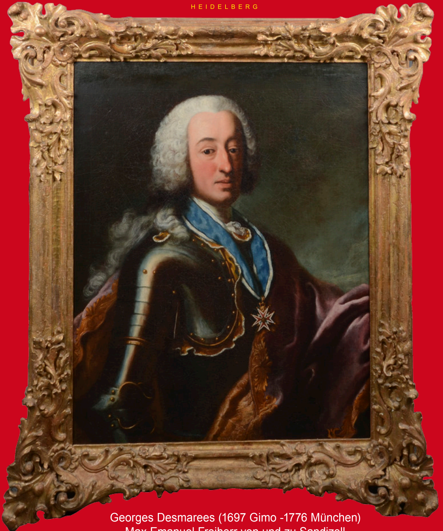
Georges Desmarees (1697 Gimo -1776 München) Max Emanuel Freiherr von und zu Sandizell Hüftbild im Kürass mit Kreuz des Hausritterordens v. Hl.Georg Öl /Lw., gerahmt Rückseitig auf Leinwand in Tinte alt beschriftet u. dat. 1745 Originaler verg. Effner -Rahmen 87 x 68 cm