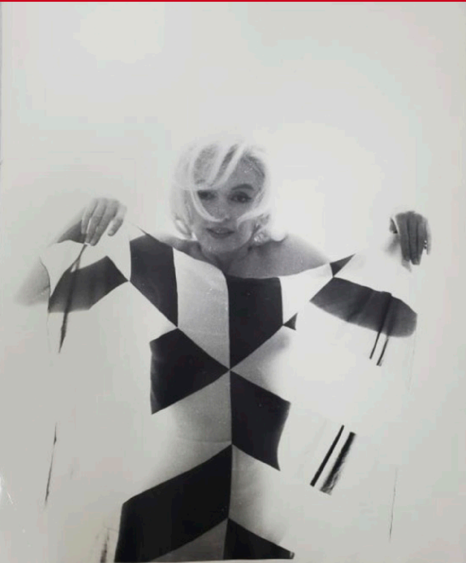
Bert Stern (1929-2013), „Marilyn Monroe in striped scarf - The last sitting, 1962“ Silbergelatineabzug, 50,5 x 40,4 cm

Art & Collect AUCTION Freitag, 19. Juli 2024 Samstag, 20. Juli 2024