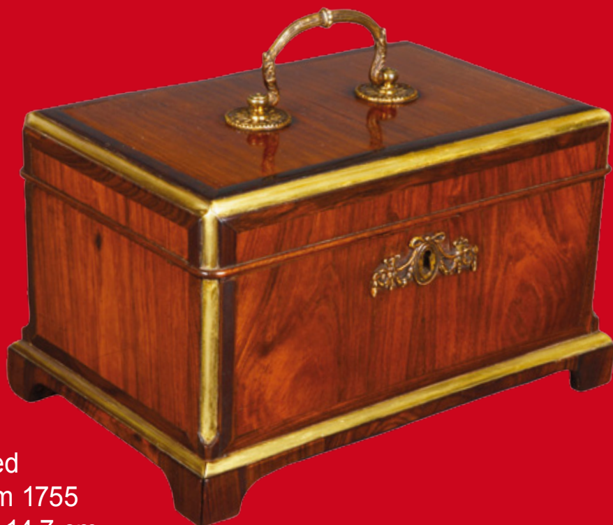
Kästchen, Neuwied Abraham Roentgen um 1755 H=13 cm, B=22,5 cm, T=14,7 cm