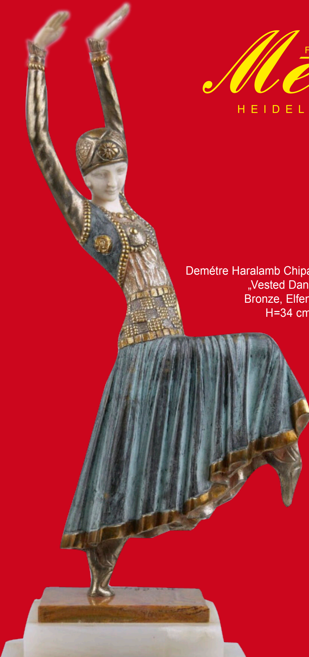
Demêtre Haralamb Chiparus (1886-1947) „Vested Dancer“ Bronze, Elfenbein H=34 cm