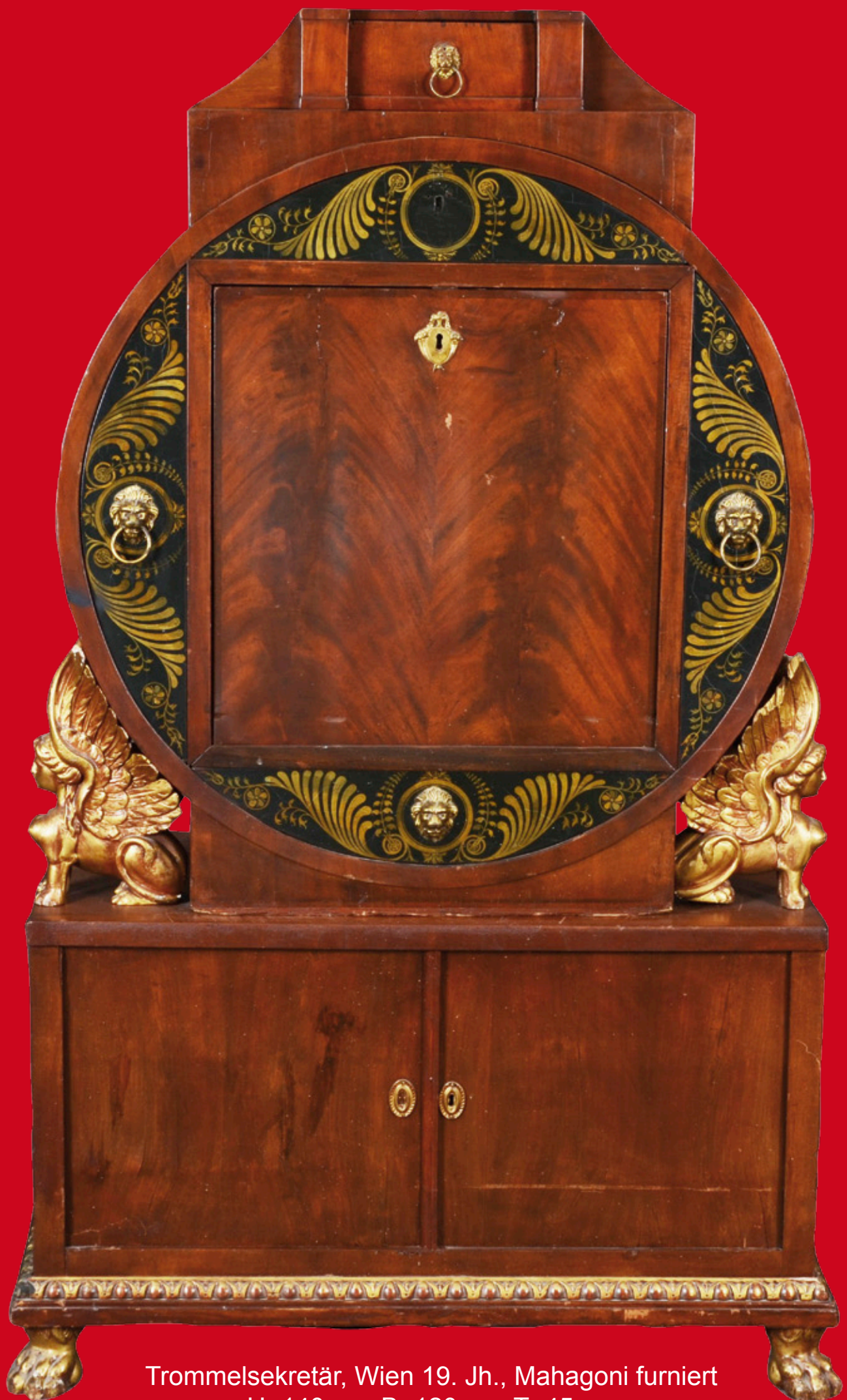
Trommelsekretär, Wien 19. Jh., Mahagoni furniert H=140 cm, B=120 cm, T=45 cm