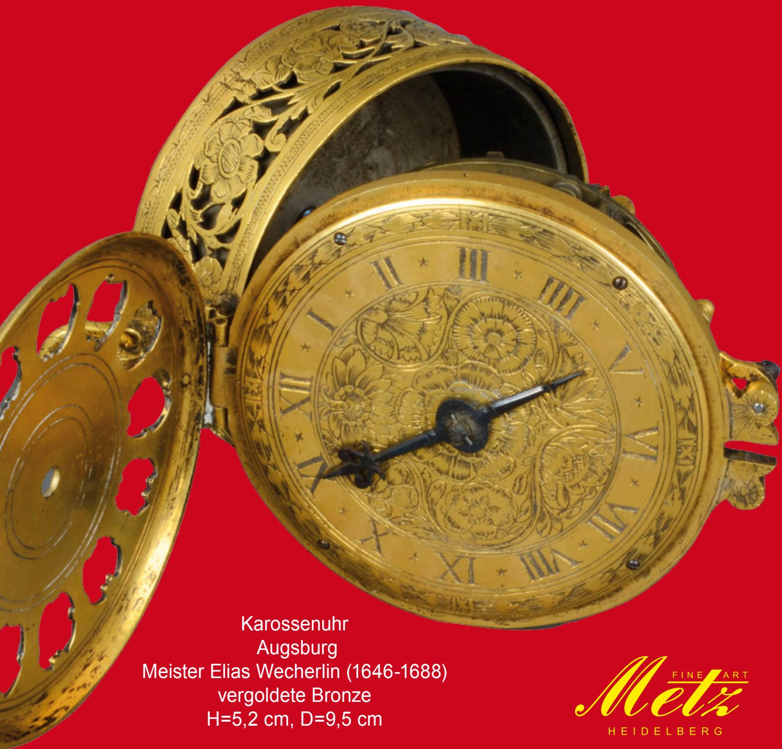
Karossenuhr Augsburg Meister Elias Wecherlin (1646-1688) vergoldete Bronze H=5,2 cm, D=9,5 cm

Besichtigung: Montag, 15., bis Donnerstag, 18. Juli, 10:00-18:30