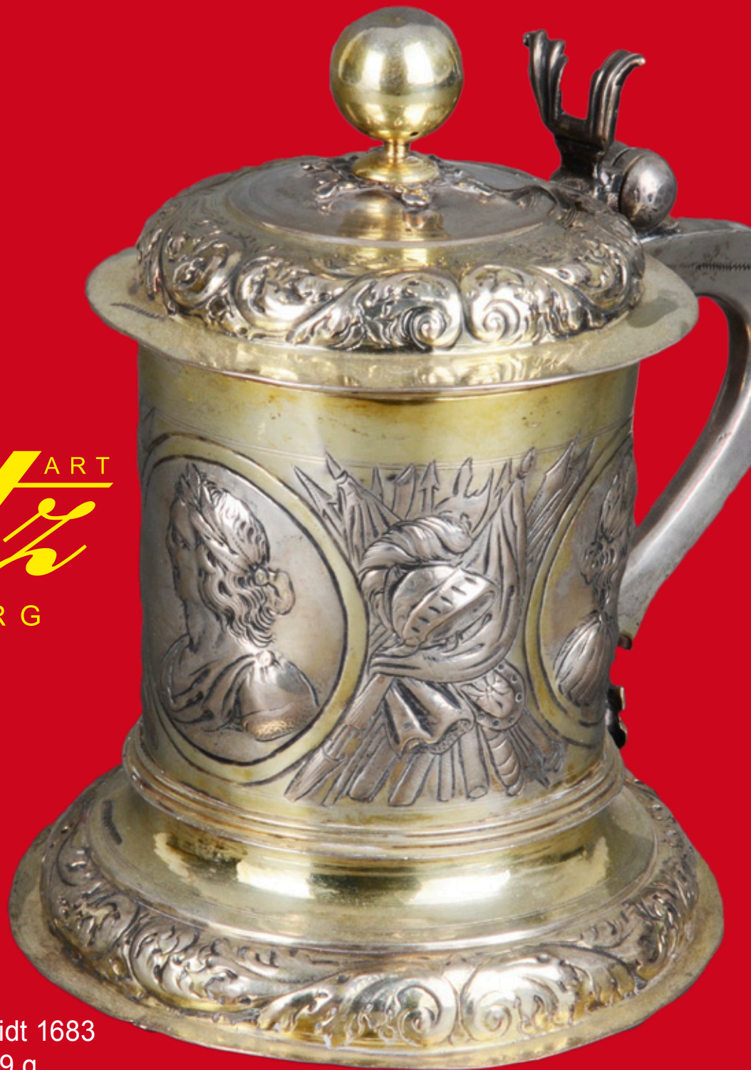
Prunkkrug Leipzig, Meister J. P. Schmidt 1683 Silber, vermeilt, ca. 829 g H=20,3 cm