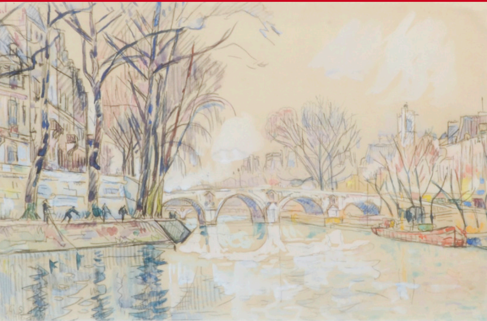
Paul Signac (1863-1935) Angler am Ufer der Seine, Aquarell, li. unten monogr., hi. Glas gerahmt 27 x 43 cm

Besichtigung: Montag, 15., bis Donnerstag, 18. Juli, 10:00-18:30