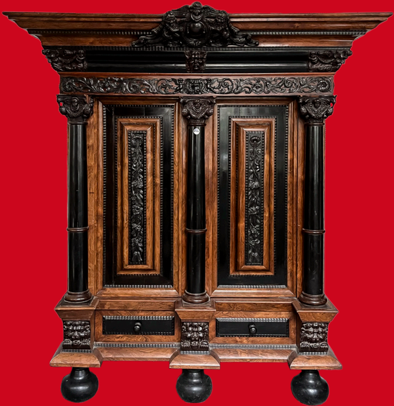
Barockkissenschrank Amsterdam 1770

Eichenkorpus, Palisander furniert, teilw. aufwändig geschnitzt und ebonisiert H=205 cm, B=185 cm, T=90 cm