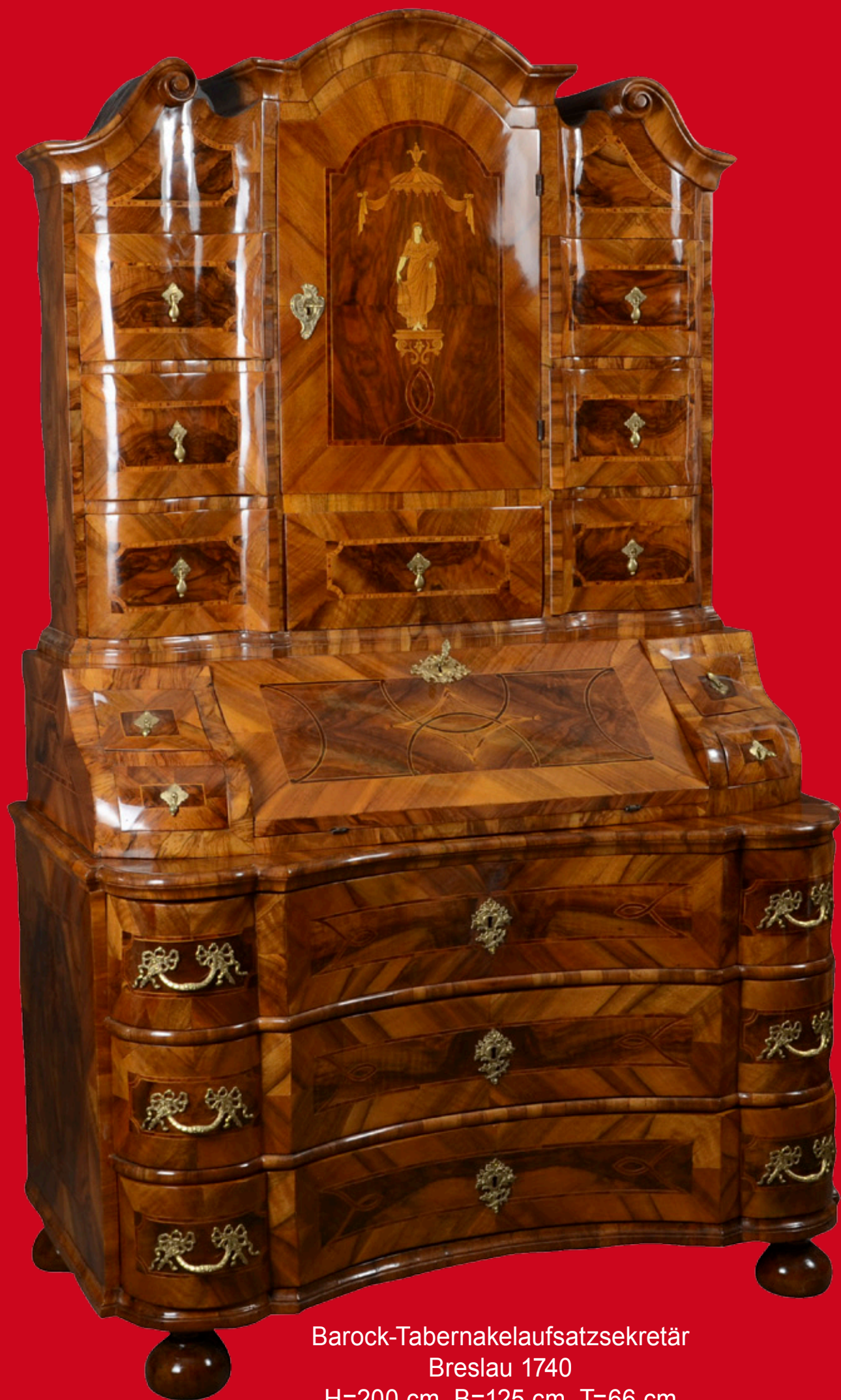
Barock-Tabernakelaufsatzsekretär Breslau 1740 H=200 cm, B=125 cm, T=66 cm