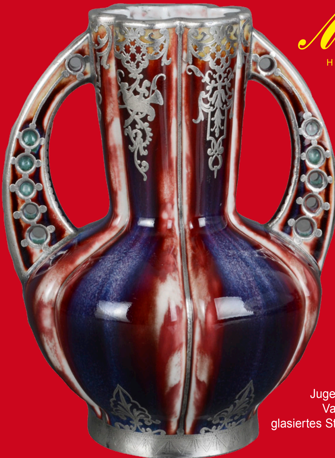
Jugendstil-Henkelvase Vallauris um 1900 glasiertes Steinzeug mit Silberoverlay H=20 cm