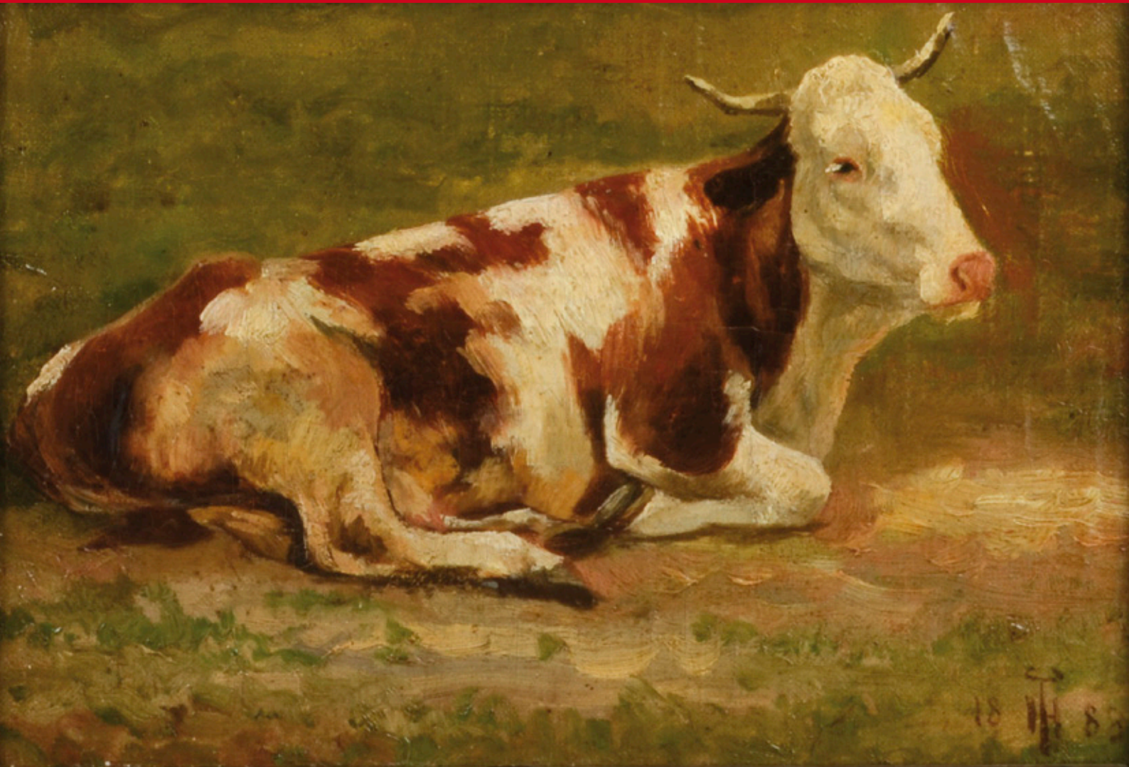
Hans Thoma (1839-1924) Ruhende Kuh in Landschaft Öl/Lw., re./u./monogr./dat. 1888 18,5 x 26,5 cm

Besichtigung: Montag, 15., bis Donnerstag, 18. Juli, 10:00-18:30