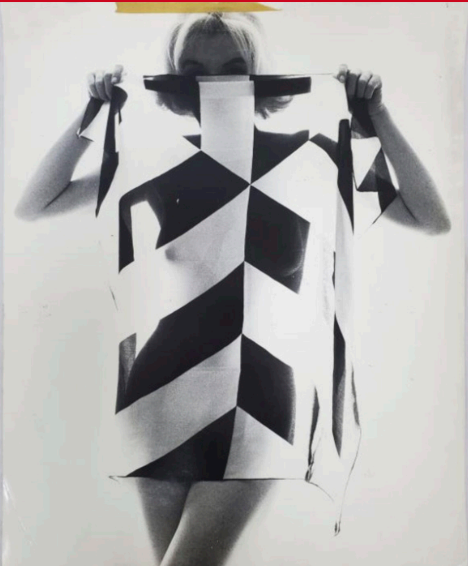
Bert Stern (1929-2013), „Marilyn Monroe in striped scarf - The last sitting, 1962“ Silbergelatineabzug, 50,5 x 40,4 cm

Freitag, 19. Juli 2024 Samstag, 20. Juli 2024