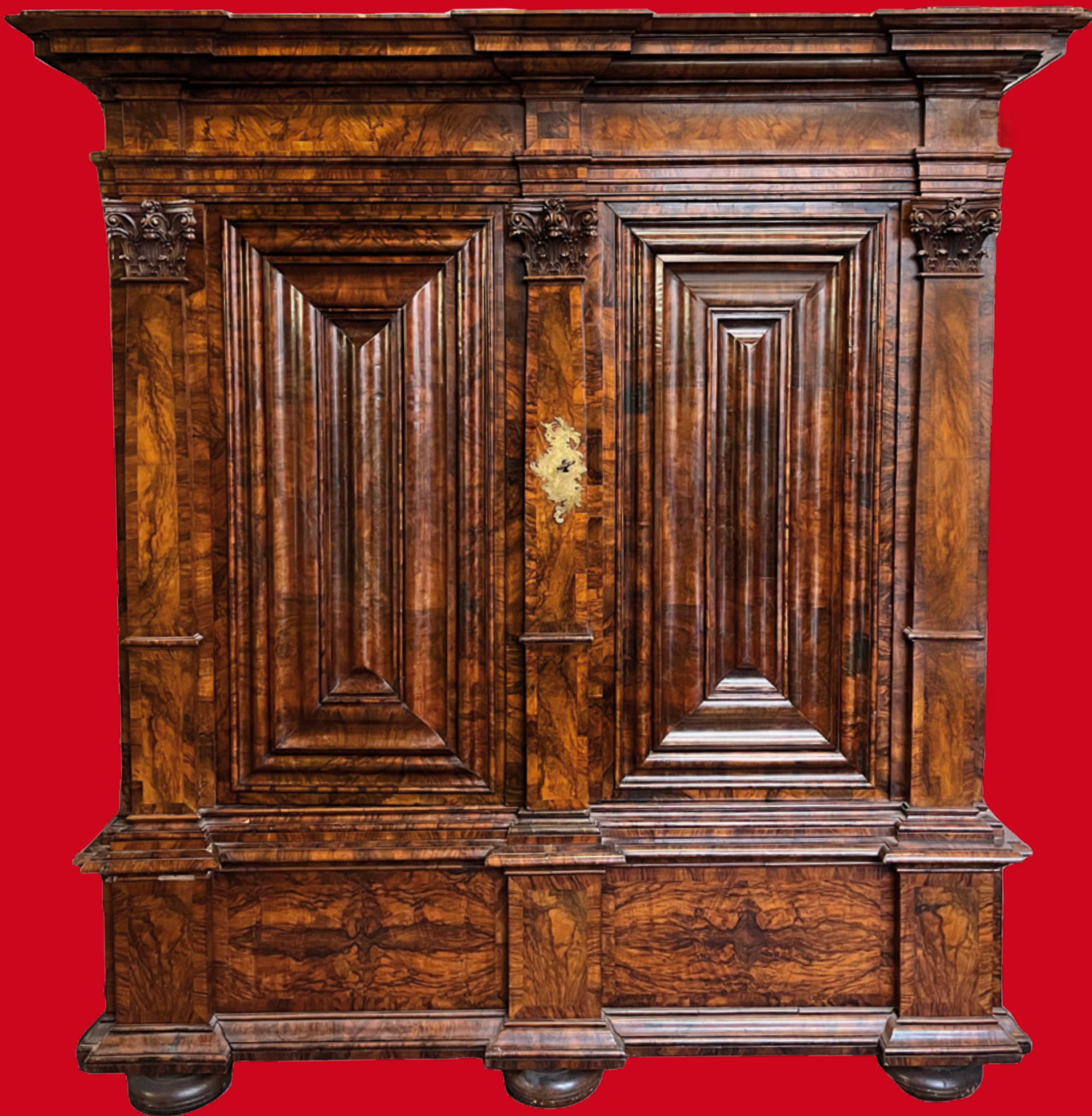
Pilasterschrank, Frankfurt um 1750 Nussbaumwurzel querfurniert, mit fein ziseliertem Bronzebeschlag H=227 cm, B=209 cm, T=78,5 cm

Besichtigung: Montag, 15., bis Donnerstag, 18. Juli, 10:00-18:30