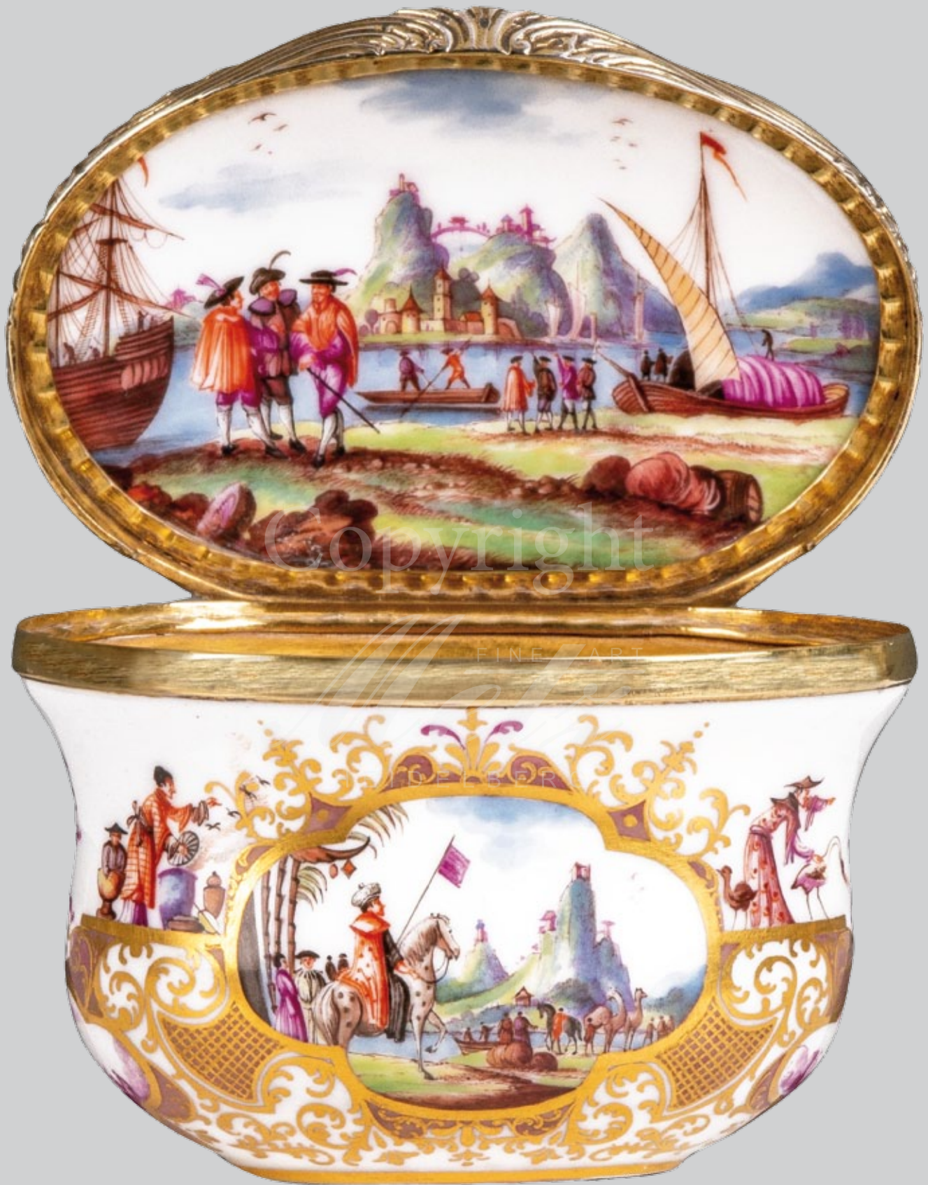
Tabatière, Meissen 1723-25 Malerei von Johann Gregorius Hoeroldt