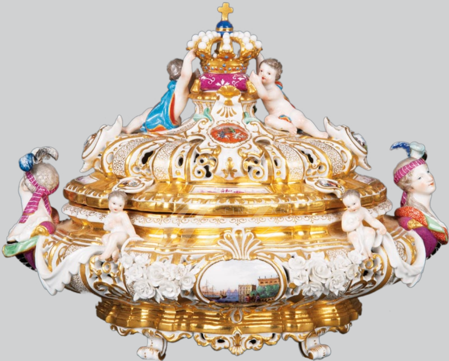
Drüselkästchen. Meissen 19. Jh. Modell nach Johann Joachim Kaendler