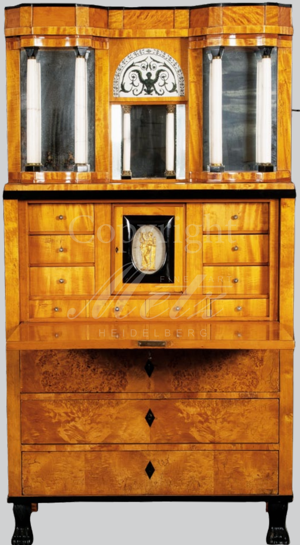
Biedermeier-Sekretär Berlin 1810, Vogelaugenahornfurnier