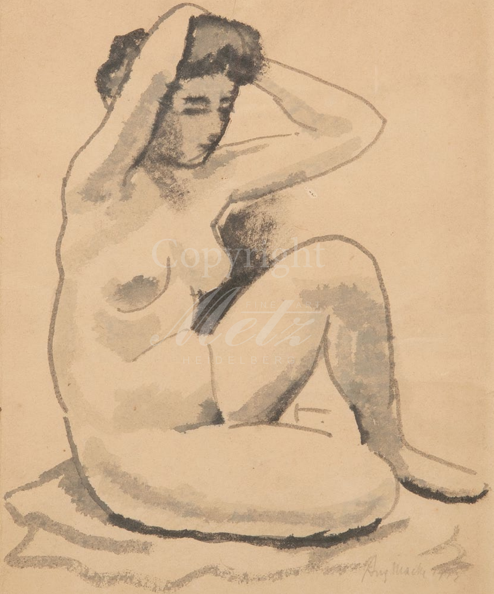
August Macke (1887-1914) attrib., Sitzender Frauenakt Tusche, laviert, re./u./sign., dat. 1912