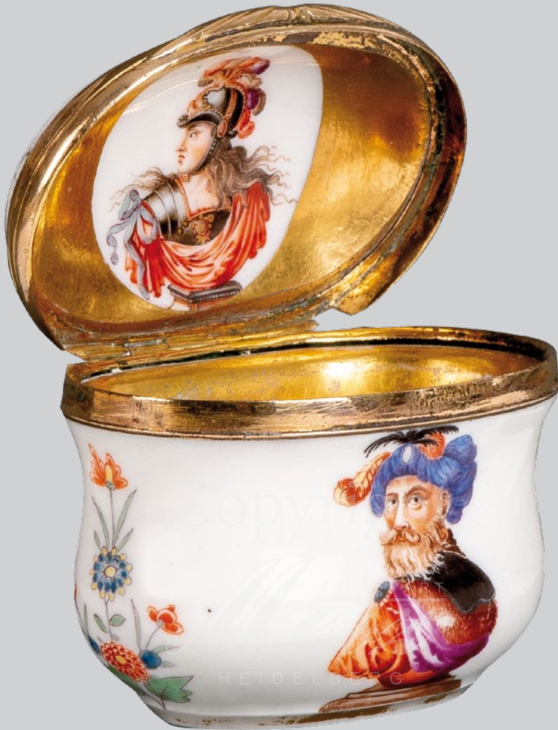
Tabatière, Meissen 1730 Malerzeichen für Philipp Ernst Schindler