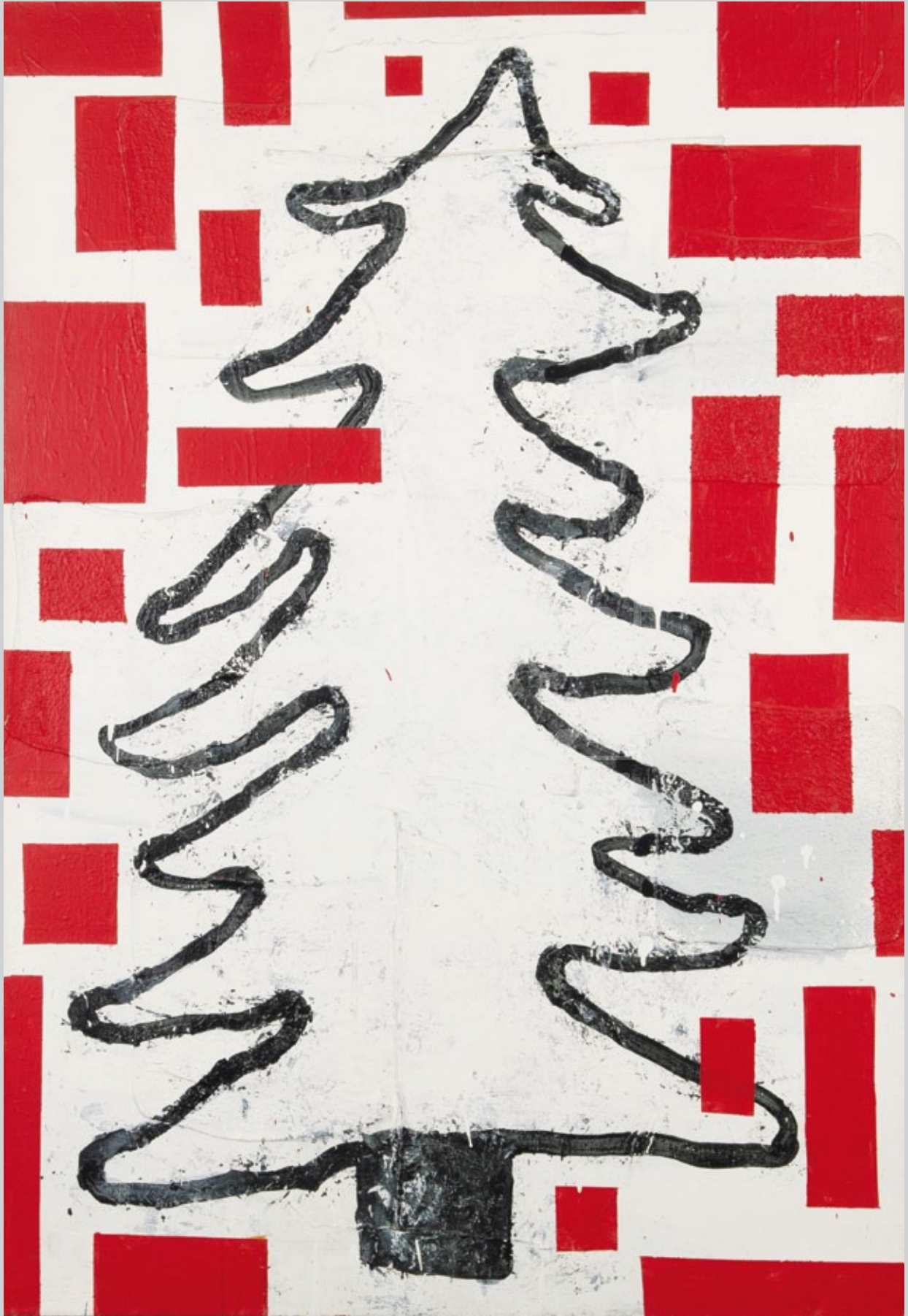
Donald Baechler (1956-2022), Öl/Lw.-Collage monogr./dat. (19)86