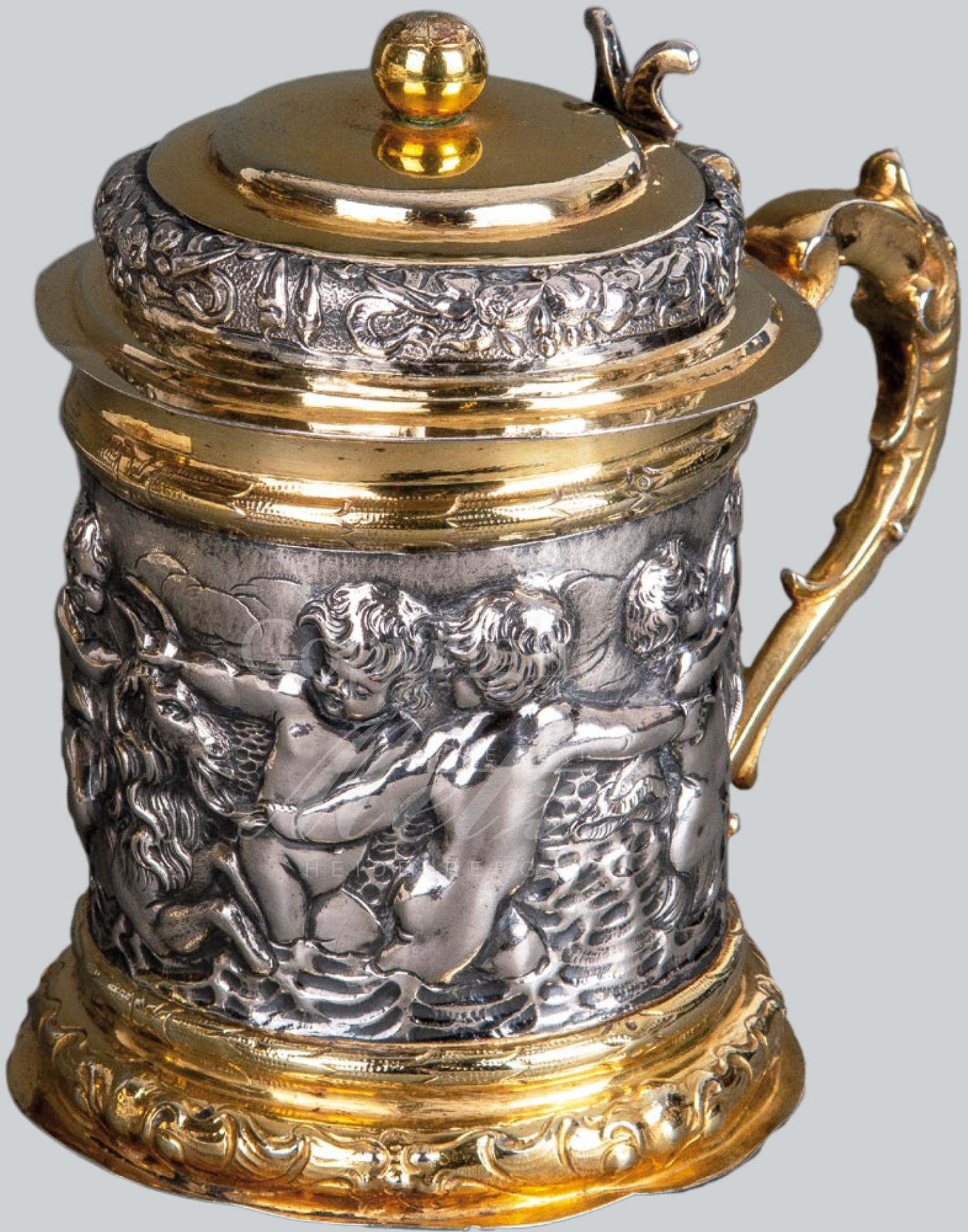
Silberhumpen, Augsburg 1650 Meister Isaac Lotter