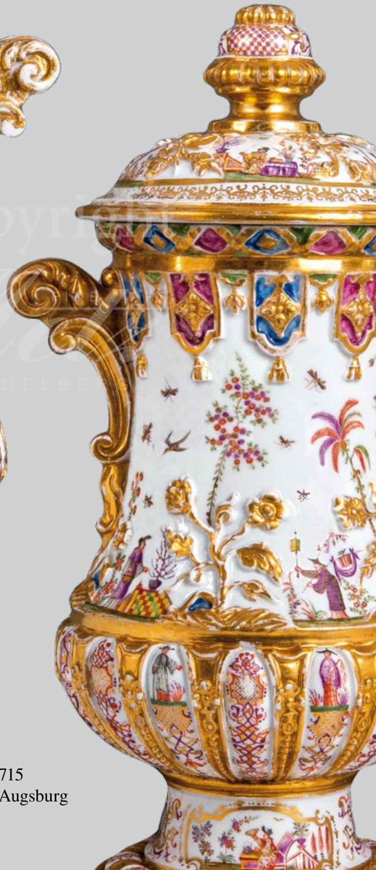
Zwei bedeutende Vasen, Meissen 1715 Malerei aus der Werkstatt Auffenwerth, Augsburg