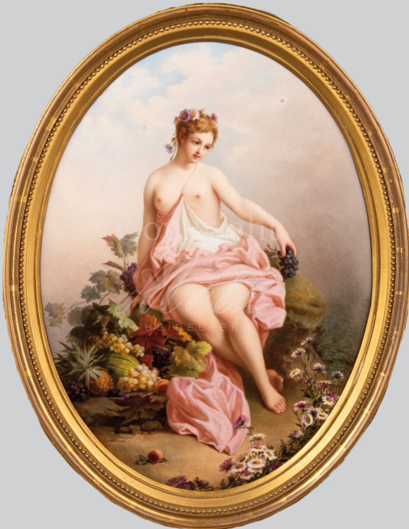
Prunkplakette „Der Sommer“ Meissen 19. Jh.