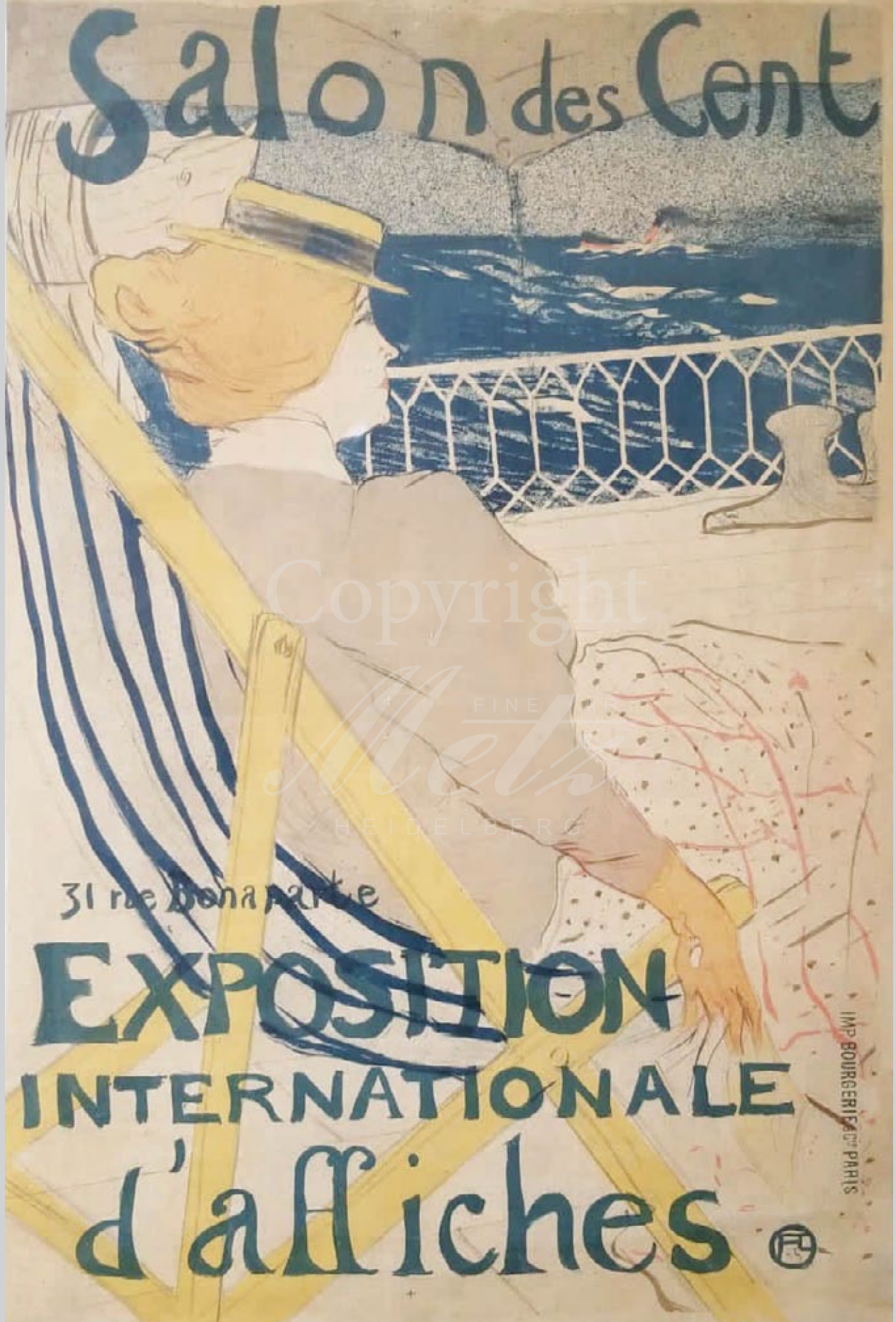
Henri de Toulouse-Lautrec (1864-1901) „Salon des Cent: Exposition Internationale d'affiches (1895)“, Druckgraphik