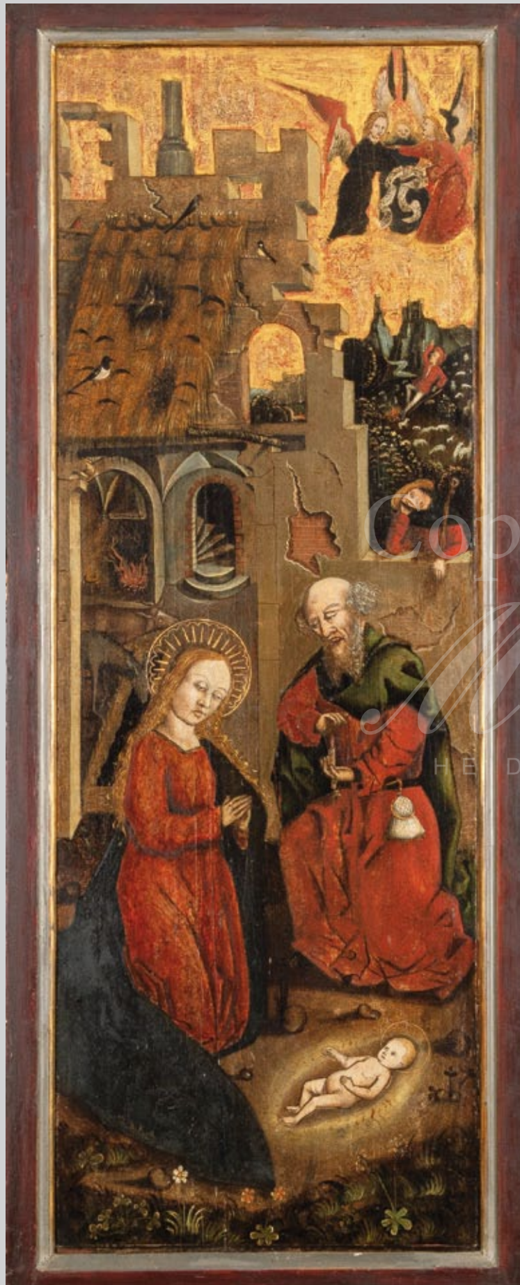
„Die Geburt Christi“