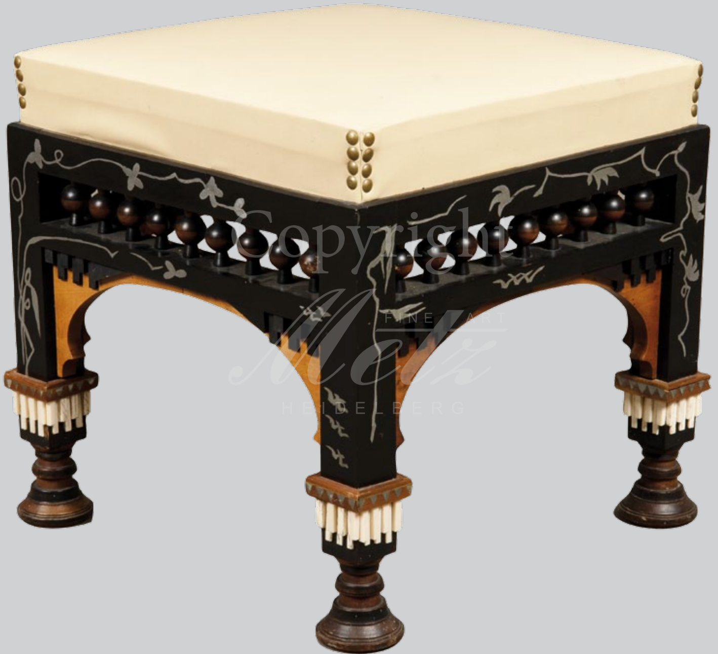
Hocker Carlo Bugatti (1856-1940)