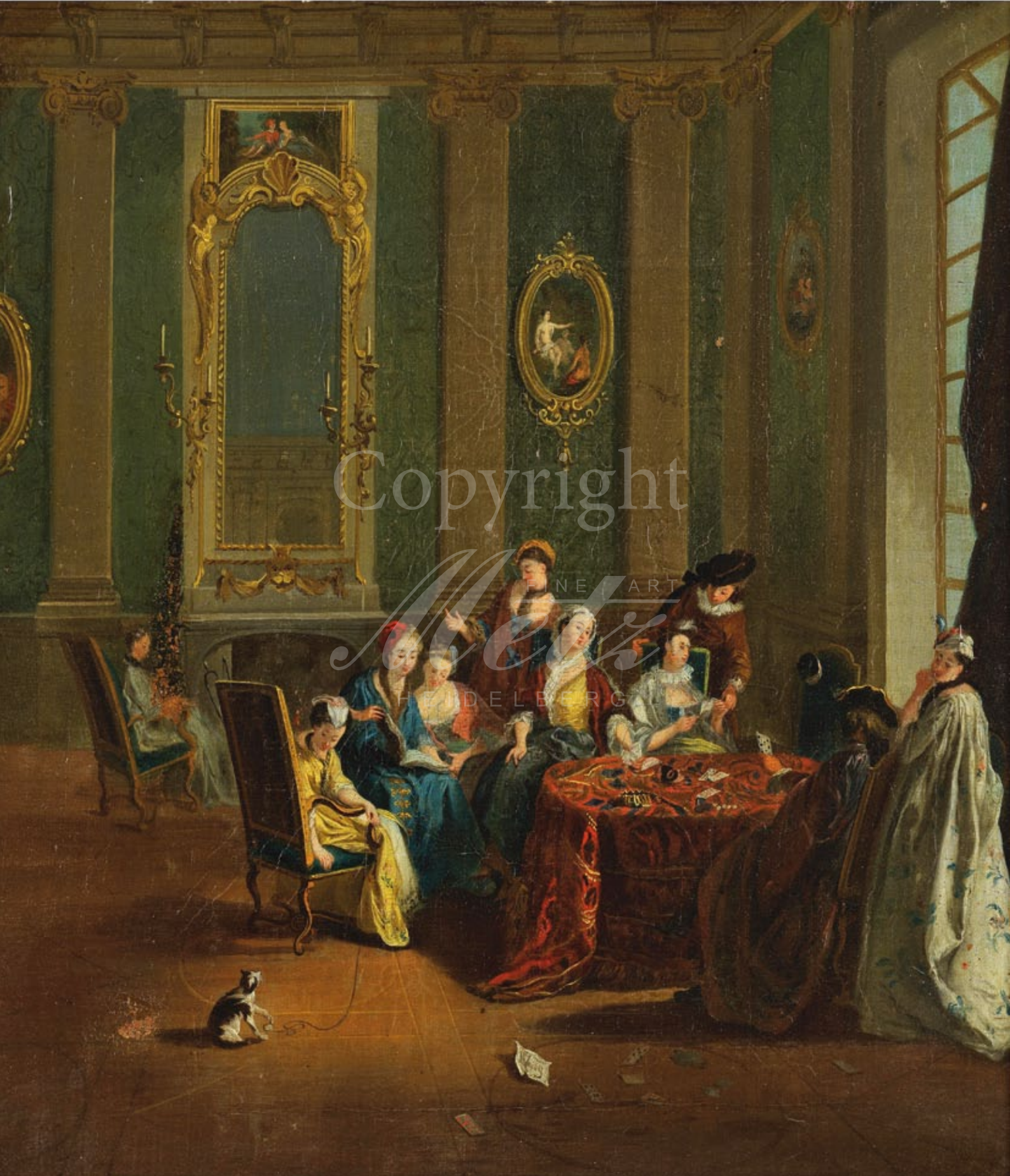
Nicolas Lancret (1690-1743) attrib., „Der Winter“ Öl/Lw., gerahmt