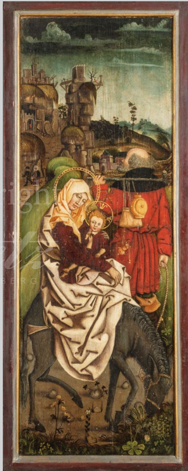
„Die Flucht nach Ägypten“

Deutscher Meister der Spätgotik, Ende 15. Jh., ein Paar bedeutende Altarflügel mit weihnachtlichen Szenen, Öl/Holz, parkettiert und gerahmt