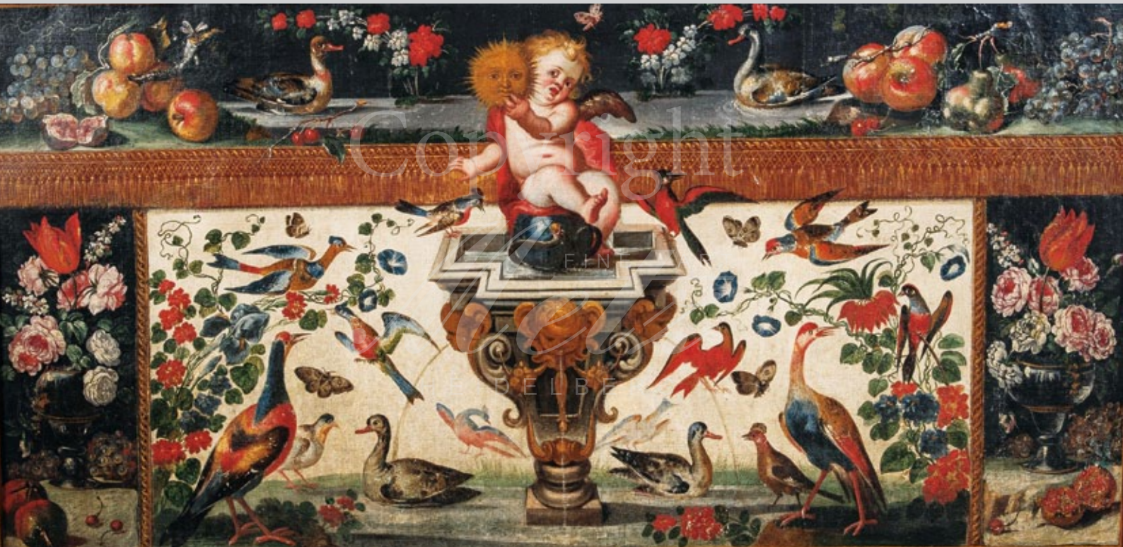
Französischer Meister des 18. Jhs. Allegorie auf den Dauphin von Frankreich. Öl/Lw., verso ligiert monogr. „AO“, dat. 1706