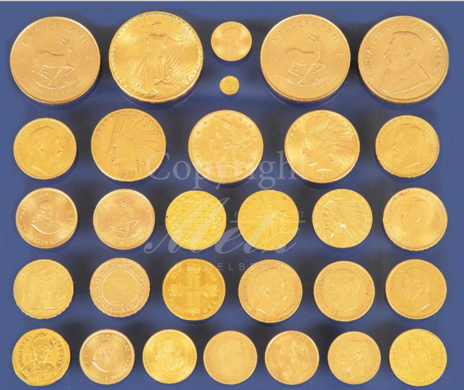
Sammlung von Goldmünzen