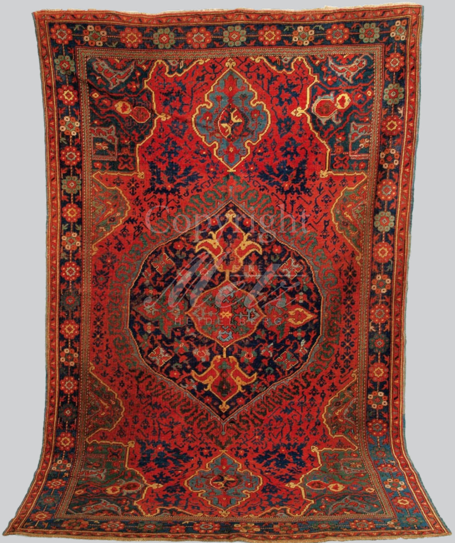
Medaillon-Ushak, Westanatolien 18. Jh.