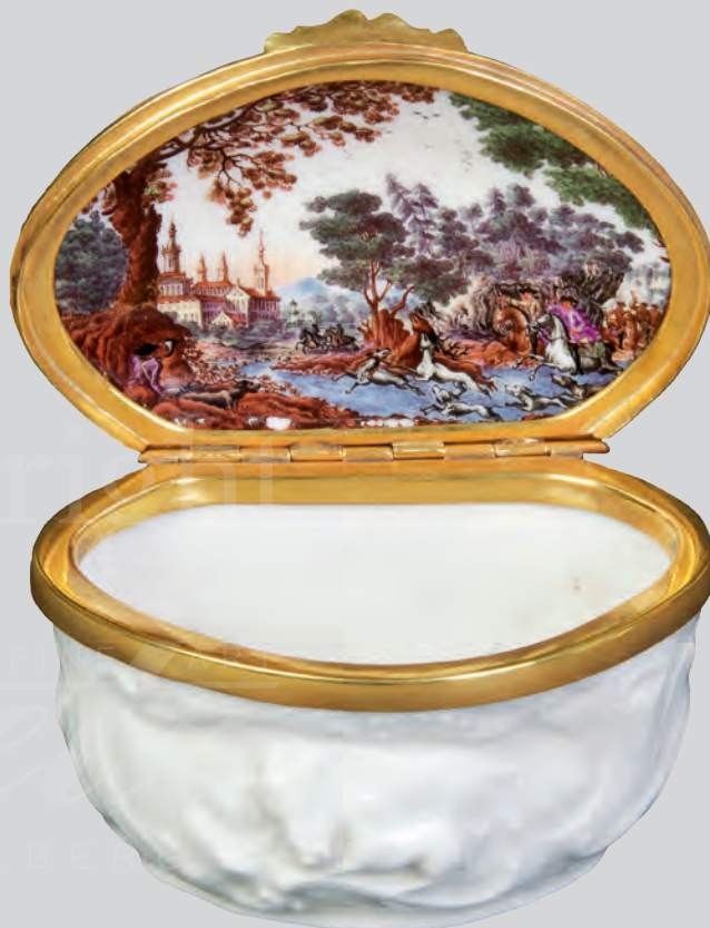
Jagdtabatière Meissen 1737-40 Modell von Johann Joachim Kaendler