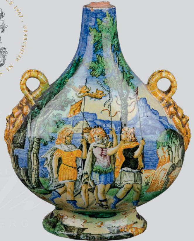
Pilgerflasche Urbino 16. Jh.,