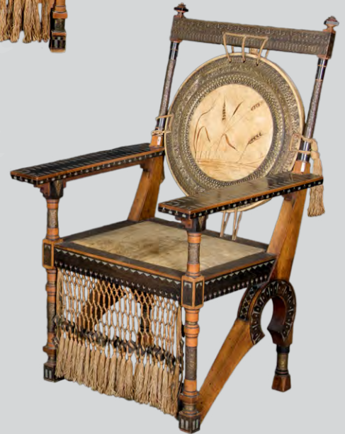
Carlo Bugatti (1856-1940), sechsteilige Garnitur, Nussbaumgestell mit Messing- und Zinneinlagen, Schweinslederbezug mit Seidenquasten