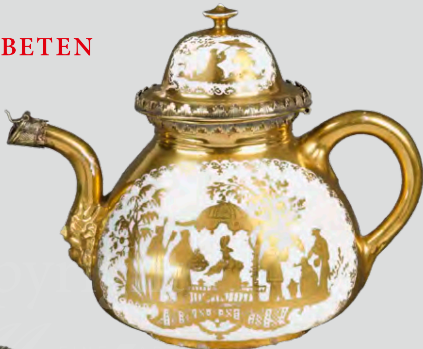
Teekanne , Meissen 1720, Malerei von Bartholomäus Seutter, H=13,2 cm