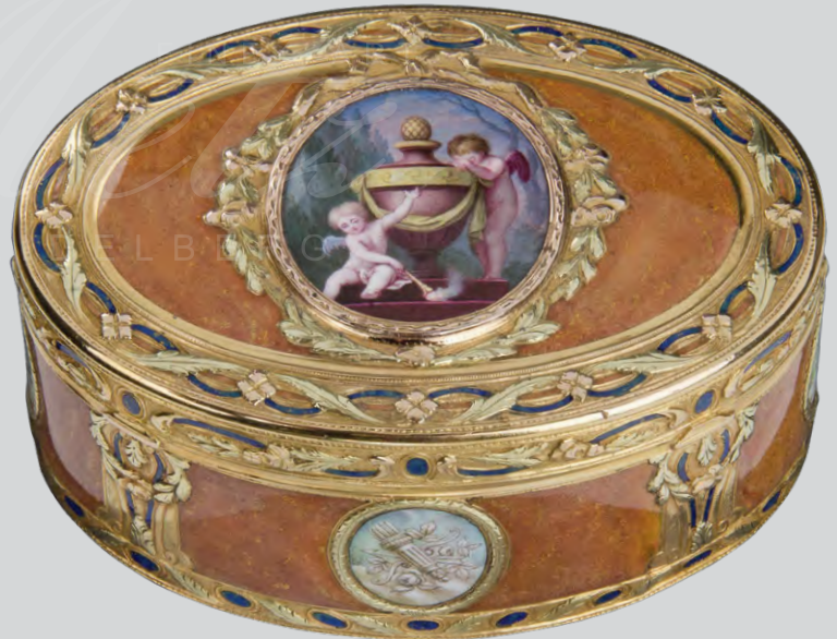
Gold-Tabatière Paris um 1775