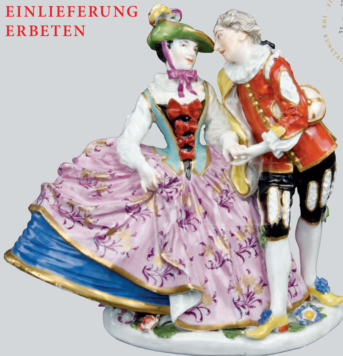
Spanisches Liebespaar Meissen 1740 Modell von Johann Joachim Kaendler