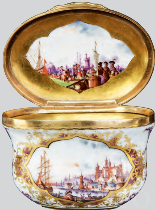
Tabatière Meissen 1730 Malerei von Christian Friedrich Herold