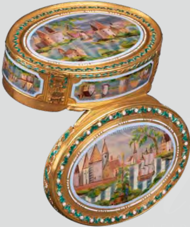
Gold-Tabatière Paris 1778, Meister N. Marguerit