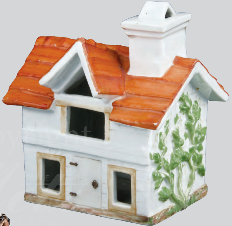
Bauernhaus für den Grafen von Brühl Meissen 1743-45 Modell von Johann Gottlieb Ehder