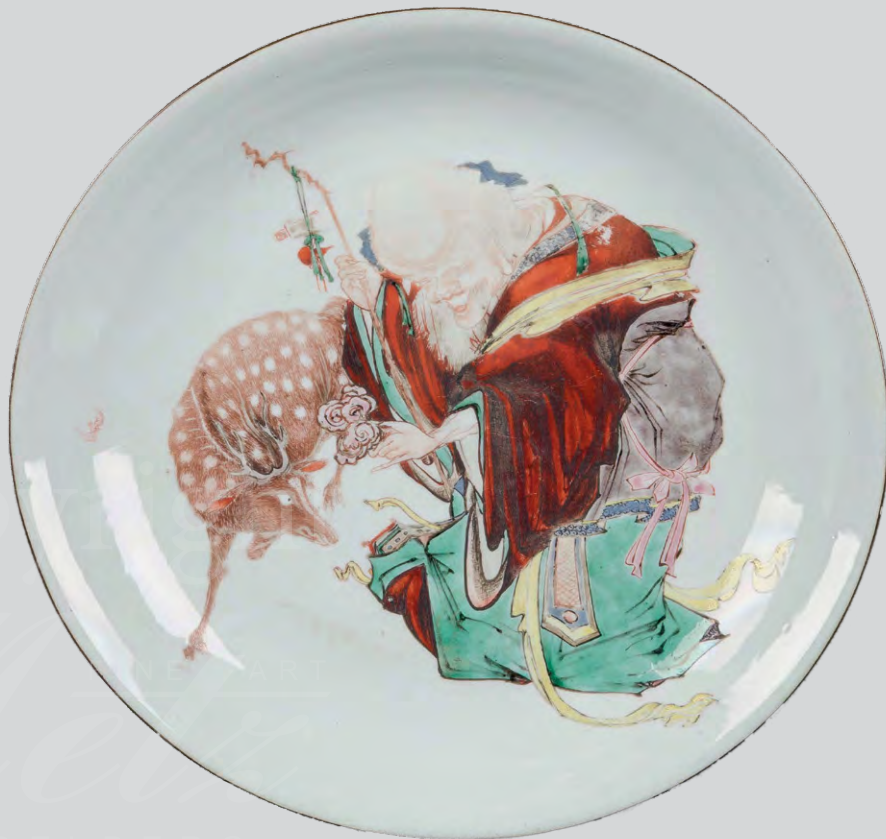
Schale China 1730-40,