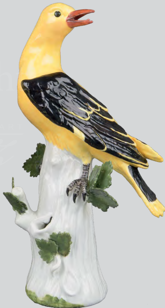
Paar Pirole, Meissen 1734, Modell J.J. Kaendler, ERGEBNIS: 51.240,- EURO