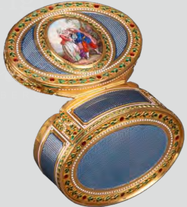
Gold-Tabatière Paris 1776, Meister J.-E. Blerzy