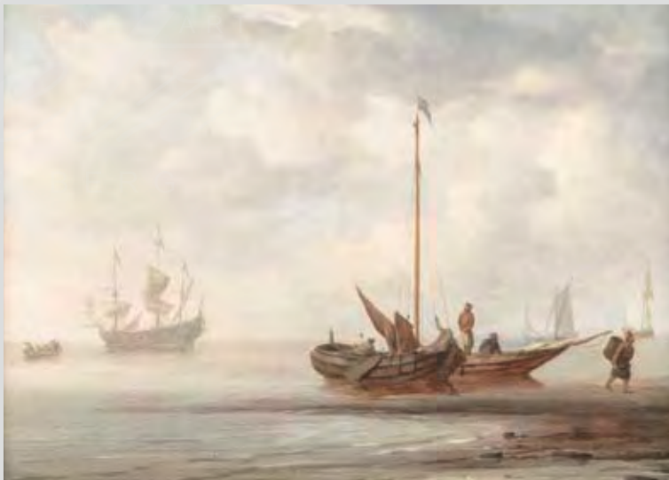
Willem II van de Velde (1633-1707) attrib. Öl/Holz, rechts unten ligiertes Monogramm, gerahmt, 25 x 33 cm