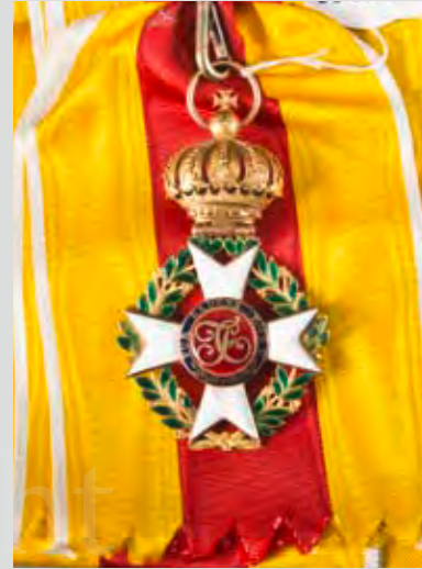
Großherzoglich Badischer Militärischer Karl Friedrich-Verdienst-Orden Großkreuz, 14 ct. Gold, ca. 43,5 g, an Schärpe