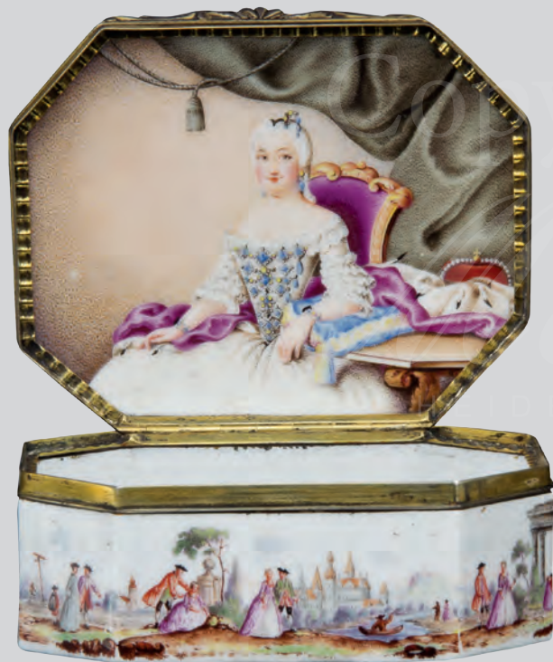
Tabatière Meissen 1740 Malerei von Johann Martin Heinrich ERGEBNIS: 16.000,- Euro