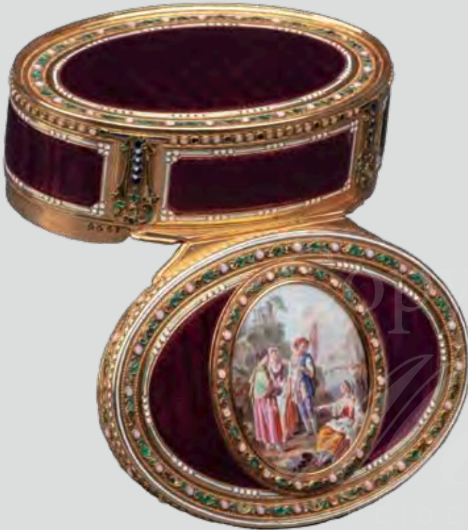
Gold-Tabatière Paris 1779, Meister J.-E. Blerzy