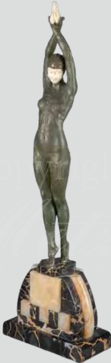
Demetre Chiparus (1886-1947)