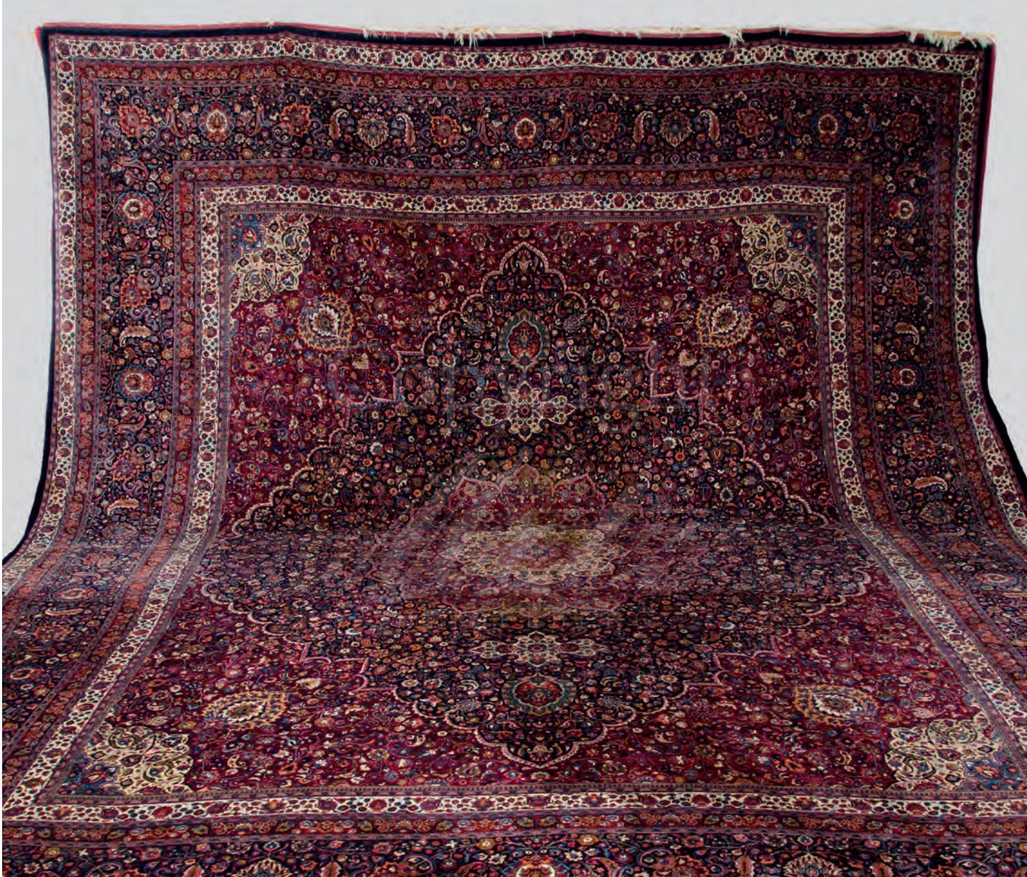
Prunk-Teppich Keshan um 1900 540 x 450 cm