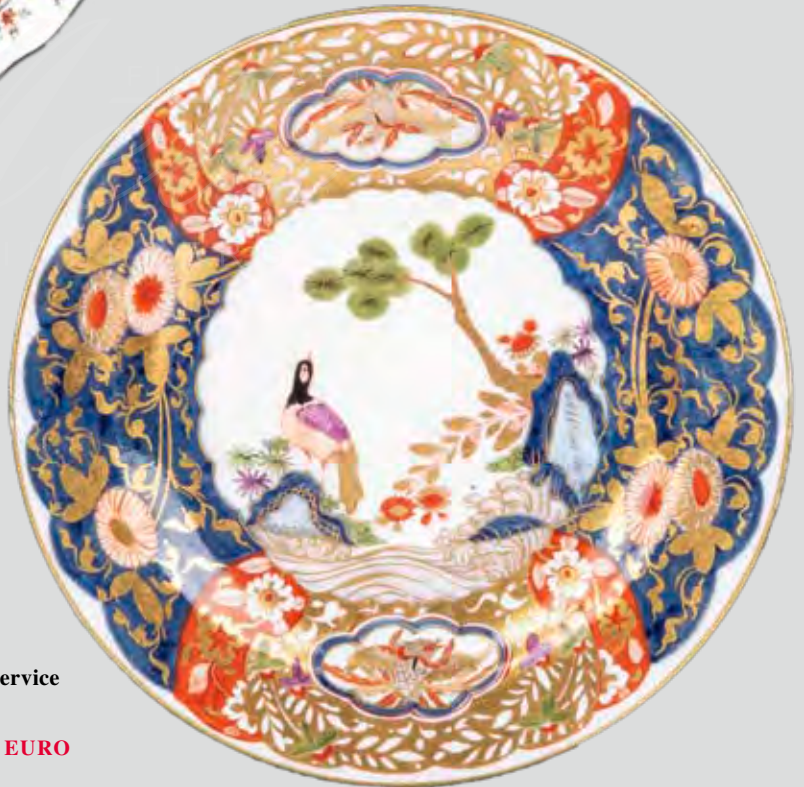
Teller aus dem Warschausevice Meissen 1740,