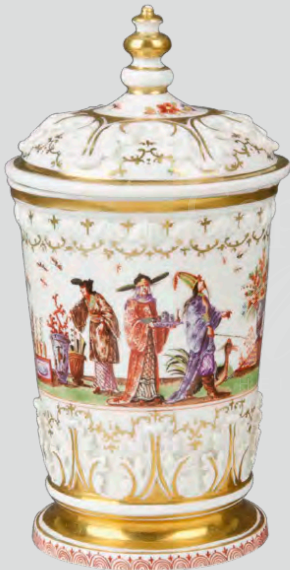
Deckelbecher , Meissen 1723-24, Malerei von Johann Gregorius Hoeroldt, H=17 cm