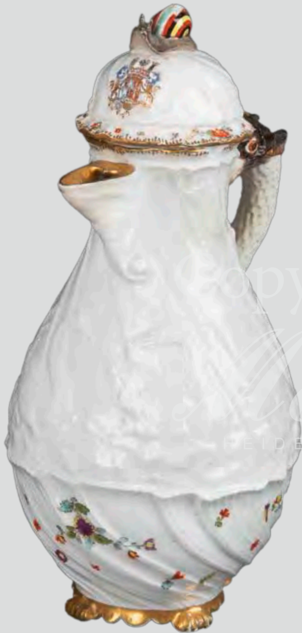
Kaffeekanne aus dem Schwanenservice Meissen 1739-41