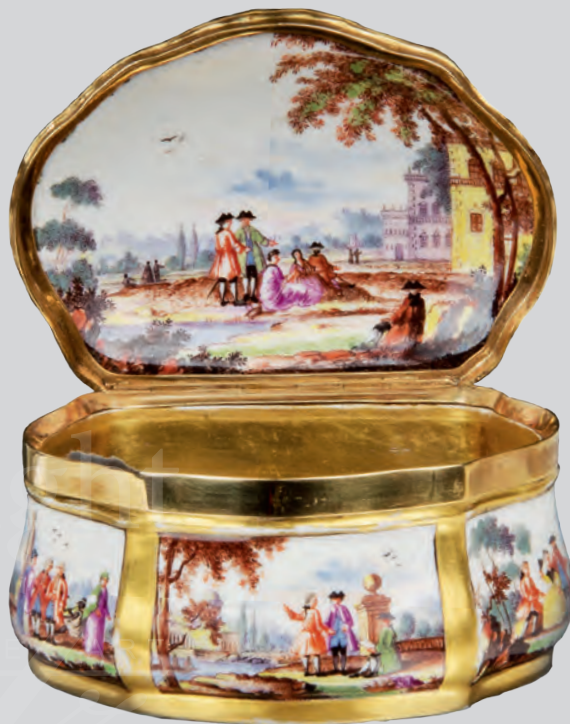
Tabatière Meissen 1740-45 Malerei von Johann George Heintze