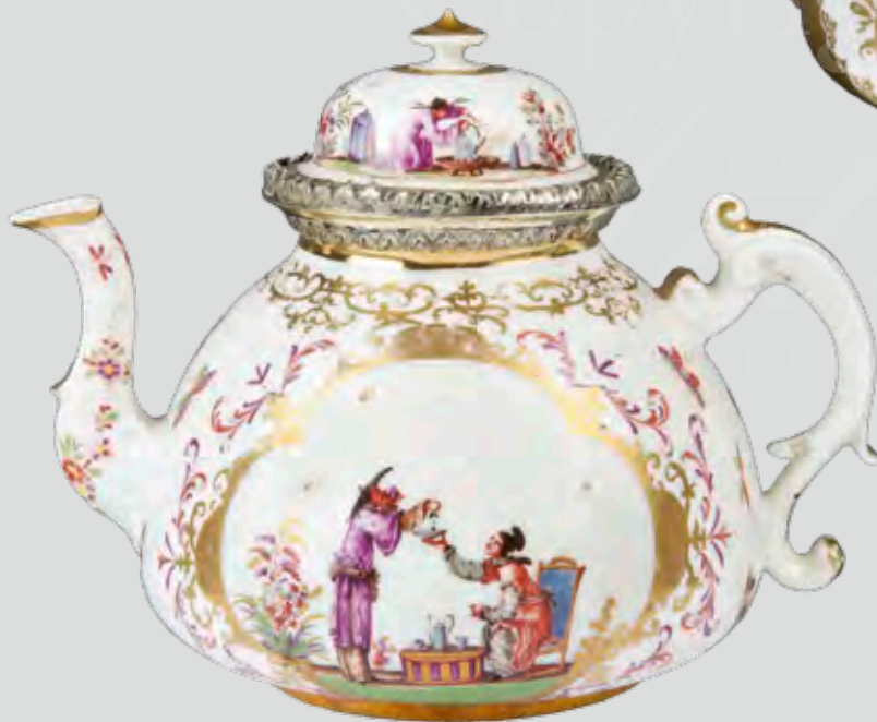
Teekanne , KPM-Meissen 1723-24, Malerei von Johann Gregorius Hoeroldt, H=12,6 cm