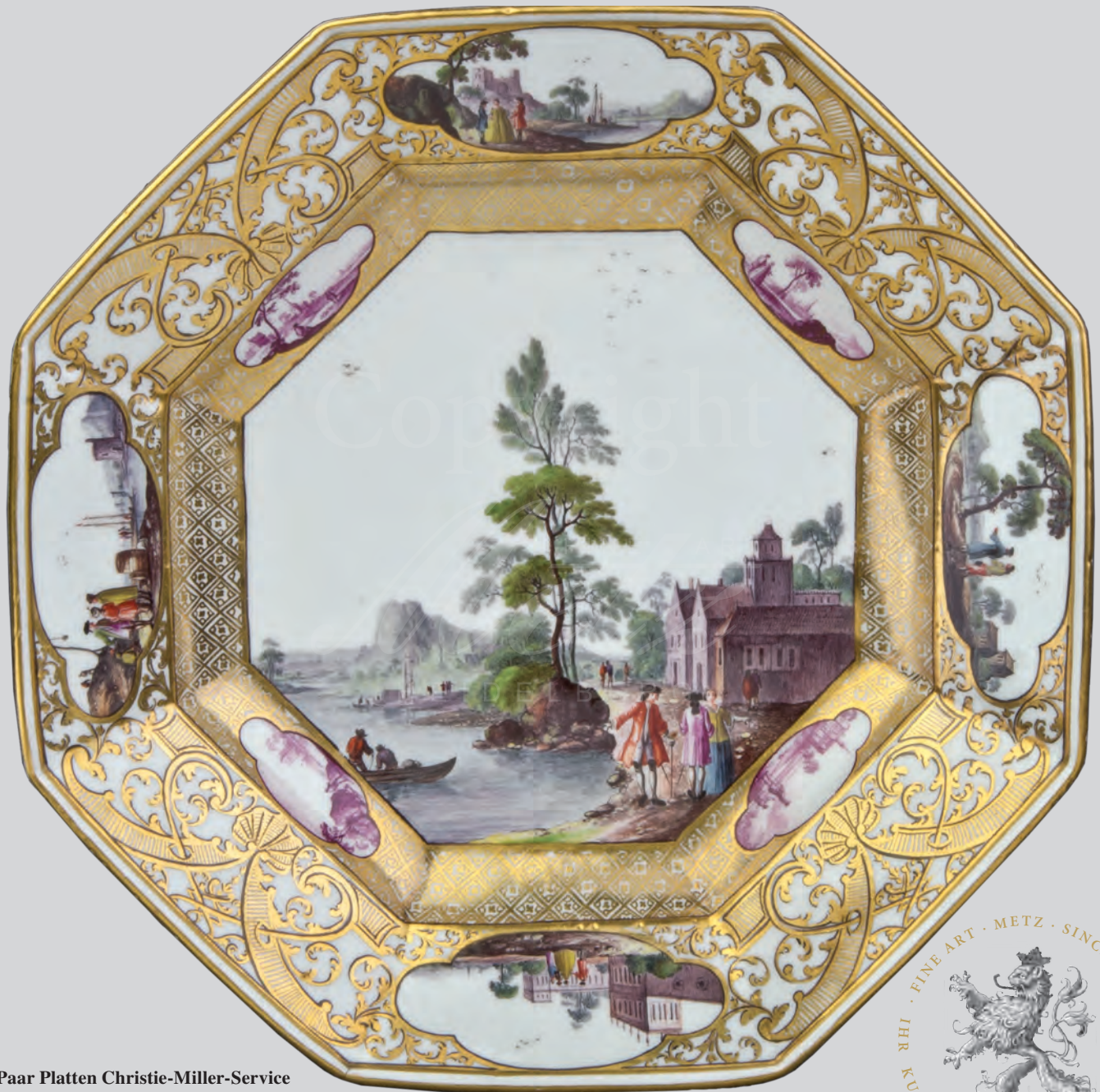
Paar Platten Christie-Miller-Service Meissen um 1740