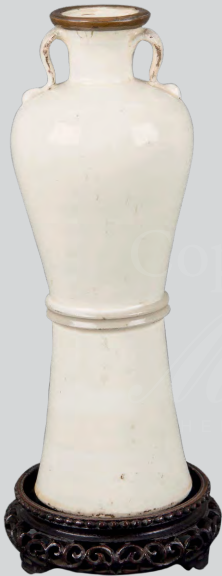
Cizhou-Doppelhenkelflasche China 1368-1644,