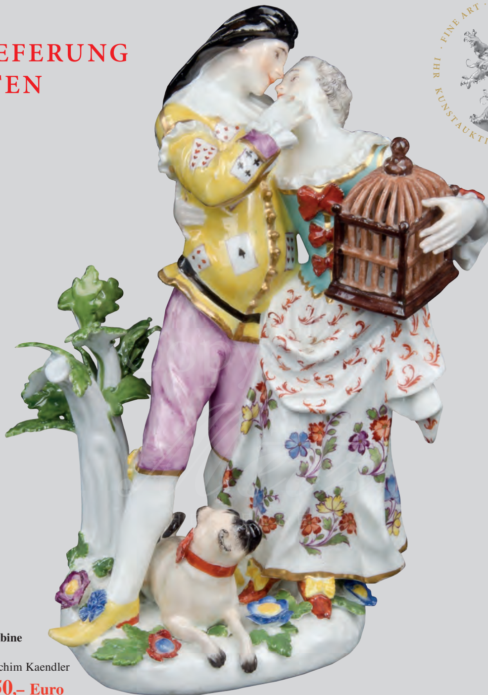
Skaramuz und Columbine Meissen 1740-45 Modell von Johann Joachim Kaendler