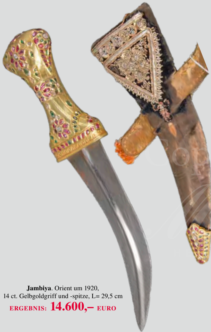
Jambiya. Orient um 1920, 14 ct. Gelbgoldgriff und -spitze, L= 29,5 cm