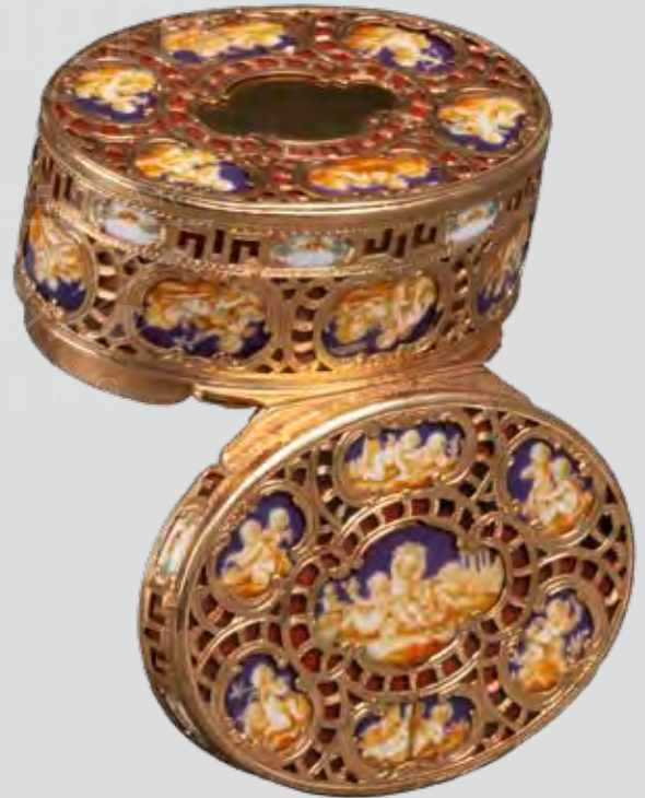
Gold-Tabatière Paris 1775, Malerei von J. G. Loehnig