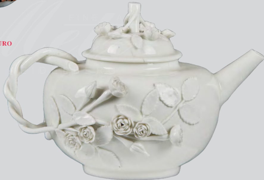
Teekanne Meissen 1710-15