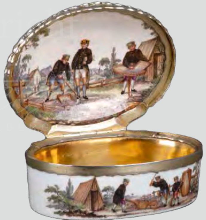
Porzellan-Tabatière Meissen 1765-70, Malerei von B. G. Häuer ERGEBNIS: 18.300,- EURO