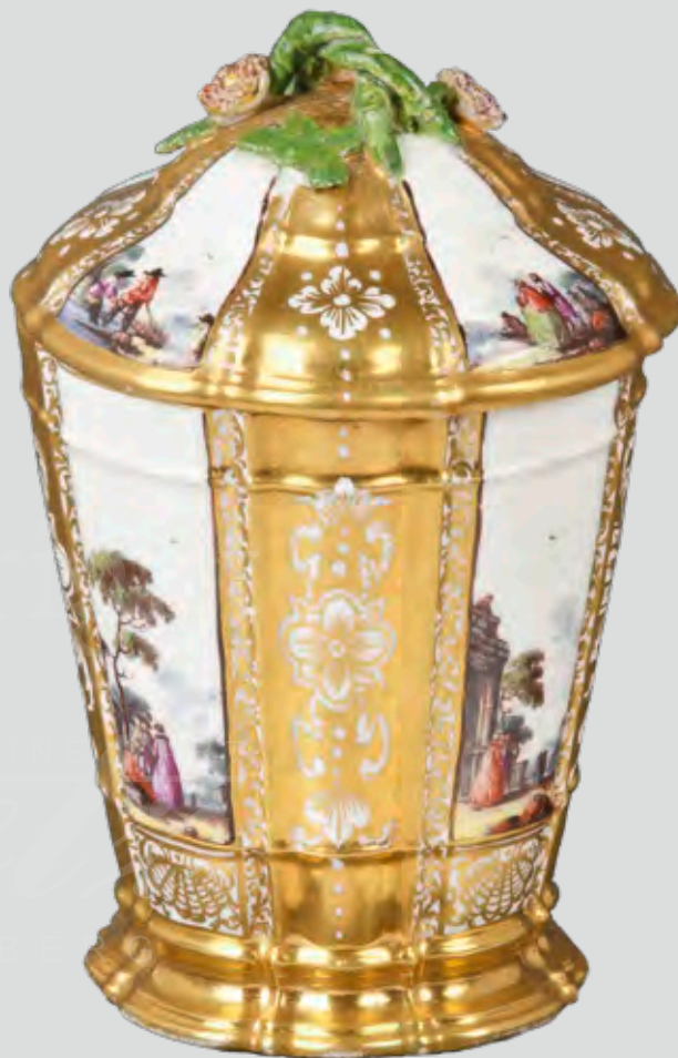
Deckelbecher , Meissen 1740-45, a. d. „Glücksburg-Toiletten-Service“, H=13,4 cm