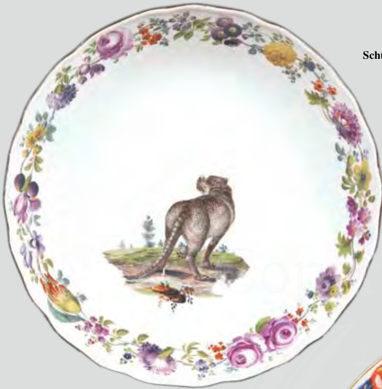
Schüssel aus dem Service Friedrich des Großen Meissen 1755,