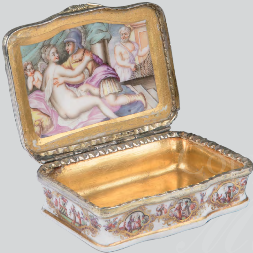
Tabatière Meissen 1727, Malerei P.E. Schindler, ERGEBNIS: 65.880,- EURO