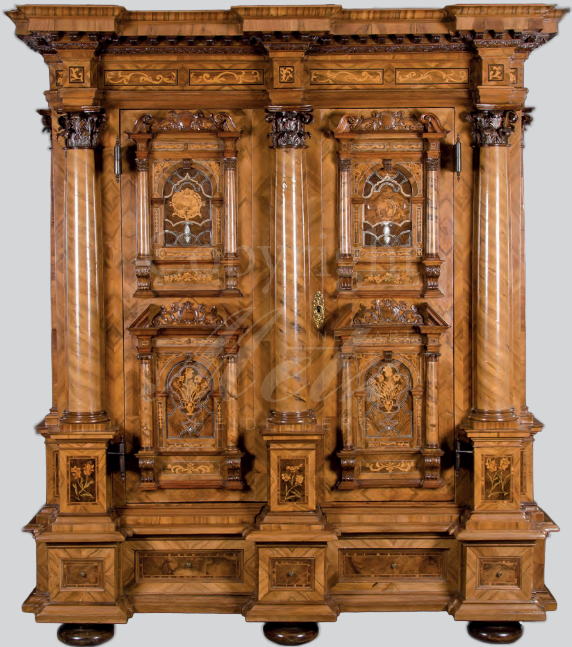
Barockschrank „Münchener Kleiderkasten“ um 1727