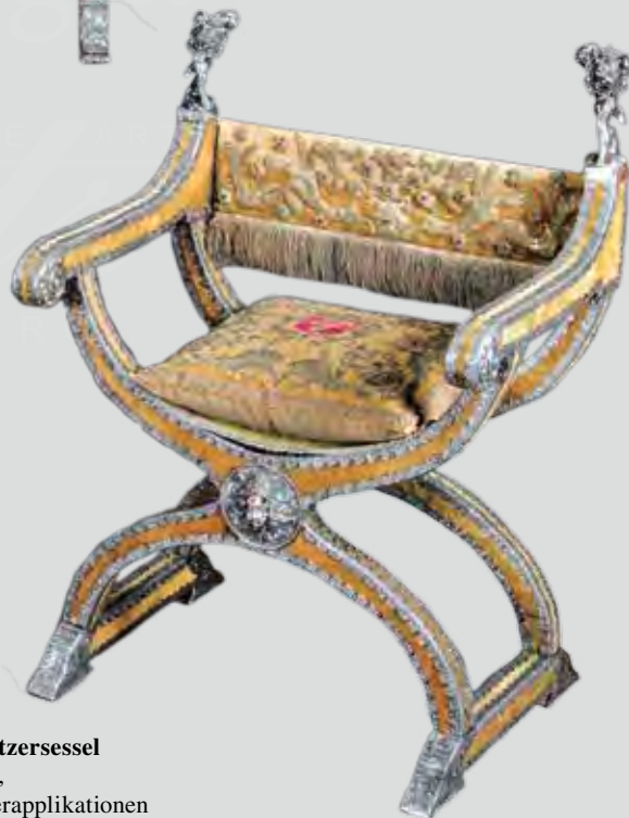
Thronsessel und Paar Beisitzersessel Augsburg um 1700, Samtbezug mit aufwändigen Silberapplikationen