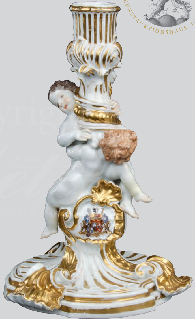
Paar Tafelleuchter aus dem Schwanenservice Meissen 1739