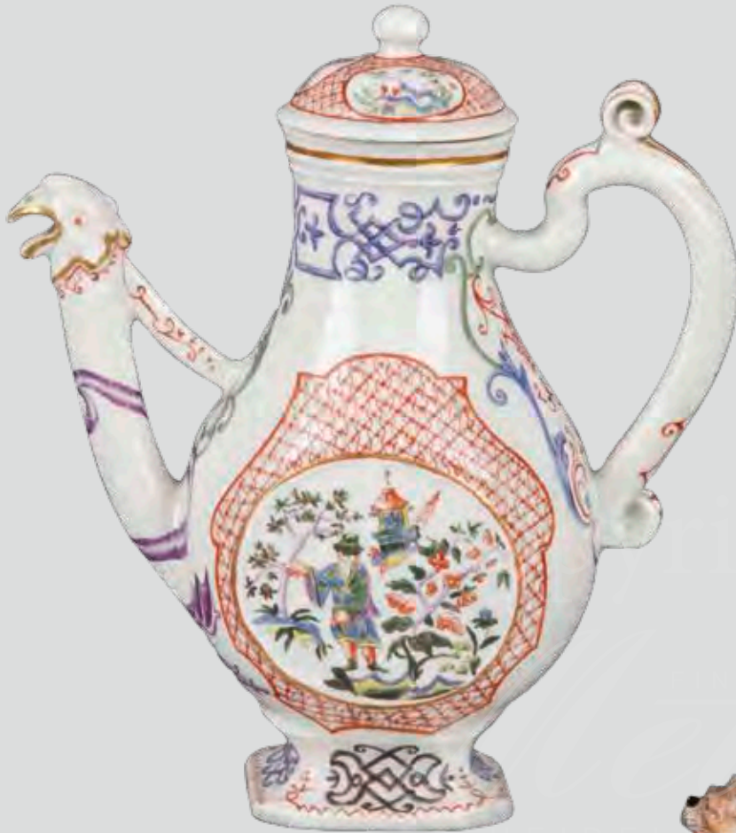
Kanne Wien, Du Paquier 1718-20