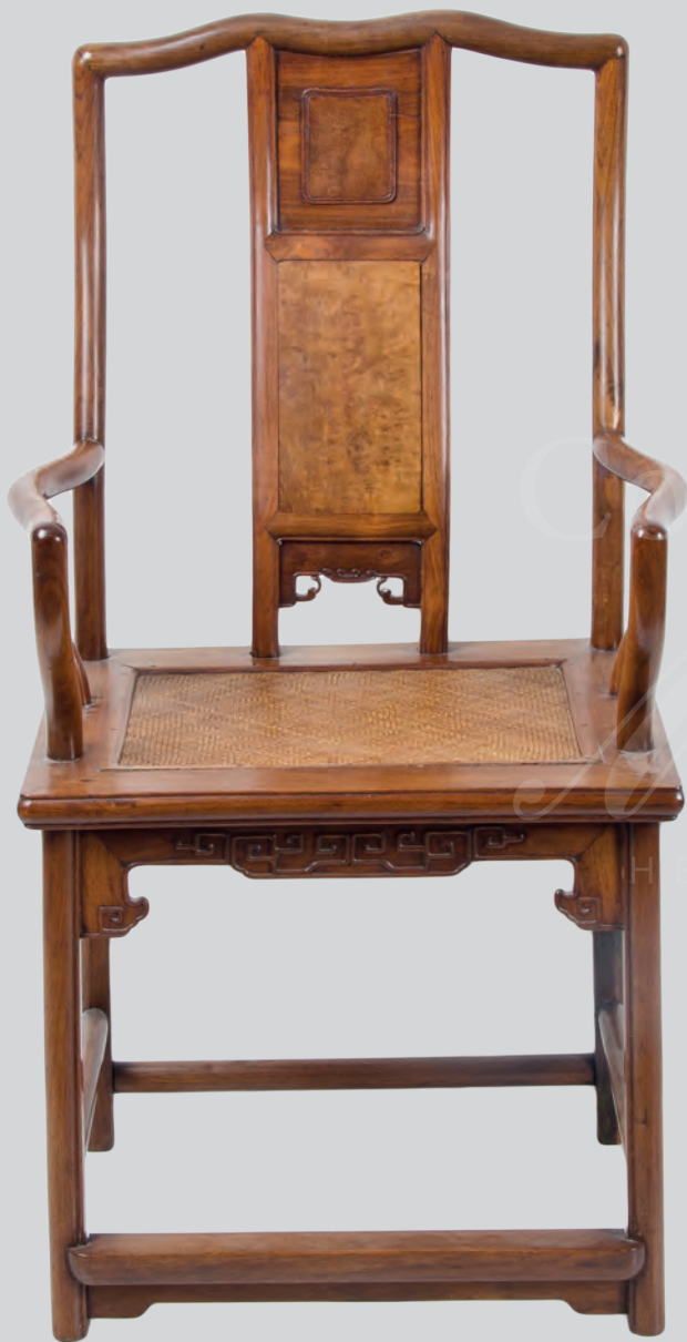
3 Beamtenhut-Armlehnstühle aus Huanghuali China 17. Jh.