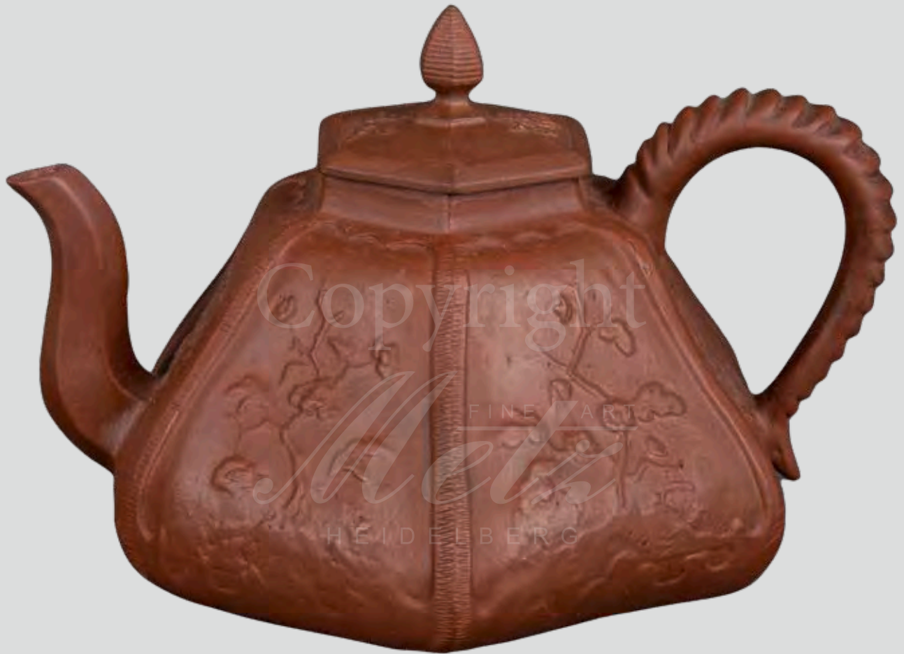
Böttgersteinzeug-Kanne Meissen 1710