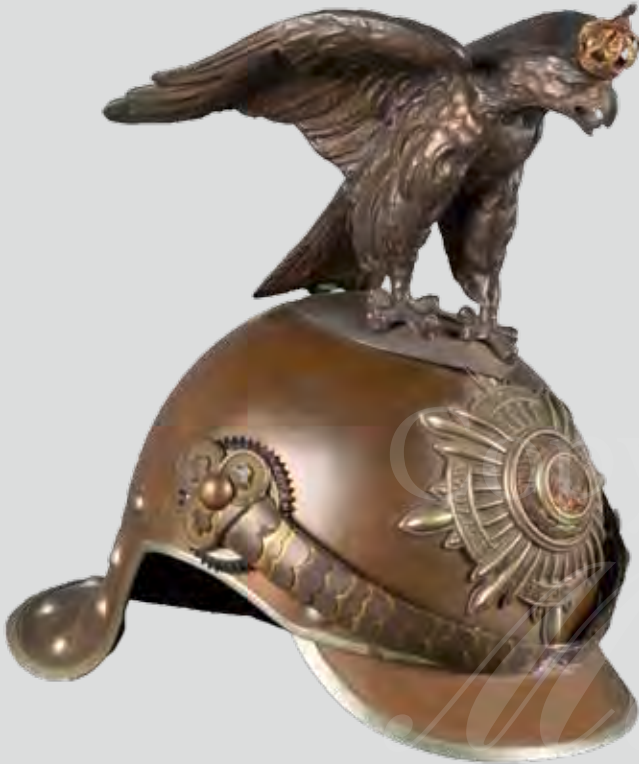
Garde du Corps-Helm Kürassier, Preussen