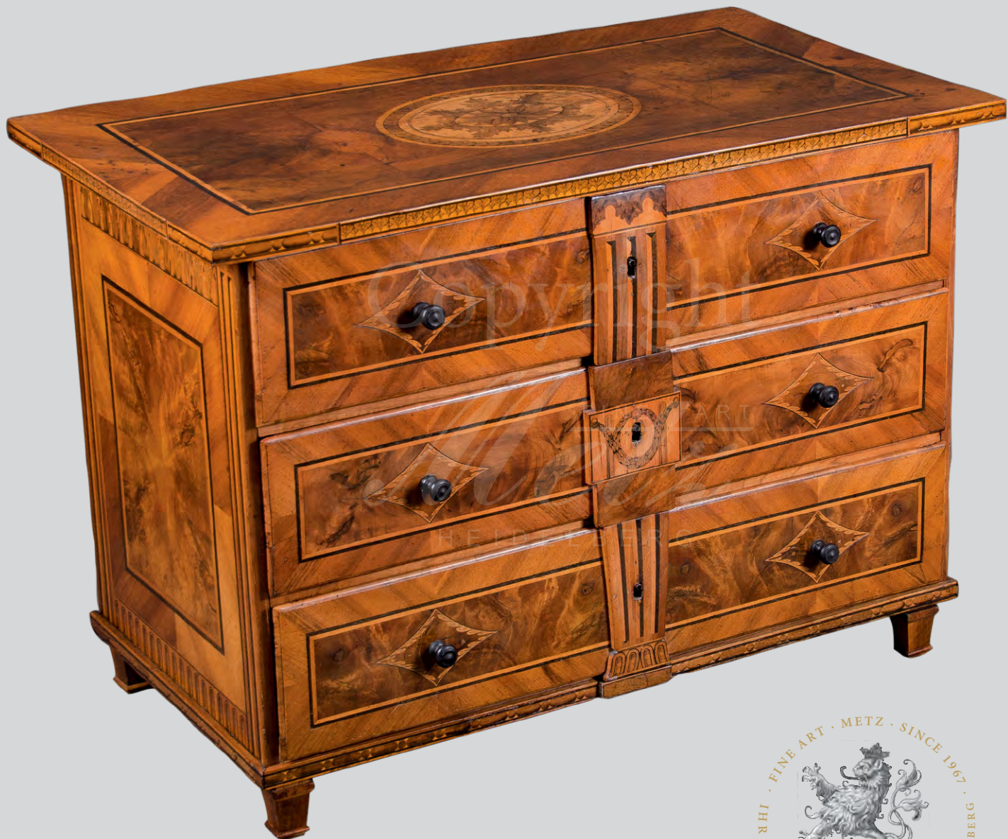
Kommode , Fulda um 1800, Hofschreiner der Fürstbischöfe Ignaz Arndt,