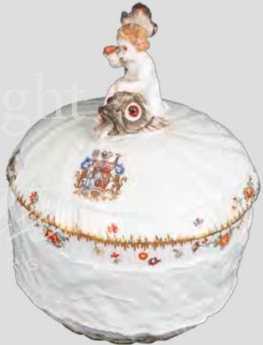
Zuckerdose aus dem Schwanenservice Meissen 1737-40