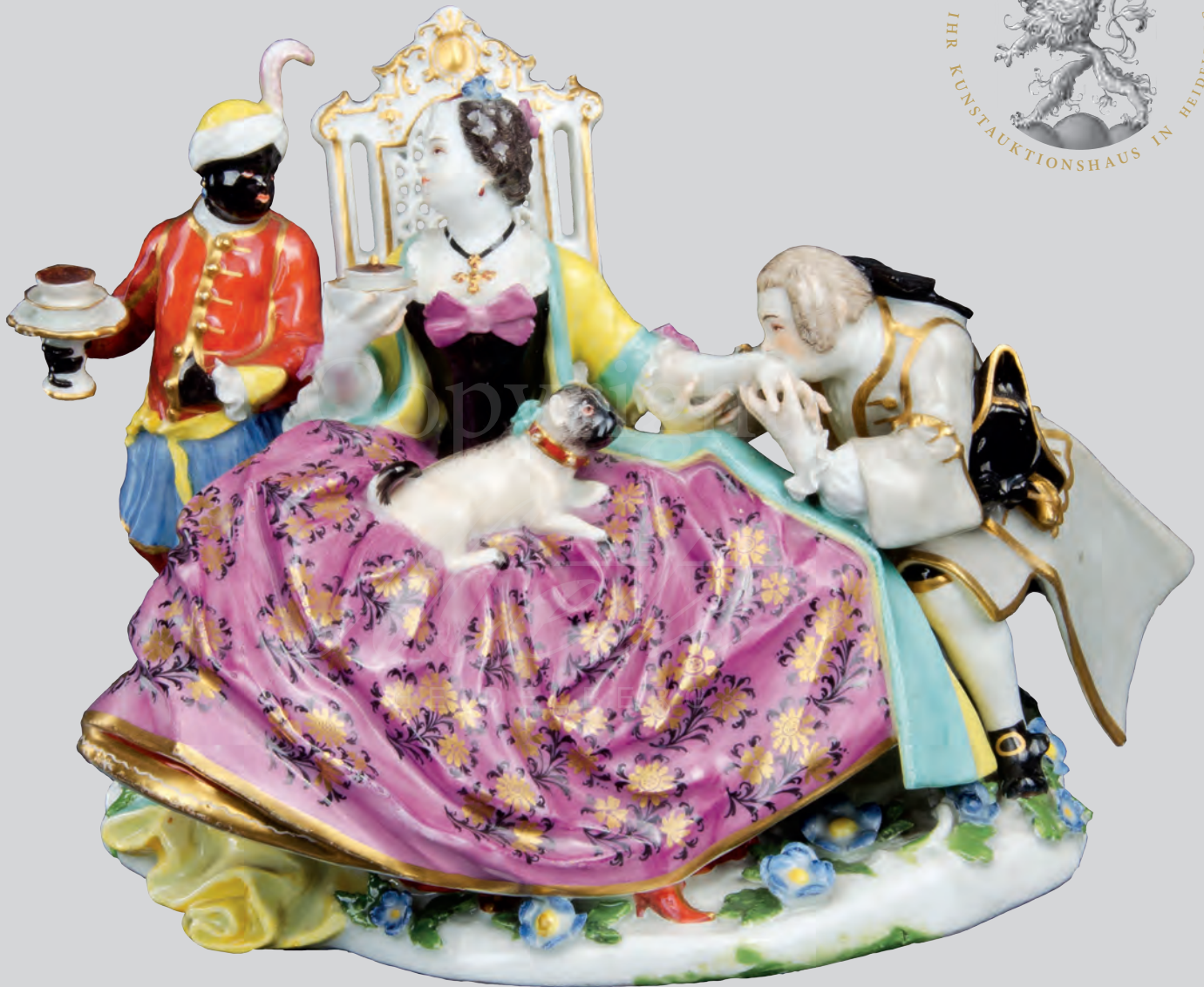
Der Handkuss mit Mohrendiener Meissen 1737 Modell von Johann Joachim Kaendler ERGEBNIS: 112.500,- EURO