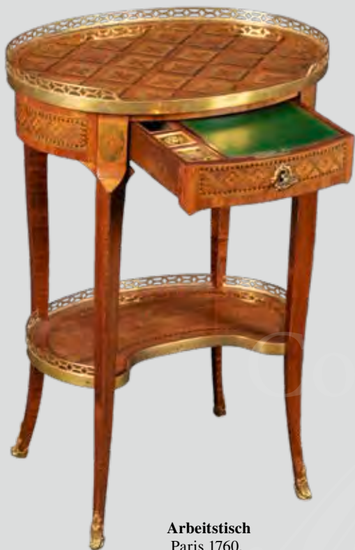
Arbeitstisch Paris 1760, Meister J.-P. Dusautoy