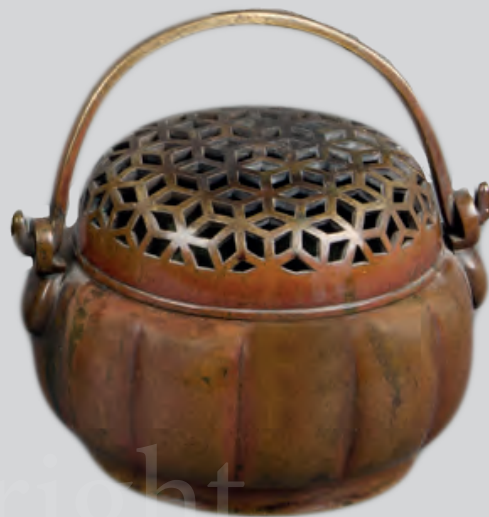
Räuchergefäß China 17. Jh. Bronze