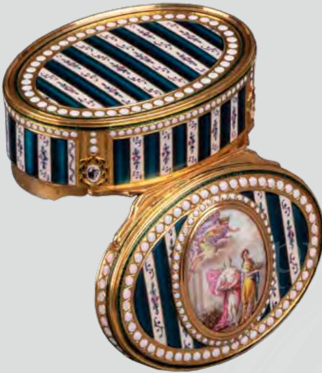
Gold-Tabatière Paris 1780