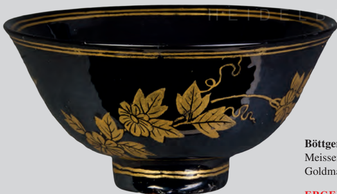
Böttgersteinzeug-Koppchen Meissen 1710 Goldmalerei von Martin Schnell