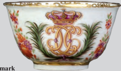
Koppchen mit Unterschale von König Christian VI. von Dänemark Meissen 1730-35