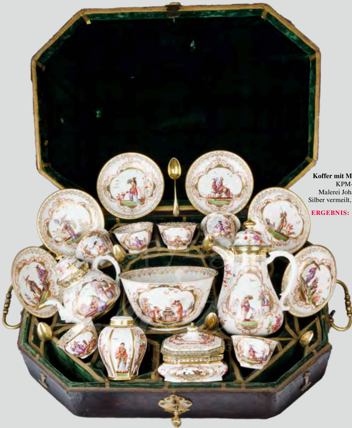
Koffer mit Meissner Porzellanservice, KPM-Meissen 1723-24, Malerei Johann Gregorius Hoeroldt, Silber vermeilt, Augsburg Meister E. Adam ERGEBNIS: 237.500,- EURO