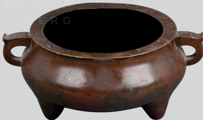
Doppelhenkelschale China 17. Jh. Bronze