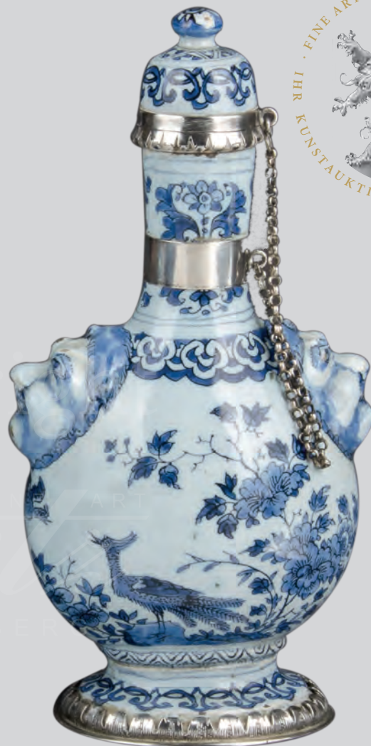
Paar Pilgerflaschen Delft, Samuel van Eenhoorn 1674-85 H=21,6 cm, H=21,4 cm