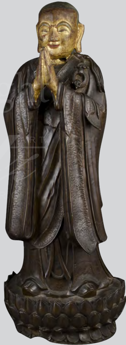
Paar stehend betende Buddhas auf Sockel. China 17 Jh. Bronze, fein ziseliert, teilw. vergoldet, H=70 cm.