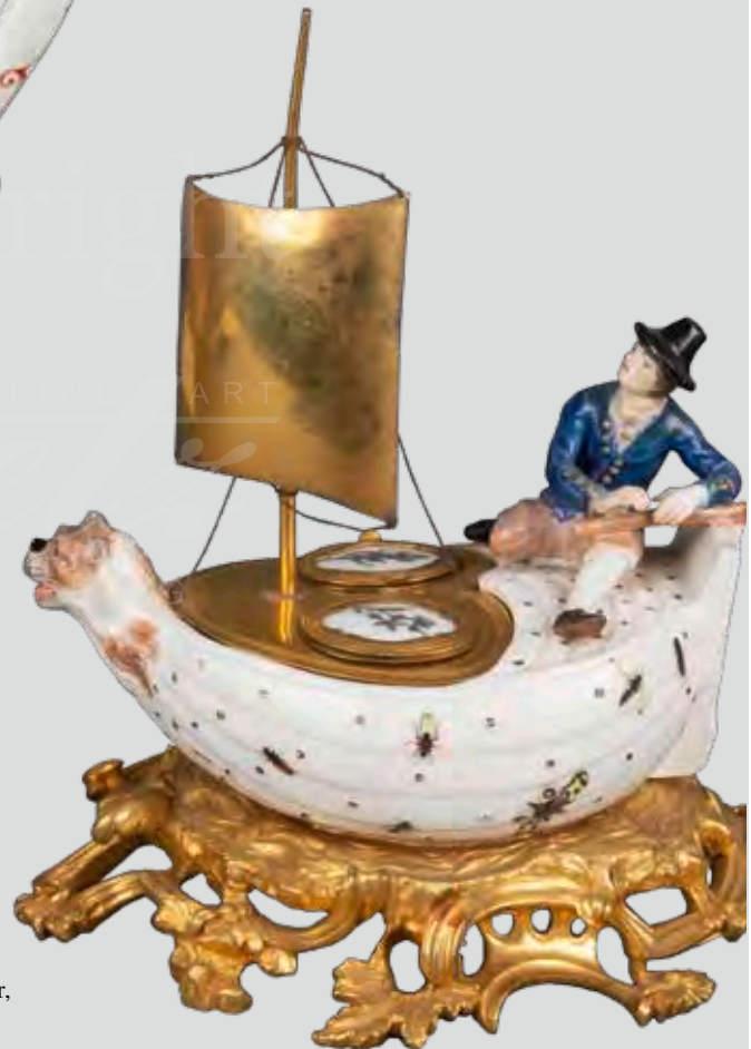
Gewürzbehälter Meissen 1740, Modell von J. F. Eberlein und J. G. Ehder,