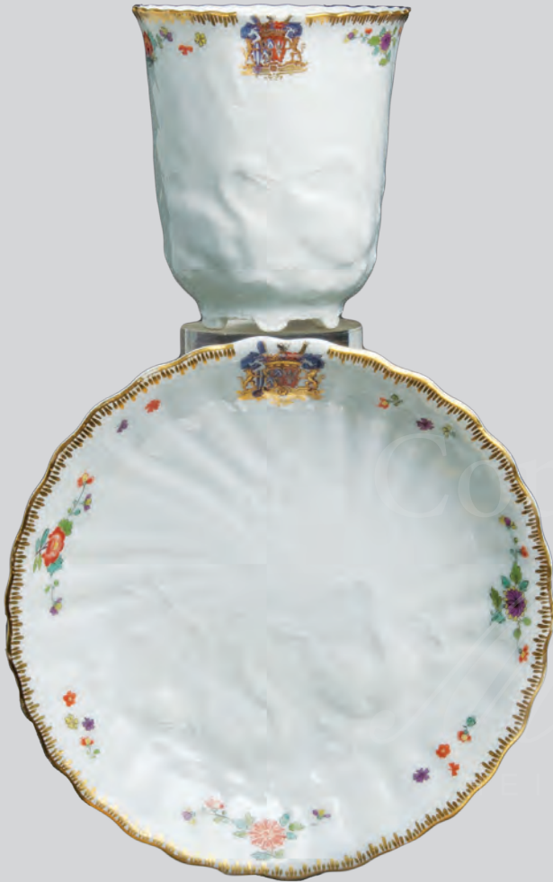
Schokoladenbecher mit Unterschale aus dem Schwanenservice Meissen 1739-40