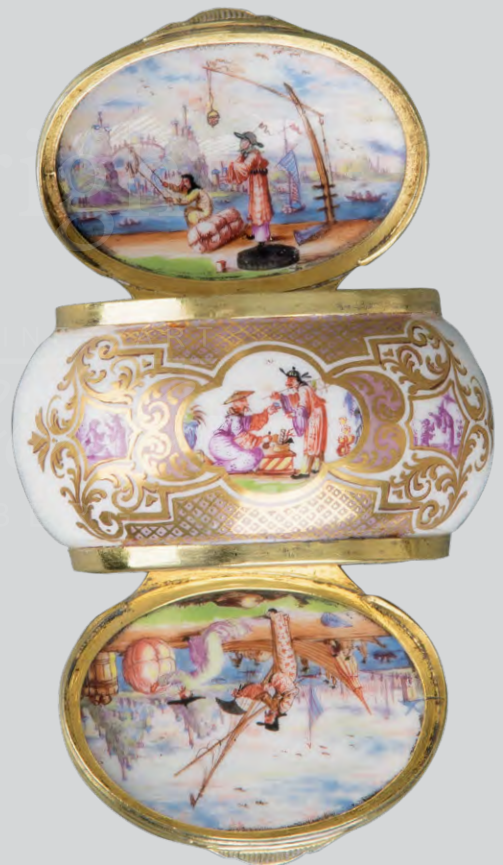
Doppeldeckel-Tabatière Meissen 1723-24, Malerei J. G. Hoeroldt, ERGEBNIS: 37.820,- EURO