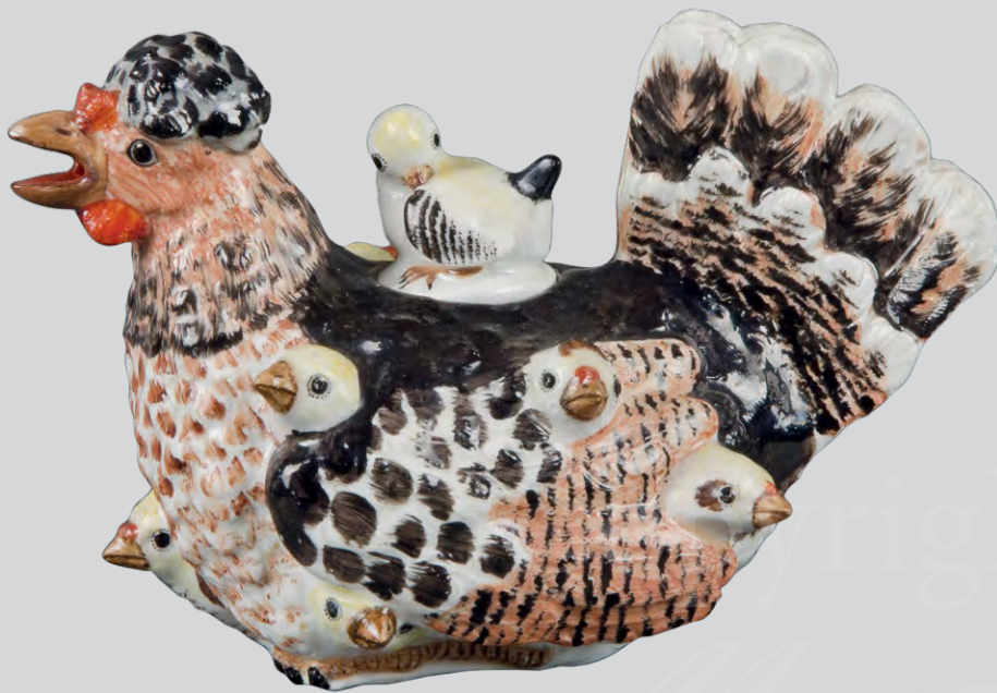
Hennenkanne Meissen 1734