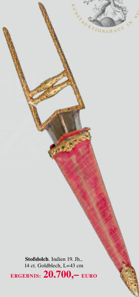
Stoßdolch. Indien 19. Jh., 14 ct. Goldblech, L=43 cm