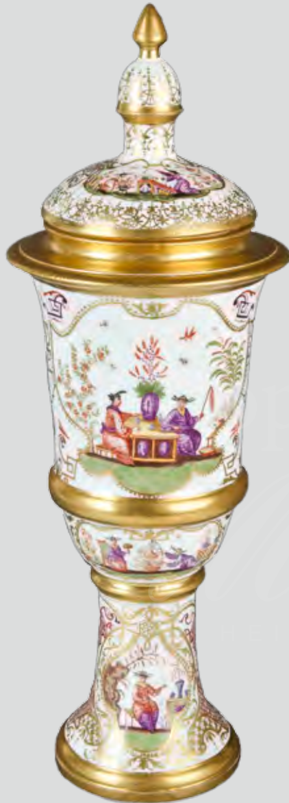
Prunkpokal , Meissen 1720, Malerei von J. Auffenwerth, H=40 cm