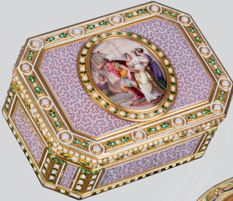
Gold-Tabatière, Paris 1781, Meister J.-E. Blerzy