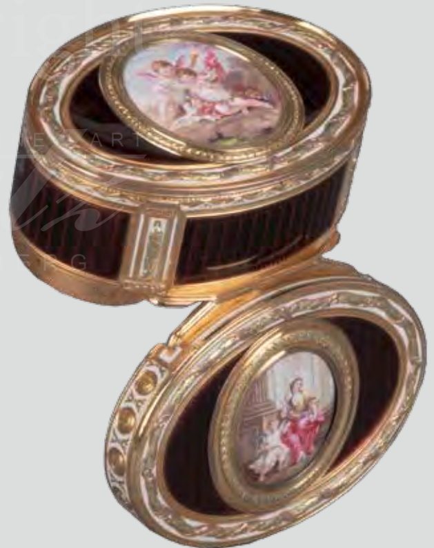
Gold-Tabatière Paris 1770, Meister J.-E. Blerzy