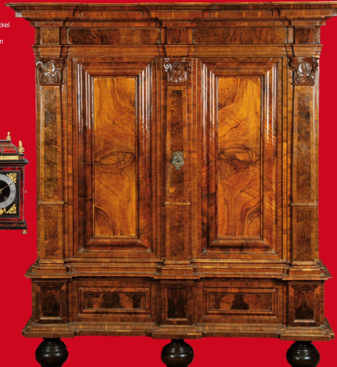
Pilasterschrank, Frankfurt 1700, Nussbaumwurzel querfurniert 232 x 215 x 86 cm