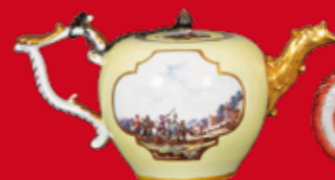
Meissen 1735 H=10 cm