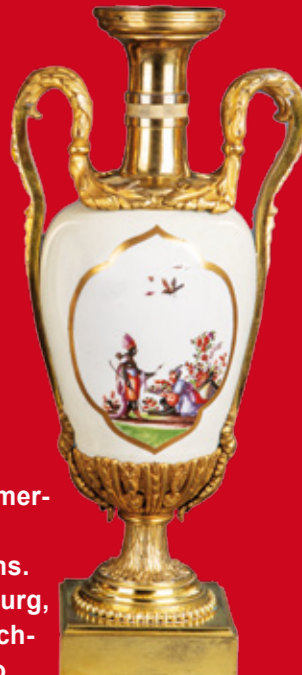
Meissen 1725-30 H=49 cm

Versteigert werden meistbietend Kunstobjekte des 15. bis 21. Jhs. Afrikana, Asiatika, Bücher, Bronzen, Fayencen, Gemälde, Glas, Graphik, Kunstkam- merobjekte, Militaria, Miniaturen, Möbel, Schmuck, Taschen- und Armbanduhren, Puppen, Silber, Spiegel, Spielzeug, Sammlung von Porzellanen des 18. bis 20. Jhs. (u.a. Berlin, Bing & Grøndahl, Frankenthal, Fürstenberg, Herend, Höchst, Ludwigsburg, Meissen, Nymphenburg, Royal Copenhagen, Rosenthal u. Volkstedt), Stand-, Tisch- u. Wanduhren, Decken-, Tisch- u. Wandlampen, Tabatièren, Teppiche, Art Déco, Jugendstil, 50er Jahre, Designermöbel, Musikinstrumente, spannende und interessante Kuriositäten, Dekoratives und Gegenstände des täglichen Gebrauchs.