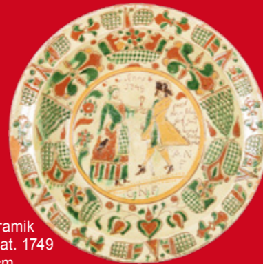
Bauernkeramik Hoerstgen, dat. 1749 D=49 cm