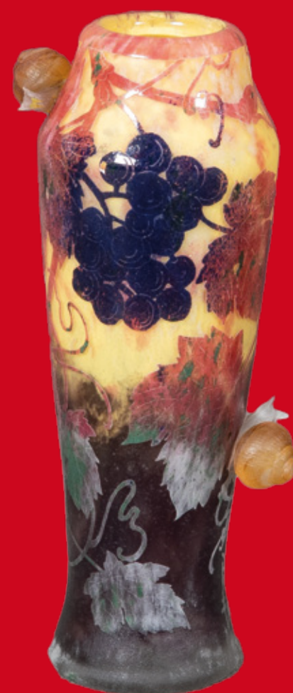
Art Déco-Vase Daum Frères & Cie, Nancy 1920 H=25,5 cm