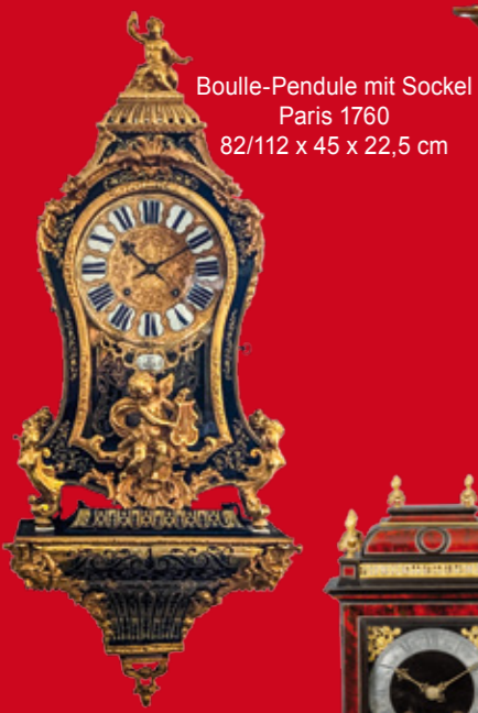
Boullée-Pendule mit Sockel Paris 1760 82/112 x 45 x 22,5 cm