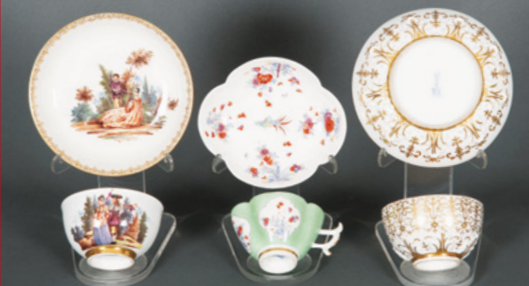
Meissen 1750 Meissen 1735 Meissen 1725