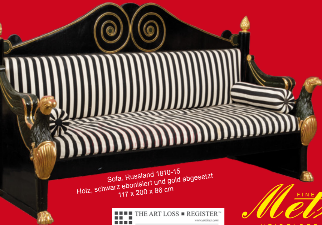
Sofa, Russland 1810-15 Holz, schwarz ebonisiert und gold abgesetzt 117 x 200 x 86 cm