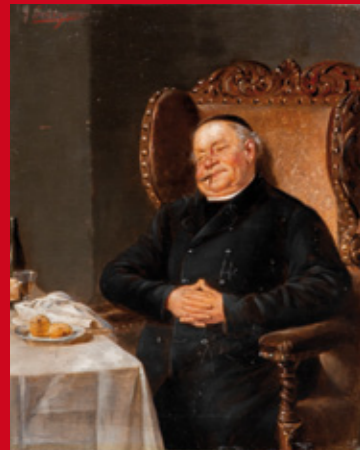
Eduard von Grützner (1846-1925) Öl/Holz, signiert 26 x 20,5 cm