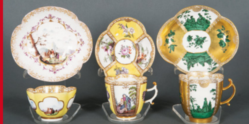
Meissen 1735 Meissen 1735 Meissen 1735