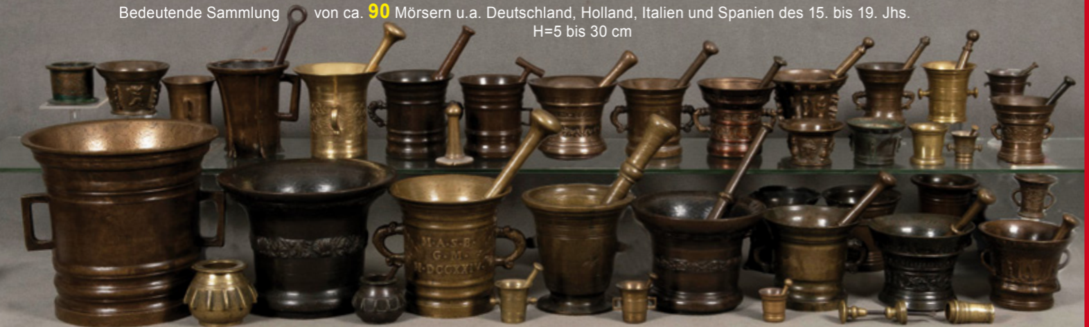
Bedeutende Sammlung von ca. 90 Mörsern u.a. Deutschland, Holland, Italien und Spanien des 15. bis 19. Jhs. H=5 bis 30 cm

B.D.K. Bundesverband deutscher Kunstversteigerer e.V.