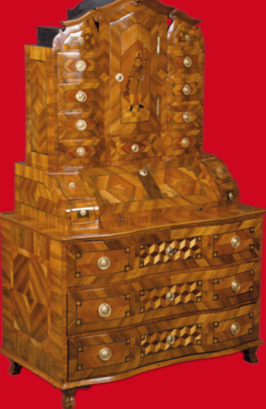
Tabernakel-Sekretär, Kurpfalz 1760-70 Nussbaumwurzel furniert und reich markiert 185 x 121 x 64 cm