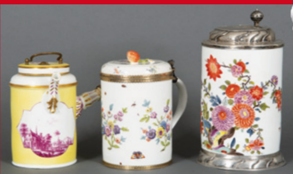
H=14,5 cm H=16 cm H=24 cm Meissen 1735 Meissen 1740 Meissen 1730