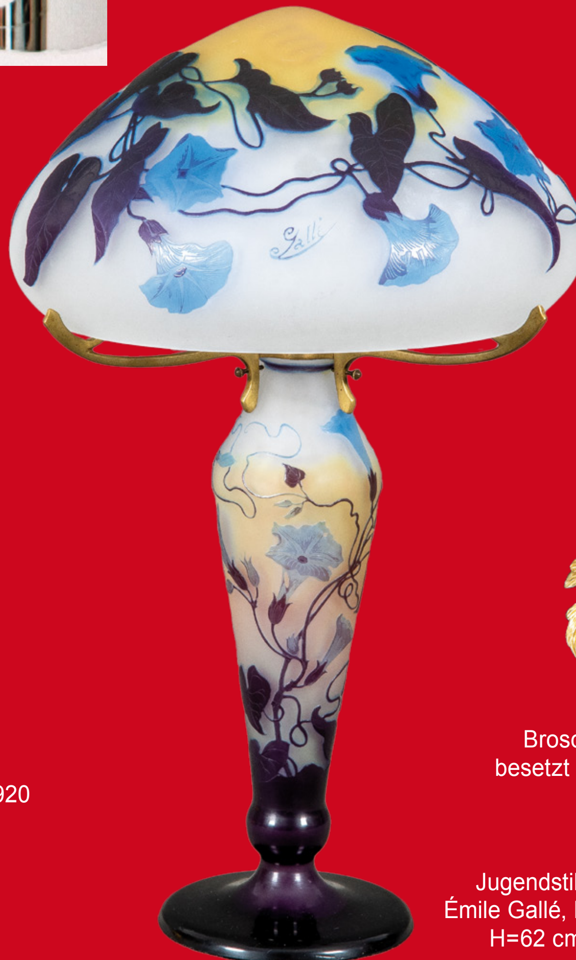
Jugendstil-Tischlampe Émile Gallé, Nancy um 1900 H=62 cm, D=35 cm