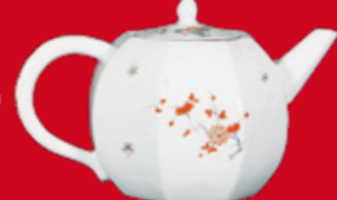
Meissen 1730 H=11 cm