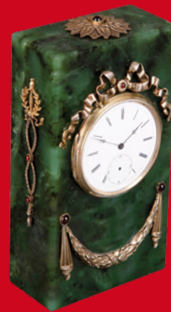
Tischuhr, Russland, Nephritgehäuse Silberapplikationen und Steinbesatz H=11,5 cm, B=6,3 cm, T=3,1 cm