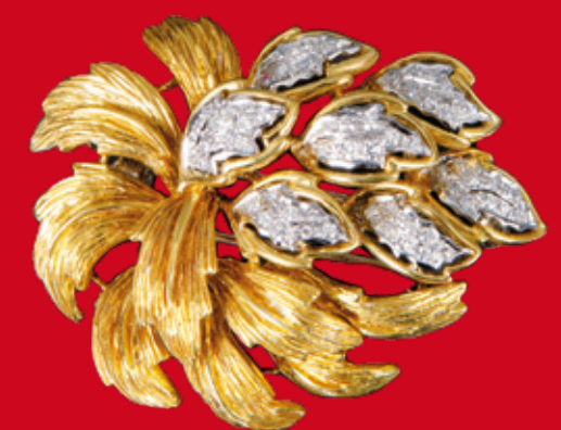
Brosche. 18 ct Goldfassung besetzt mit Brillanten, ca. 0,50 ct