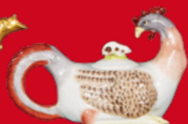
Meissen 1735 H=10,5 cm