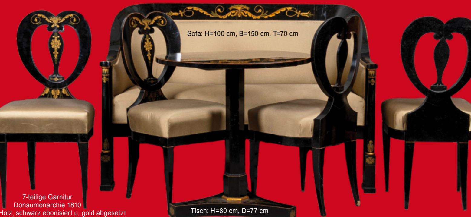
Sofa: H=100 cm, B=150 cm, T=70 cm