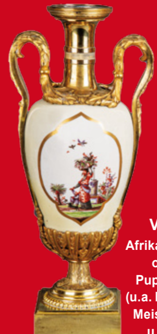
Meissen 1725-30 H=49 cm