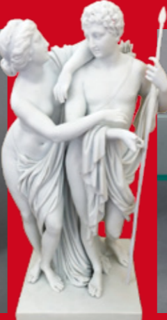
Meissen 1784-86 H=30,5 cm