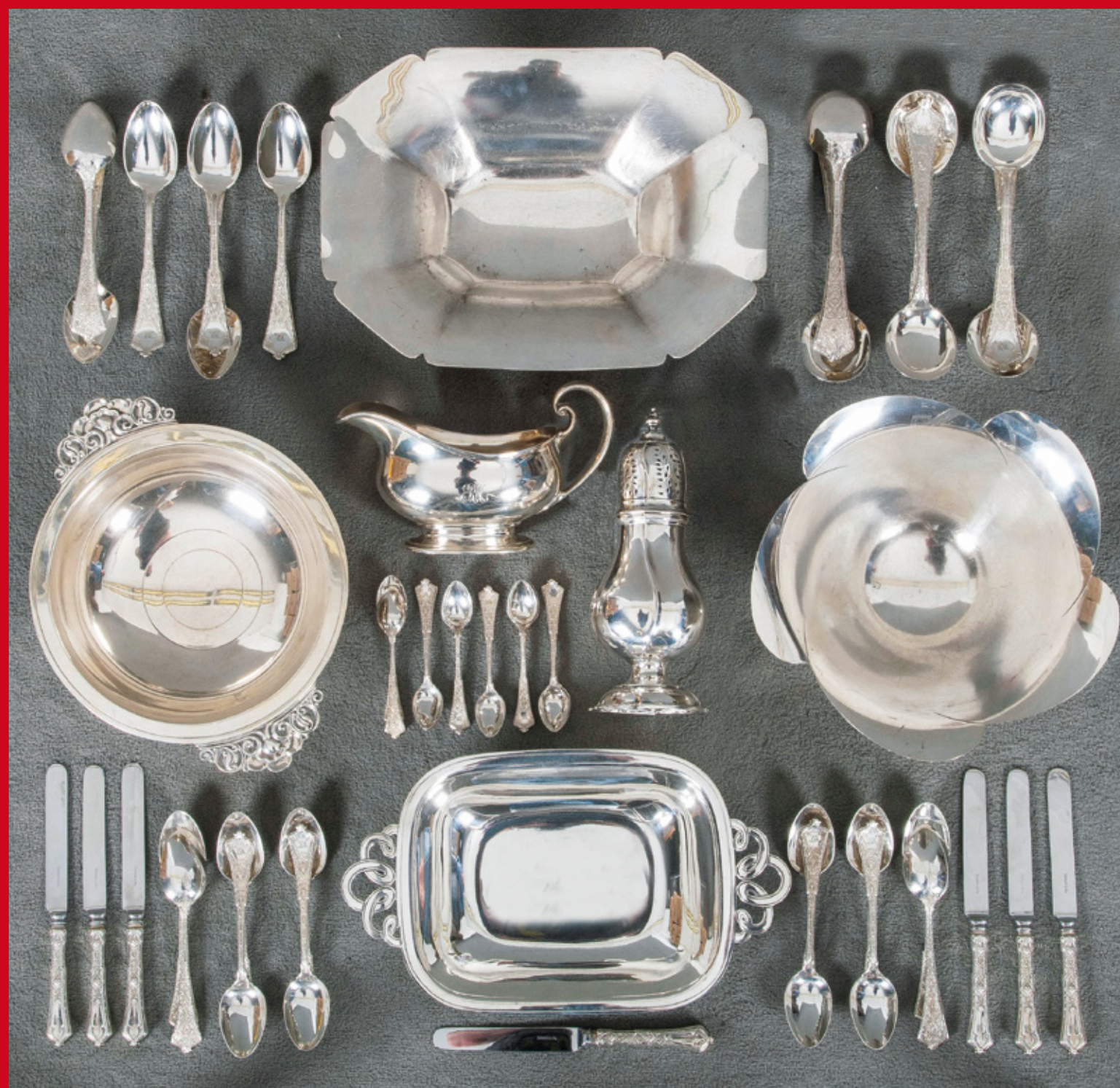
Sammlung Sterlingsilber, Tiffany & Co. New York 20. Jh.